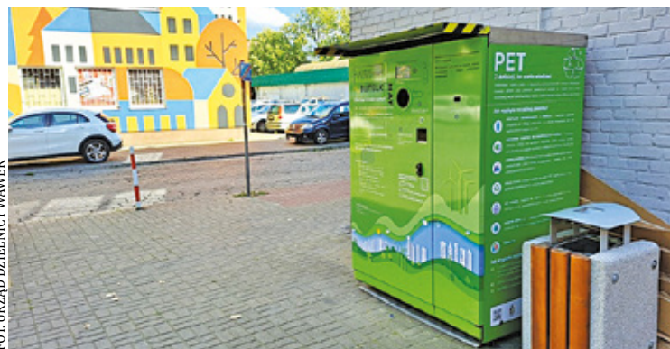
Butelkomat to łatwe w obsłudze urządzenie, gdzie można pozbyć się plastikowych butelek

W pierwszym dniu działania, dwa automaty (w Falenicy i Marysinie) nieestety nie działały, co spowodowało, że