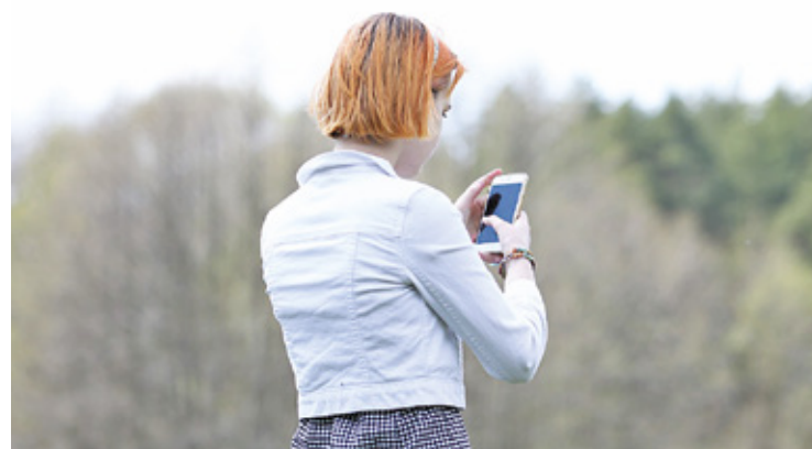
Infolinia pomocy psychologicznej to wsparcie dla osób doświadczających kryzysu psychicznego

Od 7 września do 29 grudnia 2023 roku w dni robocze w godzinach 17.00-19.00, uruchomiona zostanie infolinia