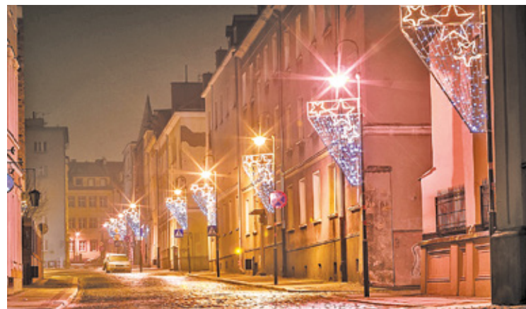
Pierwsze iluminacje świąteczne rozbrzmiały 4 grudnia

Jak przypomniał burmistrz, miasto czekać wielomilionowe wydatki związane z całym systemem oświetlenia. Dlatego też wygaszono już część oświetlenia na skwerze Kisiela oraz