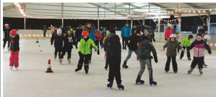
Z lesznowskiej ślizgawki korzystały osoby indywidualne, ale również szkoły