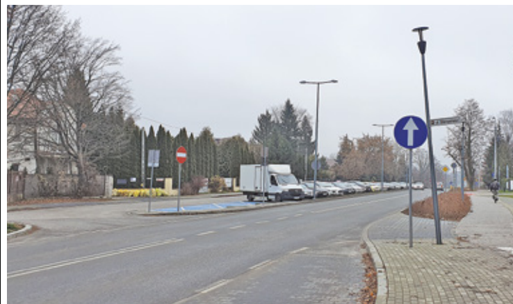
Okazuje się, że znak nie dotyczy ulicy Staropolskiej, a parkingu zlokalizowanego po drugiej stronie ul. Księcia Janusza I Staroego