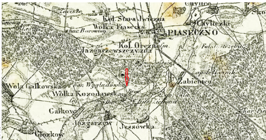
WIG mapa z 1864 strzałka wskazuje karczmę przy rozstajach dróg

stałyby szczątki walczących? Może metalowe guziki od mundurów, broń i inne części umundurowania, tylko tyle. Być może, że są tu pochówki z czasu wojny partyzanckiej powstania styczniowego. Wiem jedno – gdzie postawisz nogę na piaseczyńskiej ziemi, tam czeka