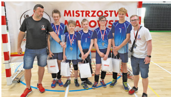
Najmłodszy adept Akademii Siatkówki T. Wójtowicza

W 1960 roku drużyna z Piaseczna spadła do A klasy. Brak sukcesów i ponowne kłopoty finansowe doprowadziły do rozwiązania zespołu. Drużynę