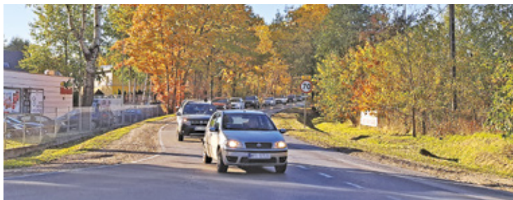
W ramach przebudowy drogi powstaną m.in. dwa ronda – jedno przy skrzyżowaniu z ul. Przesmyckiego