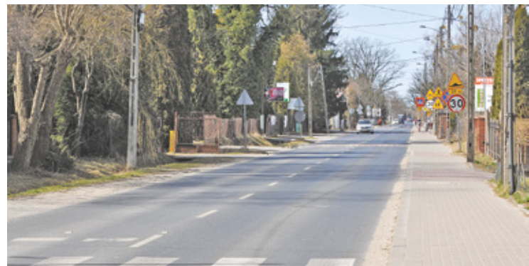
Przebudowa drogi ma poprawić komfort i bezpieczeństwo użytkowników