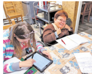
Podczas zajęć dorosłe osoby z niepełnosprawnościami uczą się m.in. samodzielności w życiu codziennym