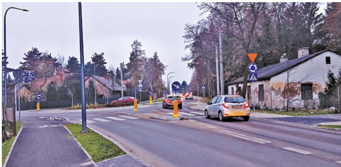
Skrzyżowanie ul. Dworskiej z ul. Pod Bateriami po przebudowie, zdjęcie z 23 listopada 2022 r. Widoczne rondo