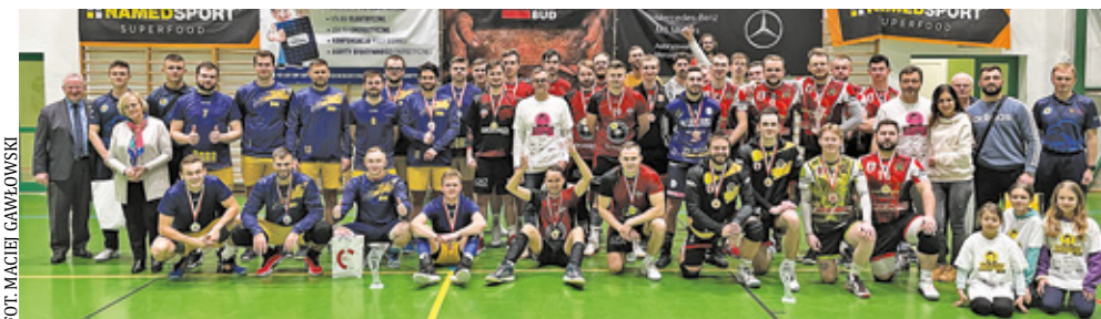
Uczestnicy XIX Memoriału Wiesława Gawłowskiego

W ubiegłych latach były pokazy lokalnej grupy tanecznej Grawitacja czy też konkursy dla publiczności.