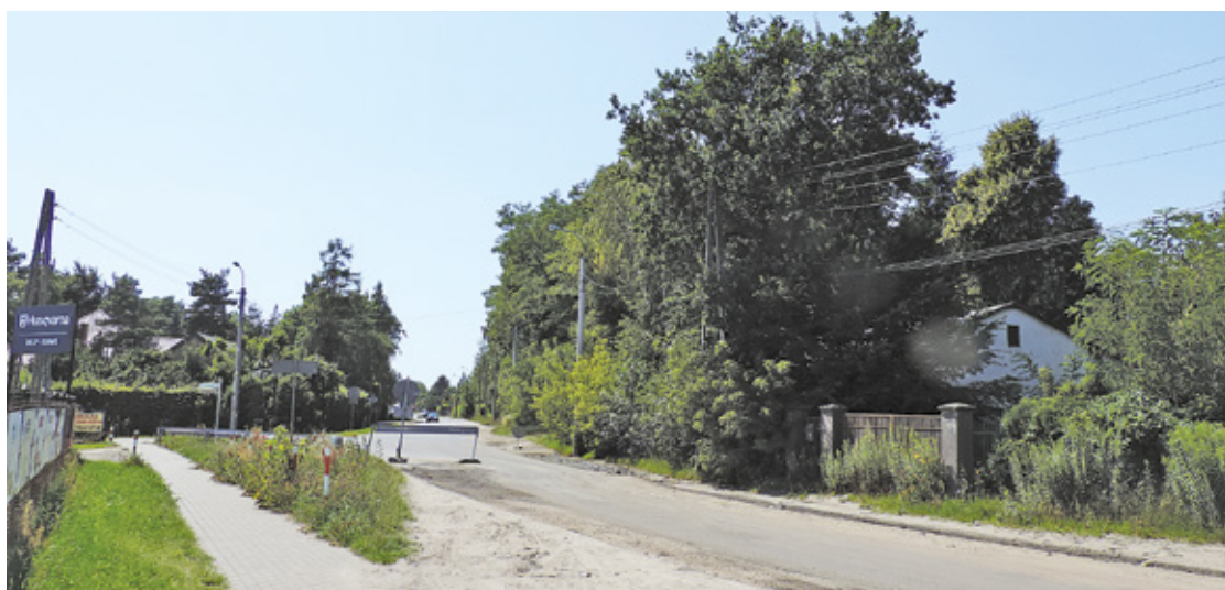
Skrzyżowanie ul. Dworskiej z ul. Pod Bateriami przed przebudową

jako dziecko ludzkie czaszki, wykopane przypadkowo podczas wymiany przy nowym rondzie. Nie słyszałem o ekshumacji, dlatego myślę, że wszyscy,