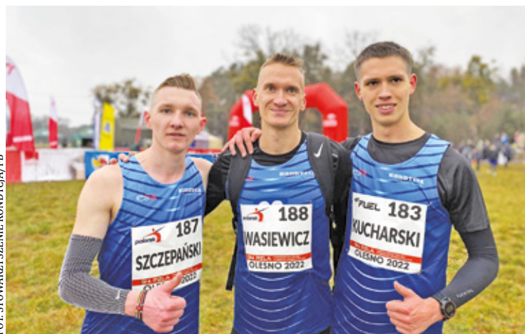
Srebrna drużyna Stowarzyszenia Kondycja Piaseczno

20 listopada miały miejsce Przejazdy Mistrzostwa Warszawy i Mazowsza, na których wielu biegaczy z Piaseczna pokazało ogromne umiejęt-