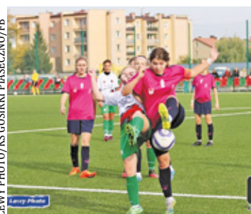
Październikowe starcie Gosirek ze Żbikiem Nasielsk (3:3) w IV lidze kobiet, grupa mazowiecka