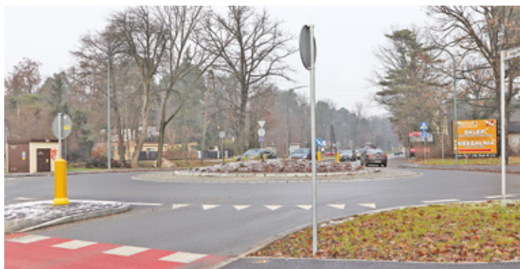
Nad wyborem nazw pracował Zespół Konsultacyjny ds. Dziedzictwa Piaseczna