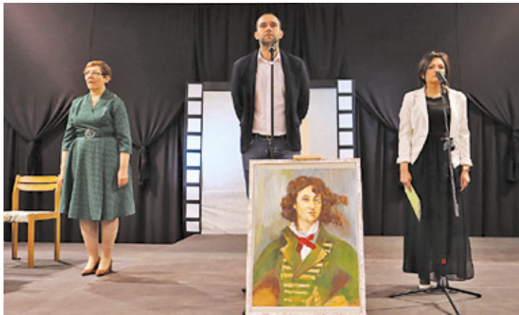
Z okazji jubileuszu odbyła się uroczystość, w której udział wzięli m.in. uczniowie, kadra pedagogiczna, ale także absolwenci placówki

– Nawiązując do długoletniej tradycji, zespołowi oraz wchodzącym w jego skład szkołom, nadano dumne imię Emilii Plater. Tych 20 lat to okres niezwykłego rozwoju. Działy się tu rze-