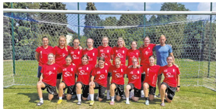
Gosirki podczas obozu przygotowawczego do sezonu 2022/2023