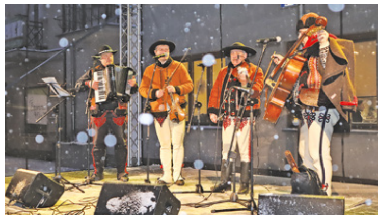
Na scenie wystąpił zespół Zbóje

Podczas kiermaszu nie zabrakło występów artystów. Na scenie zagrała: Piaseczyńska Orkiestra Dęta, uczestnicy muzycznych zajęć w Centrum Kultury oraz zespół Zbóje.