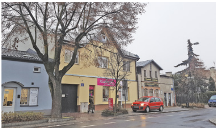
W miejscu istniejącej do niedawna piekarni przy ul. Sierakowskiego oraz na jej tyłach powstać mają dwa bloki