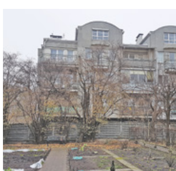
Widok z ogrodu Jolanty Woronieckiej. Jeśli planowana inwestycja powstanie, jej działka będzie otoczona blokami z trzech stron

Miasto zastrzega, że zabudowa wielorodzinną będzie dopuszczona, ale nie dominująca, bo w plan wpisane są również usługi publiczne, a zabudowa mieszkaniowa połączona jest z