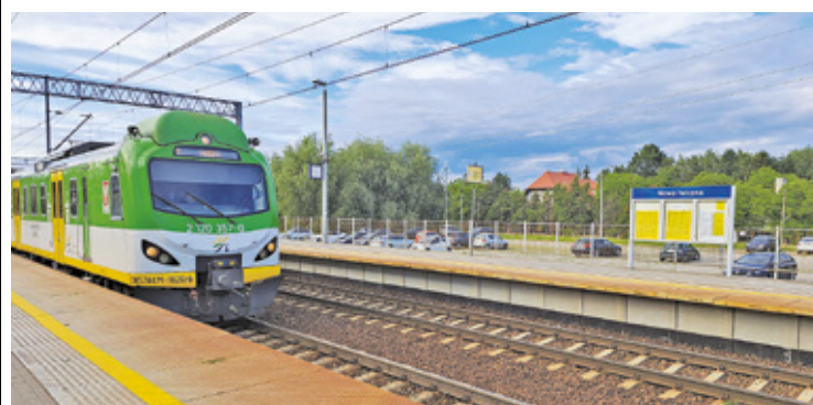
Spora kursów Kolei Mazowieckich ulegnie skróceniu

Ale nie tylko kolejowe. Komplikacje związane z koniecznością przesiadania się i szukania innych połączeń sprawią, że część pasażerów postanowi skorzystać z dojazdu do Warszawy samochodem. Albo autobusem. Czas dojazdu do stacji metra Wilanowska dzięki utworzeniu buspasa znacząco się skrócił, może to być więc atrakcyjną alternatywą dla pociągu w okresie komplikacji związanych z rozkładem jazdy pociągów.