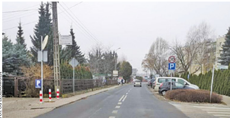
Nowa równa nawierzchnia drogi, cieszy kierowców

– Zniknęły i dziury, i pagórki, więc mistrzowie kierownicy korzystają z okazji i oczywiście za nic mają ograniczenia prędkości – poinformował nas