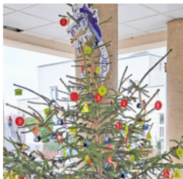
Każdy zainteresowany może sobie wziąć wybrany odblask z policyjnego drzewka

– Straż miejska w Piasecznie przekazała Komendzie Powiatowej Policji w Piasecznie ponad 2 tysiące elementów odblaskowych, które są następnie przekazywane mieszkańcom podczas organizowanych przez policję spotkań dotyczących bezpieczeństwa na drodze, między innymi w naszych szkołach i przedszkolach – informuje gmina Piaseczno. – Teraz te niewielkie elementy, które zdecydowanie poprawiają widoczność pieszego, a tym samym zwiększają jego bezpieczeństwo