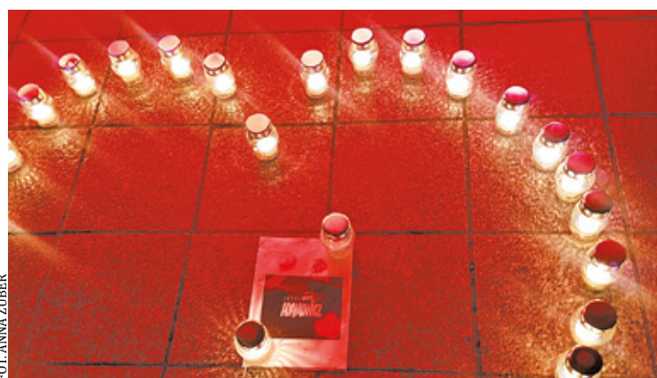
Podczas Finału WOŚP w Piasecznie uczczono pamięć Pawła Adamowicza, prezydenta Gdańska

przygotowało dla mieszkańców wiele atrakcji. Można było poprowadzić czerwoną drezynę, posłuchać historii i obejrzeć stare samochody.