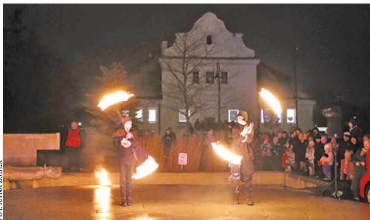
Wieczorny pokaz ognia przyciągnął dziesiątki mieszkańców

Piaseczyńsko-Grójeckie Towarzystwo Kolejki Wąskotorowej również