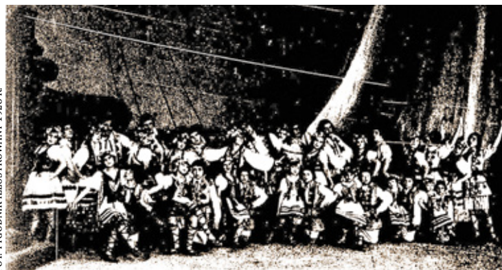
Balet dziecięcy w akcie III-im „Sireny” Maliszewskiego

Większość, bo tylko 4% spośród mieszkańców Zalesia, należała do ludzi mniej zamożnych, reszta to byli dyrektorzy bogatych przedsiębiorstw, wyżsi urzędnicy, inżynierowie, doktorzy.