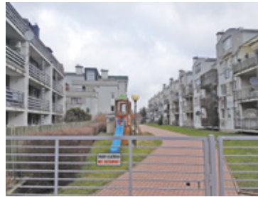
Kolejne osiedle w historycznym centrum miasta budzi sprzeciw mieszkańców istniejących już bloków

Inwestycji przeciwni są mieszkańcy sąsiednich domów jednorodzinnych, ale jak się okazuje, także bloków z ul. Żeromskiego. W pismach do burmistrza, rady miejskiej, starostwa, Powiatowego Inspektora Nadzoru Budowlanego zamieścili uwagi do dokumentacji projektowej, podkreślając, że część proponowanych rozwiązań jest niezgodna z obowiązującymi przepisami, narusza stosunki dobrosąsiedzkie, a inwestycja będzie miała znacząco negatywny wpływ na sąsiedztwo i centrum miasta. Wskazali m.in. prawdopodobieństwo przekroczenia dopuszczalnej intensywności zabudowy, brak zapewnienia wystarczającego nasłonecznienia dla części lokali zlokalizowanych w parterze projektowanego budynku. – Zrealizowanie dodatkowego budynku, o tak znacznej kubaturze, jeszcze drastyczniej ograniczy wymianę powietrza w rejonie Skweru Kisiela – czytamy w jednym z pism. – Powstanie „wyspa ciepła” z 4 stron ograniczona wysoką zabudową – argumentowali.