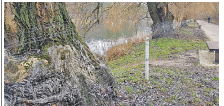
Bobry są roślinożercami i rozkoszują się niemal każdą dostępną częścią rośliny

Bobry są częściowo chronione, a jak czytamy na jednej ze stron internetowych Lasów Państwowych, to jedne z ciekawszych zwierząt żyjących w Polsce. Jednocześnie to jeden z tych gatunków, które wywołują najpoważniejsze konflikty na linii przyroda-człowiek, gdyż są niesamowitymi inżynierami i hydrotechnikami. – To jedyne zwierzę (po człowieku) umiejące na taką skalę manipulować środowiskiem. Stąd cały problem – podkreślają Lasy Państwowe.