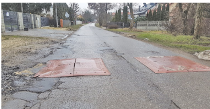
Droga na części odcinka nie posiada chodnika, a jej nawierzchnia pozostawia wiele do życzenia

Droga na części odcinka nie posiada chodnika, za to jej nawierzchnia pozostawia wiele do życzenia. Łącznik pomiędzy gminami Piaseczno i Konstancin-Jeziorna znalazł się w planach inwestycyjnych starostwa powiatowego na ten rok, które opracowuje już projekt dla tego zadania. Co więcej, dołoży się do niego gmina Piaseczno,