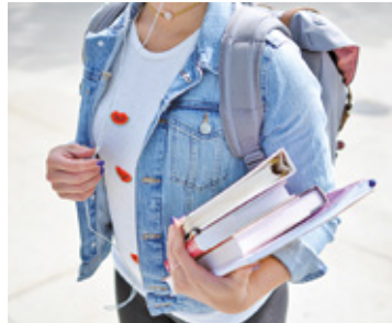
Stypendia trafią do wyróżniających się uczniów

Mowa o stypendium „Wzorowy Uczeń”, które przyznawane jest za średnią 5,0 z co najmniej 10 głównych przedmiotów oraz minimum bardzo dobrą ocenę z zachowania. W kategorii „Laureat” dodatkowo trzeba zostać laureatem konkursu naukowego, artystycznego lub sportowego określonej rangi. „Talent” to stypendium przyznawane na koniec edukacji uczniom, którzy w toku całej nauki w szkole średniej osiągnęli średnią na koniec roku minimum 4,5, mieli sukcesy w olimpiadach i konkursach lub wyróżniali się wyjątkową pracą społeczną. Stypendium „Wysokie Kompetencje” ma polegać