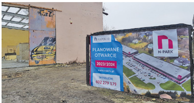
Centrum handlowe powstać ma przy drodze wojewódzkiej 722

zakupów w sąsiedztwie domu. Jego idea opiera się na bliskości, dostępności i oszczędności czasu. N-Park ma zapewniać podstawowe potrzeby zakupowe klienta. Kluczowe branże dla tych centrów handlowych to spożywcza, moda rodzinna, akcesoria, zdrowie i uroda. – W zależności od lokalizacji i potrzeb klientów poszerzamy ofertę o elektronikę, wyposażenie wnętrz czy segment hobby – informuje Napollo. – Format dopełniają usługi i gastronomia.