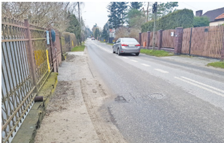
Gros kierowców nie stosuje się do ograniczenia prędkości, jakie obowiązuje na ul. Głównej, czyli 40 km/h

N a głównej drodze Żabieńca funkcjonowały spowalnice, które skutecznie uspokajały ruch. – Zaskoczyły mnie ostatnie przeprowadzone prace likwidujące progi zwalniające, o które walczyliśmy wcześniej długi czas – mówi jeden z mieszkańców. – Na tym fragmencie ulicy nie ma chodników, a posesje są przy samej drodze. Ulica