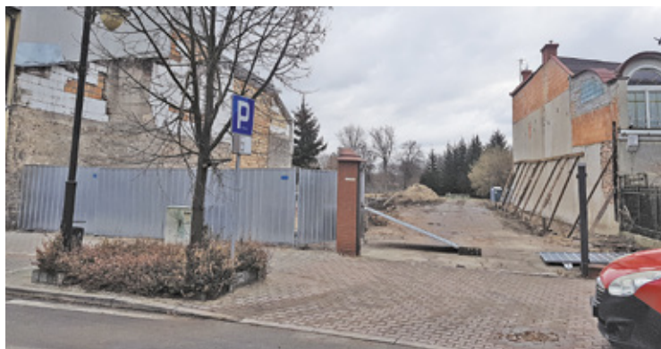
Spółka Talo Development nie ma jeszcze pozwolenia na budowę, ale w ostatnim czasie prowadziła prace rozbiórkowe

Przypomnijmy, przy ul. Sierakowskiego, pomiędzy skwerem Kisiela a parkiem miejskim, deweloper planuje budowę ok. 100 mieszkań wraz z parkingiem podziemnym. Budynek ma mieć wysokość 14 metrów i łącznie 6 kondygnacji, w tym dwie podziemne. Spółka Talo Development nie ma jeszcze pozwolenia na budowę, ale w ostatnim czasie prowadziła prace rozbiórkowe. Firma szacuje, że sprzedaż mieszkań rozpocznie po jego uzyskaniu i rozpoczęciu budowy, co może nastąpić za 2-3 lata.