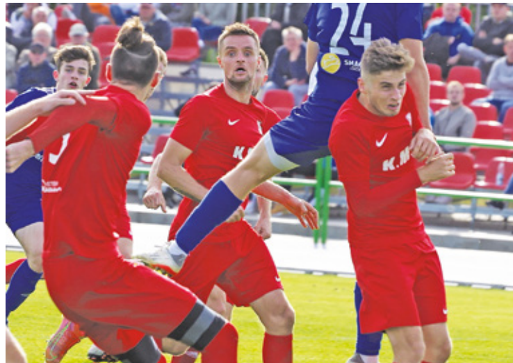
W rundzie wiosennej IV ligi nie zobaczymy już Orła Baniocha