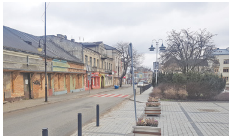
Nowy plan ma ożywić centrum miasta