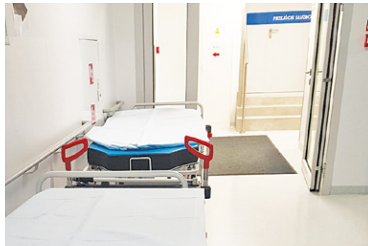
W styczniu odnotowano już ok. 1 mln Polaków z gripą lub podejrzanym zachorowaniem na grype

Specjaliści przypominają, że grypa to nie przeziębienie, a powodem jej ciężkiego przebiegu może być zaostrenie chorób przewlekłych już istniejących lub wystąpienie nowej choroby, czy wielonarządowe powikłania pogrypowe. Powikłania mogą wystąpić u każdego, niezależnie od wieku i stanu zdrowia, a najskuteczniejszą ochronę