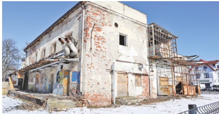
W ostatnim czasie w sąsiedztwie budynku wycięto dziko rosnące i niezbyt estetyczne rośliny oraz uzupełniono braki w ogrodzeniu. Część paneli została ukradziona

W ostatnim czasie w sąsiedztwie budynku wycięto dziko rosnące i niezbyt estetyczne rośliny. – Uzupelniono