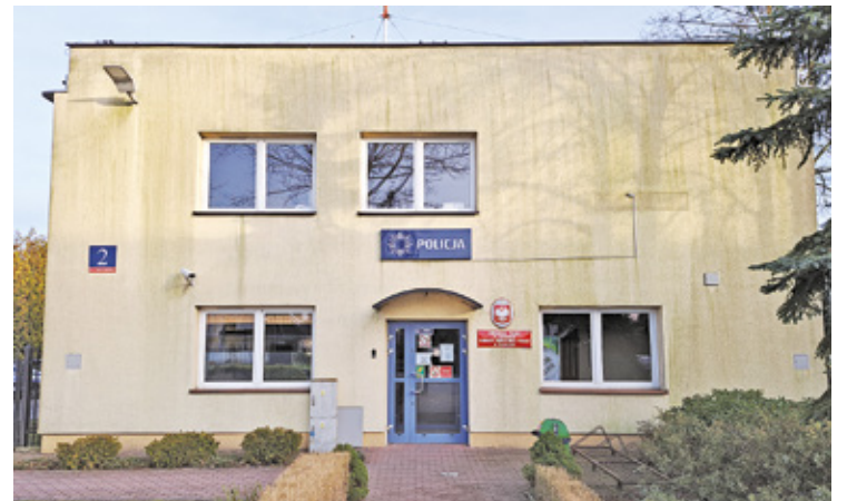
Jako pierwszy w godzinach nocnych został zamknięty komisariat w Lesznowoli

– Analizujemy sytuację we wszystkich jednostkach i wszędzie szukamy racjonalnych rozwiązań w organizacji pracy – powiedziała nam przed tygodniem rzeczniczka KPP w Piasecznie. I poinformowała, że od 10 lutego zamknięty w godzinach nocnych zostanie również komisariat w Konstancinie-Jeziornie. Na początku tygodnia okazało się jednak, że czas przyjmowania zgłoszeń skrócono już także w pozostałych dwóch komisariatach – w Tarczynie i Górze Kalwarii. Tu również drzwi będą zamknięte dla mieszkańców między