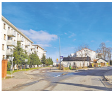
Jako pierwsze zostanie zbudowane rondo na skrzyżowaniu ulic Stępkowskiego i Reszki

Na terenie gminy Tarczyn niebawem zostaną zbudowane trzy ronda. Dwa z nich zbuduje powiat a trzecie Mazowiecki Zarząd Dróg Wojewódzkich.