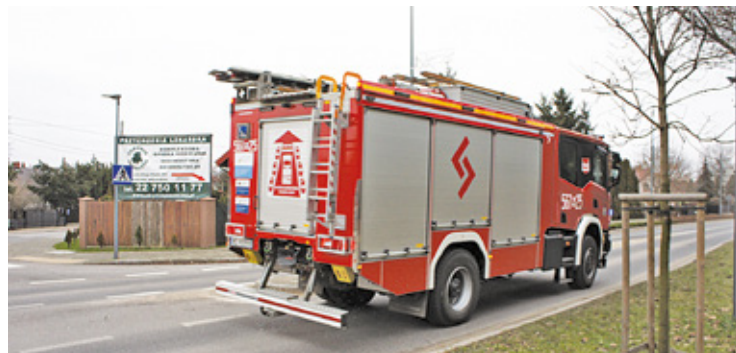
2022 rok był najbardziej pracowitym rokiem w 30-letniej historii strażaków z Piaseczna

Ich pomoc była niezbędna także w pożarach drogowych, bo aż 38 razy gasili samochody osobowe i przyczepy samochodów osobowych. Zdecydowanie mniej, bo 3 zdarzenia dotyczyły aut ciężarowych czy maszyn drogowych.