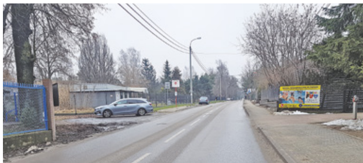
Mieszkańcy chcieliby, aby w rejonie przystanków, zlokalizowanych na skraju Piaseczna i Wólki Kozodawskiej, wymalowano „zebrę”

Ulica Dworska to około półtora-kilometrowa droga powiatowa, wiodąca od ronda w Piasecznie na ul. Pod Bateriami, przez mostek na rzece Jeziorce, aż do ronda przy cmentarzu