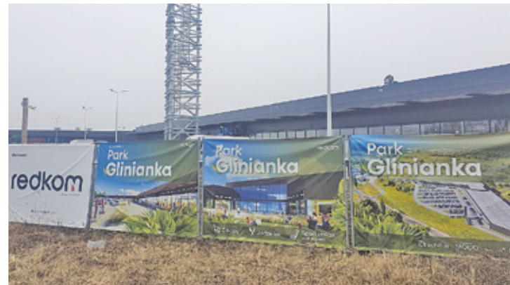
Otwarcie kompleksu zaplanowano na koniec pierwszego kwartału tego roku