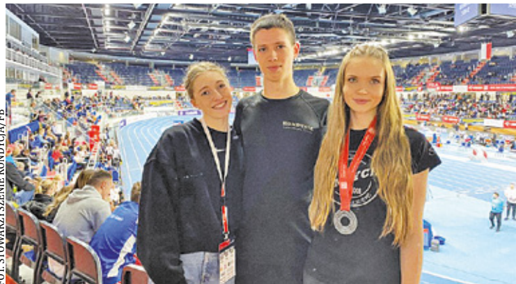
Świetne występy Kondycji podczas 67. Halowych Mistrzostw Polski