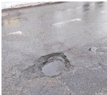
Zastanawiający jest fakt, że tak pokazywany rozmiarów dziura powstała w tak krótkim czasie i nikt jej nie zauważył

J ak opowiada nasz Czytelnik (imię i nazwisko znane redakcji), w wyrwę wjechał na środku drogi i skrzyżowania ul. Krasickiego z Kielecką. Niestety doszło do uszkodzenia prawej przedniej opony. Mężczyzna wezwał na mie-