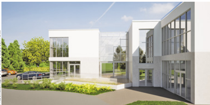
WIZUALIZACJA: POWIAT PIASECZYŃSKI

Poszukiwanie odpowiedniego miejsca do prowadzenia WTZ na terenie gminy Piaseczno trwało od kilku lat. Terapia zajęciowa jest ważną metodą rehabilitacji fizycznej, psychicznej, społecznej i zawodowej osób z niepełnosprawnościami. Obecnie warsztaty prowadzone są w Górze Kalwarii a także w przykościelnym budynku przy ul. Modrzewiowej w Piasecznie. Dzięki porozumieniu władz gminy Piaseczno z powiatem znaleziono rozwiązanie, które pozwoli na realizację zadań z zakresu rehabilitacji społecznej i zawodowej oraz wsparcia osób z niepełnosprawnościami blisko centrum Piaseczna. Gmina przekazała powiatowi na ten cel budynek dawnego żłobka