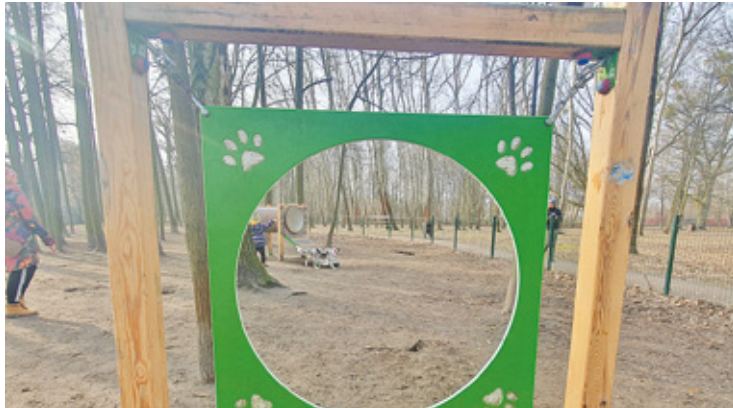
Najpewniej z powodu kontroli straży miejskiej właściciele psów zaczęli stosować się do regulaminu parku, choć jak można się przekonać, wciąż nie wszyscy

P ark posiada wybieg dla psów, jednak niektórzy właściciele spuszcza je ze smyczy poza tym terenem. W ostatnim czasie w parku i jego okolicach miało dojść do kilku niebez-