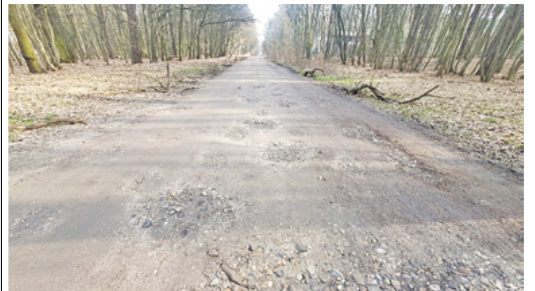
Nieutwardzony odcinek Alei Kasztanów

miała 5 m szerokości jezdni z kostki, wyposażonej w brukowe spowalnicze/klepsydry. U zbiegu z ul. Jarzębinową i Głogową powstaną skrzyżowania wyniesione, a odwodnienie będzie powierzchniowe, skierowane do muldy chłonnej zlokalizowanej w leśnym poboczu. Na wyjątkowo grząskiej ul. Głogowej konieczne będzie wybudowanie odwodnienia krytego, które zostanie poprowadzone pod al. Kasztanów do rowu przy ul. Cisowej, zbierając też przy okazji jakąś część deszczówki z al. Kasztanów. – Z tego względu obie