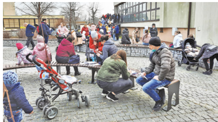
Do wyrobienia polskiego numeru PESEL ustawiały się bardzo długie kolejki

Byłam zaskoczona, jak wszystko było świetnie zorganizowane, koce dla dzie-