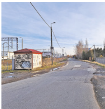
Droga powstanie na przedłużeniu ulicy Kolejowej

Powiat otrzymał rządową dotację na budowę nowej drogi łączącej ulicę Oręzną z istniejącym odcinkiem ulicy Kolejowej i ulicą Słoneczną. Droga wzdłuż torów kolejowych pozwoli ominąć przejazd kolejowe. Czy jednak usprawni ruch?