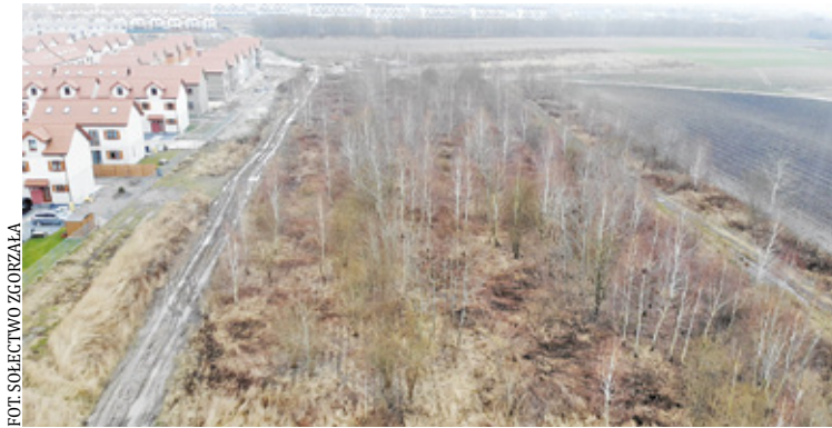
W najbliższym czasie działka mogłaby pełnić funkcję terenu rekreacyjnego

Dzięki staraniom sołtysa i kilkorga mieszkańców Zgorzały udało się przekonać właściciela jednej z nieruchomości do nieodpłatnego użyczenia gruntu na teren rekreacyjny a w przyszłości sprzedaży liczącej 1,68 ha działki na budowę nowej szkoły.