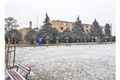
Niebawem do kupienia będzie również nieruchomość nieopodal stawu w Mysiadle

Gmina szuka kolejnych sposobów na sprzedaż działek z terenu KPGO Mysiadło. Nadzieje związane z tymi nieruchomościami były wielkie, ale wciąż nie ma chętnych do ich nabycia.