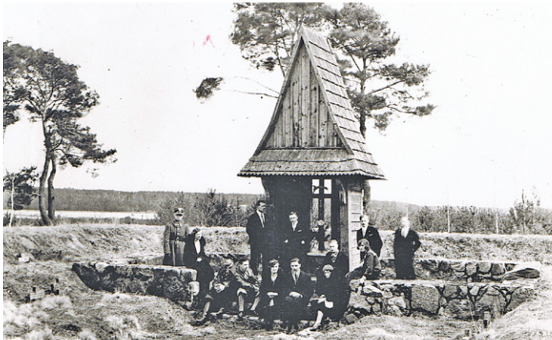
Cmentarz Różanka w okresie międzywojennym