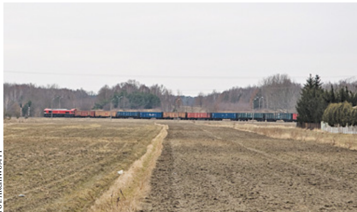
Tereny między torami kolejowymi a ratuszem miałyby zamienić się w osiedle mieszkaniowe

Państwo wyobraźcie sobie, że tu powstaną takie klasyczne bloki. My też takich bloków nie chcemy, chcemy, żeby