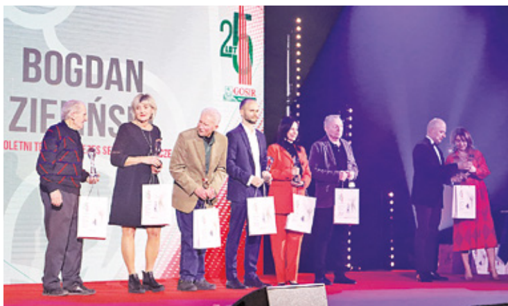
Podczas gali nagrodzono byłych i obecnych zawodników, trenerów i działaczy