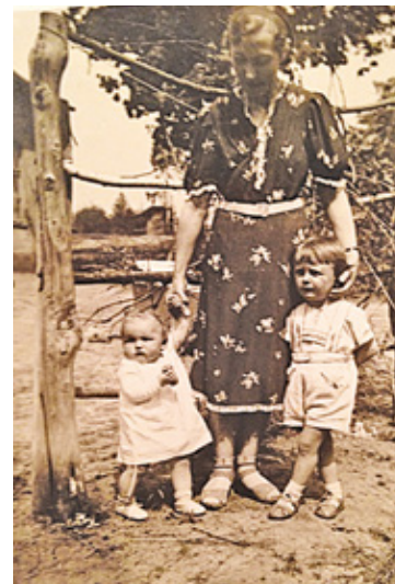
Rodzina Bauerfeindów przed oficyną dworską, okres międzywojenny

swym przy ul. Królewskiej nr 23. Tak jedni, jak i drudzy, prócz pomieszczenia otrzymują całodzienne życie”. I dalej w tej samej gazecie: „Między Piasecznem