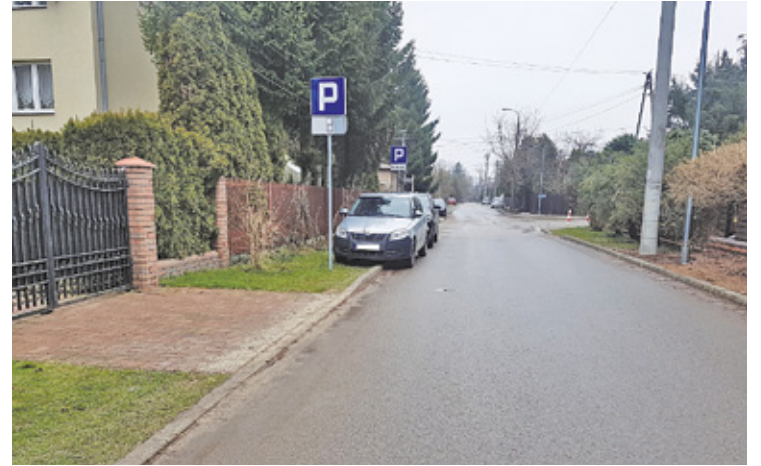
Mieszkańcy podkreślają, że po wdrożeniu zmian nie boją się przechodzić przez ulicę

– Wyeliminowaliśmy to parkowanie, gdzie popadnie, zastawianie autami ulic i bram posesji, wprowadzając stałą organizację ruchu. Gdy to wdrożyliśmy, pojawiły się inne głosy, że nie ma gdzie parkować, żeby móc skorzystać z transportu publicznego, że miejsc jest za mało – mówił podczas komisji prawa i bezpieczeństwa Rady Miejskiej w Piasecznie wiceburmistrz