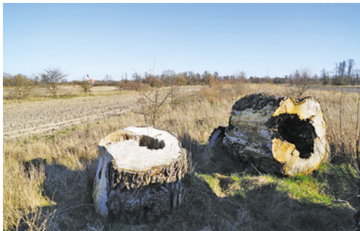
Łąki w Gołkowie

swym przy ul. Królewskiej nr 23. Tak jedni, jak i drudzy, prócz pomieszczenia otrzymują całodzienne życie”. I dalej w tej samej gazecie: „Między Piasecznem