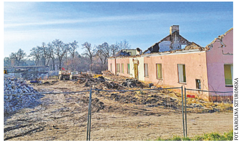
Oficyna dworska w Gołkowie w marcu 2023 r.