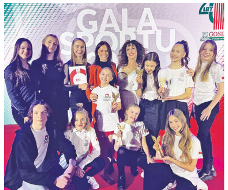
Gala Sportu w Piasecznie

w (Zalesie Górne, Głosków, Jazgarzew, Chylice, Bobrowiec, Żabieniec, Henryków-Urocz). Ponadto GOSiR angażuje się w pomoc w utrzymaniu obiektów