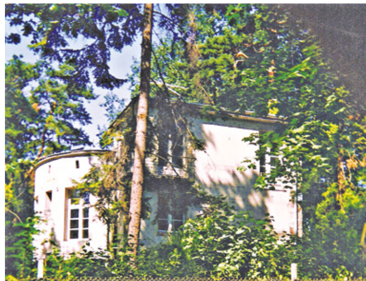
Willa przy ul. Jaworowej 2. w 1993 r.

na pani. Rodzice zakwaterowali ją w swojej kuchni i weszła szybko w skład rodziny. Tymczasem ojciec, który umiał wymyślić zajęcie przynoszące zysk, był bardzo pomysłowym konstruktorem