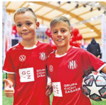
W turniejach organizowanych przez GOSiR uczestniczy wiele dzieci i młodzieży

Pierwszymi obiektami GOSiR-u była kryta pływalnia oraz hala sportowa przy ulicy Sikorskiego 20 w Piasecznie. Dziś Ośrodek znacząco poszerzył infrastrukturę, którą zarządza. W jej skład wchodzi między innymi: Stadion