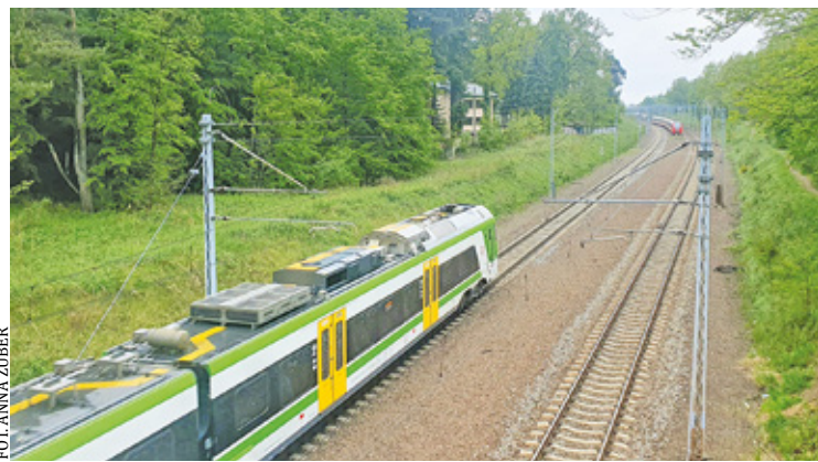
Podróż koleją nad Jezioro Zegrzyńskie to opcja nie tylko szybsza, ale też mniej uciążliwa i tańsza

ale też motorówkami czy skuterami wodnymi. Wokół zalewu znajduje się mnóstwo atrakcji. Są tu restauracje, place zabaw, park linowy, boiska, kawiarnie, promenada, wypożyczalnie rowerów, ale też baza noclegowa, w tym domki letniskowe. Przede wszystkim także piękna plaża, na której można zorganizować rodzinny piknik, czy po