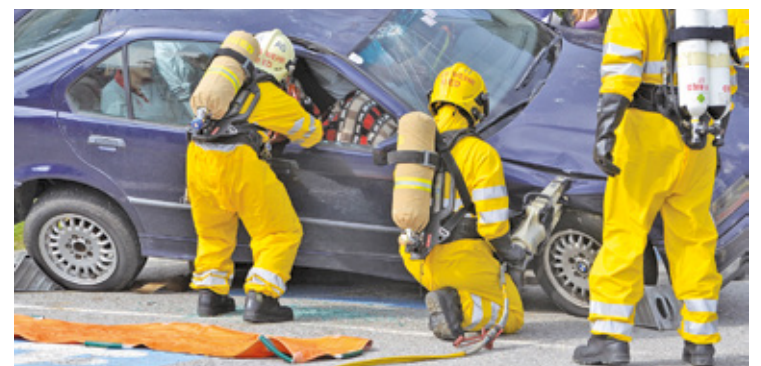
Zaostrzenie przepisów, zdaniem specjalistów, zwiększyło bezpieczeństwo na drogach

bezpieczeństwo ruchu drogowego. To, co ma się zmienić, jeśli nowelizacja zostanie przyjęta, to sposób reedukacji