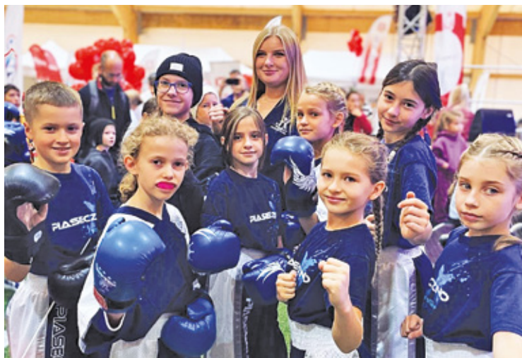
Działalność Ośrodka pozwoliła na rozwój wielu dyscyplin sportowych

GOSiR to przede wszystkim pracujący w nim ludzie – bez nich wszystko to nie byłoby możliwe. Pracownicy,