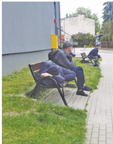
Zdaniem mieszkańców, sytuacja na skwerze nie uległa poprawie

Wówczas miasto zapowiedziało, że zlikwiduje część ławek, co spotkało się z różnymi opiniami. – Oczywiście, zabierzmy ławki, zlikwidujemy skwer-