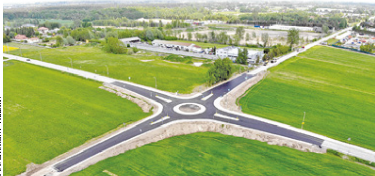
Z zakończenia inwestycji w ekspresowym tempie cieszą się mieszkańcy i kierowcy

B udowa ronda ruszyła w czwartek 20 kwietnia, a wykonawca miał czas na oddanie inwestycji do 21 czerwca. Prace poprowadził jednak wyjątkowo sprawnie i skrzyżowanie jest niemalże gotowe. Już w sobotę 20 maja po południu, po ułożeniu nawierzchni bitumicznej, umożliwiono