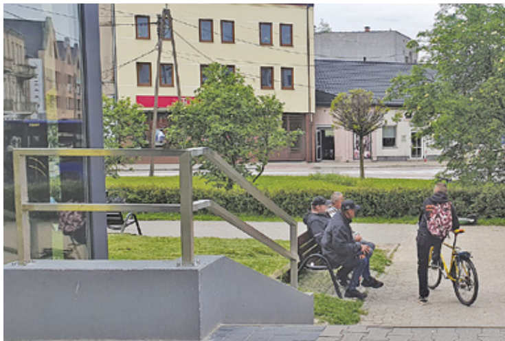
Osoby przesiadujące na ławkach nierzadko spożywają na nich alkohol

Władze miasta zapewniały, że strażnicy miejscy mają na oku to, co