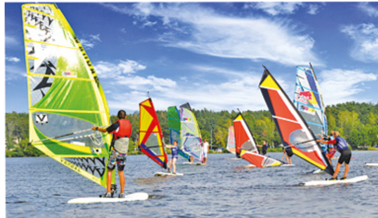
Jezioro Zegrzyńskie to miejsce do wypoczynku i uprawiania sportów wodnych

Dla mieszkańców Piaseczna i okolic wycieczka nad Zalew Zegrzyński to niemała wyprawa. Podróż autem to około 70-kilometrowa trasa, która może skończyć się po upływie ok. półtorej godziny, o ile nie utkniemy na tra-