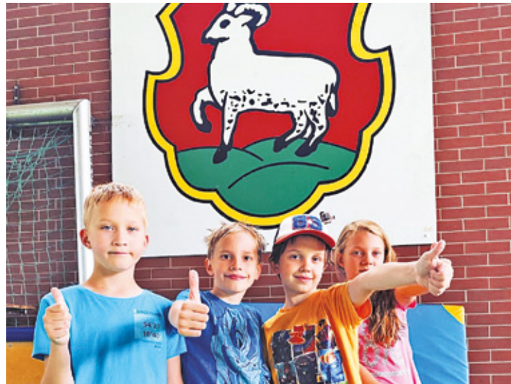
Miejsce tętniące sportem i budujące lokalną społeczność

Miejski w Piasecznie, skatepark, boiska typu „orlik”, lodowisko i rolkowisko, korty tenisowe, tor modelarski „RC Park”, a także gminne obiekty sporto-