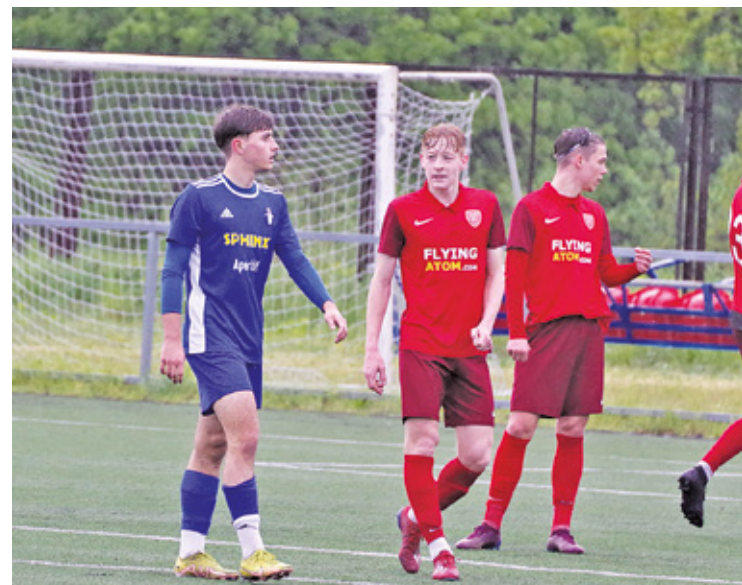
Jedyny reprezentant powiatu w IV Lidze zajmuje aktualnie 6. miejsce w tabeli

Choć Korona Góra Kalwaria maj zaczęła od bezbramkowego remisu u siebie z Laurą Chylice, w dalszych meczach zanotowała same porażki – z GLKS Nadarzyn (1:2), GKS Podolszyn (1:2 zweryfikowane jako walkower) oraz liderem Ożarówianką Ożarów Mazowiecki (1:10). Ogólny bilans klubu w tym sezonie to 3 wygrane, 3 remisy