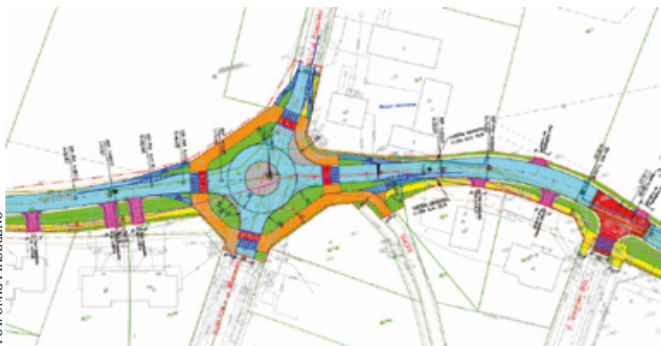
Urząd przedłużył termin zgłaszania uwag do projektu do końca czerwca