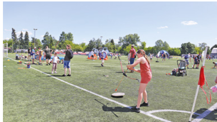
Z okazji jubileuszu GOSiR-u można było spróbować swoich sił w różnych dyscyplinach sportowych

W niedzielę odbył się spływ kajakowy Jezioroką, a także zawody, m.in.