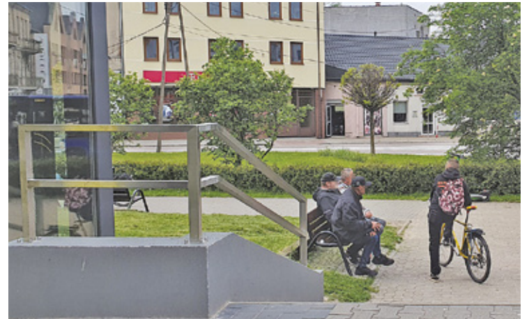
Osoby przesiadujące na ławkach nierzadko spożywają na nich alkohol