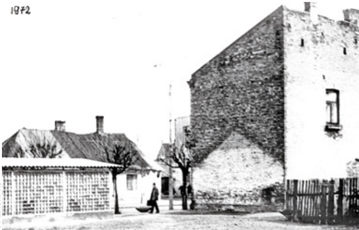
Kamienica Sikorskich. Ślady na ścianie wyburzonego drewnianego domu, 1972

rodzącej kobiety i Janinę biegnącą w środku nocy z dużą torbą lekarską, aby jej w porę pomóc. Trzeba tu nadmienić,