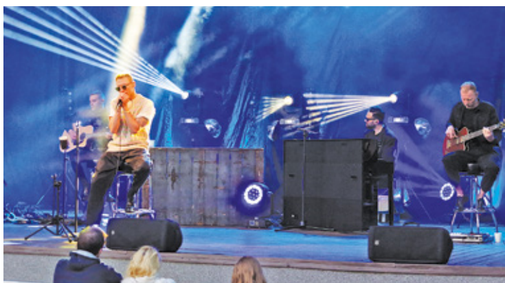
Gwiazdą wieczoru był zespół LemON

skie”, zorganizowano też rodzinne warsztaty szachowe oraz warsztaty nauki jazdy na rollkach. Imprezie towarzyszył także przejazd rolkarzy, wrotkarzy oraz rowerzystów ulicami Konstancina-