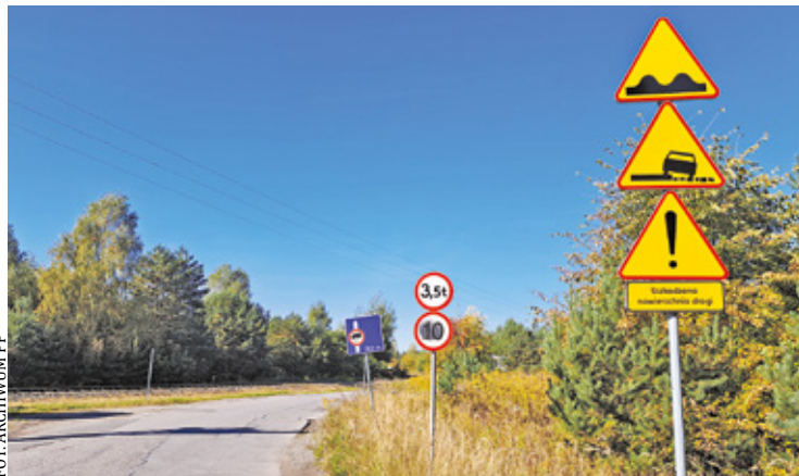
Mieszkańcy od lat czekają na remont łącznika pomiędzy Konstancinem-Jeziorną a Piasecznem