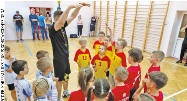
Dom Sikorskich w latach 70.

Pod koniec maja w Szkole Podstawowej nr 3 w Konstancinie-Jeziornie miał miejsce XXIII Ogólnopolski Turniej Korfbalu. Wydarzenie stało się okazją do rywalizacji dla zawodników z całego kraju – na boisku rozgrywało mecze 20 drużyn w 5 różnych kategoriach wiekowych. Imprezie towa-