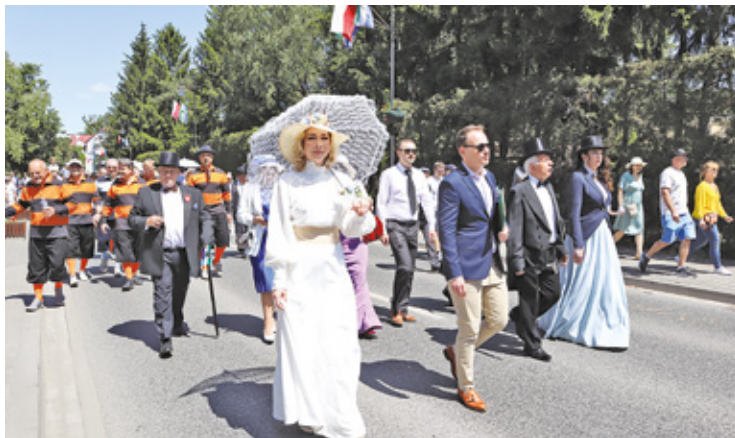
Jak co roku ulicami miasta przeszła parada

W sobotę odbył się pokaz modeli pływających oraz konkurs na Retro Łatawiec. Otwarto dwie wystawy fotografii. Zdjęcia Roberta Czułby „Moja własna historia”, można było podziwiać