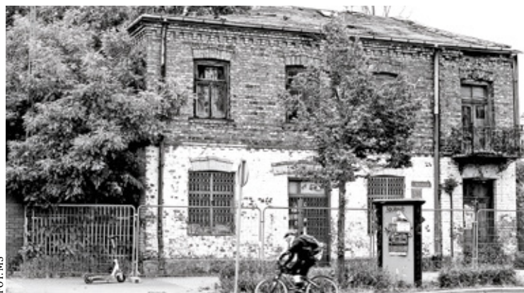
Zdjęcie kamienicy z czerwca 2023 r.