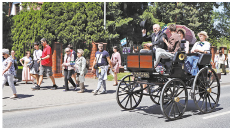
Z okazji Dni Konstancina ulicami miasta przejechał korowód zabytkowych aut

zimierem Jańczukiem, w stylizacjach rodem z belle époque przeszli ulicami miasta do Parku Zdrojowego. Tam na świętujących gości czekały zabytkowe samochody, warsztaty artystyczne, animacje dla dzieci, a nawet loty balonem. Rozegrano także mecz retro piłki nożnej. Tańczono walce, walczyki, choć należy pamiętać, że w pięknej epoce we Francji tańczono także kankana. Również w niedzielę odbyła się potańcówka. Bal Apaszów, podczas którego zabrzmiała muzyka retro oraz piosenki