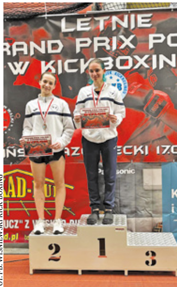
Sukcesy w kickboxingu na zawodach w Mińsku Mazowieckim

W sobotę 17 czerwca odbyło się Letnie Grand Prix Polski w Kickboxingu. Walki toczyły się w formatach kick-light, point-fighting, a także musical forms w różnych kategoriach wiekowych. Nie zapomniano również o najmłodszych, którzy mogli toczyć pojedynki w walkach na pałki piankowe czy też spróbować swoich sił na torze przeszkód. Turniej sportowy pod patronatem Polskiego Związku Kickboxingu przyciągnął ogółem 271 zgłoszonych zawodników z 32 klubów z całej Polski. Z ekip z terenu powiatu piaseczyńskiego w rywalizacji uczestniczyli: X Fight Piaseczno, UKS Tom Bee Team Góra Kalwaria, Stowarzyszenie Wiśniewski Kick-boxing Piaseczno-Łoziska oraz Klub Sportowy Centrum