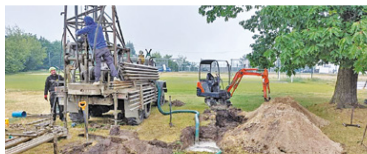
Drążenie drugiej studni głębinowej

– W rozporządzeniu były jasno wymienione priorytety: jakie wody