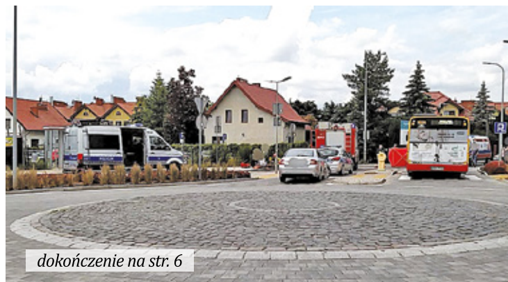
dokończenie na str. 6

W środę (14 czerwca) na ul. Kameralnej autobus lokalnej linii L39 potrafił dwie dziewczynki. Niestety jedna z 12-latek zginęła na miejscu. Mimo trwającej blisko godzinę reanimacji, służbom medycznym nie udało się przywrócić jej funkcji życiowych.