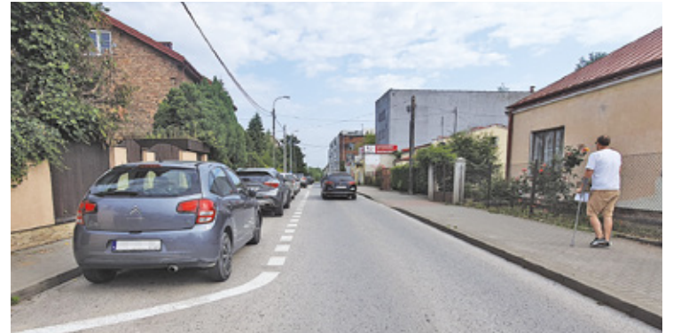
Możliwe, że strefa płatnego parkowania na ul. Czajewicza będzie uruchomiona jeszcze w tym roku

Na wyznaczonych miejscach parkingowych brakuje rotacji aut, prawdopodobnie dlatego, że są one zajmowane rano przez pracowników okolicznych instytucji na niemal cały dzień.