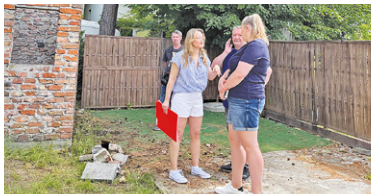
Ekipa programu „Nasz Nowy Dom”

Zapraszamy wszystkich do spędzenia wyjątkowego weekendu w magicznej atmosferze Nocy Kupały na zamku w Czersku.