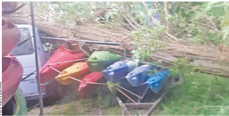
Drzewo poważnie uszkodziło samochód, który służył do przewożenia kajaków