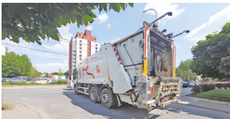
Aby móc odbierać odpady w godzinach popołudniowych i wieczornych PUK wprowadził drugą zmianę

Przypominamy o segregowaniu śmieci, co ma niebagatelny wpływ na