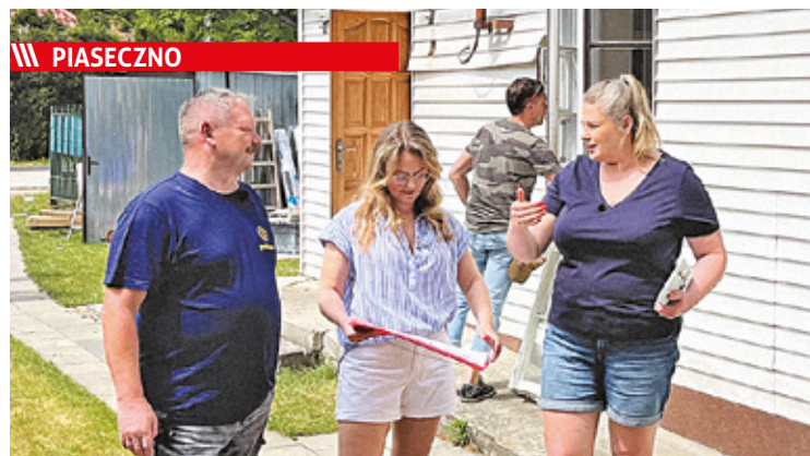
Ekipa programu „Nasz Nowy Dom”