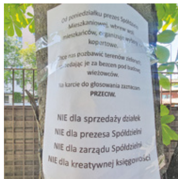
Ogłoszenie przeciwników działań obecnych władz SM Jedność

nych. Jak przekonywali, chcieli mieć możliwość, zabrania głosu i wypowiedzenia opinii na temat działalności spółdzielni oraz sprzedaży działek, a wybory kopertowe zabierają im taką możliwość. Mimo spotkań i rozmów z przedstawicielem spółdzielni, stowarzyszenie nie otrzymało odpowiedzi w sprawie głosowania stacjonarnego i w poniedziałek rozpoczęły się wybory kopertowe oraz głosowanie w tej formie uchwał.