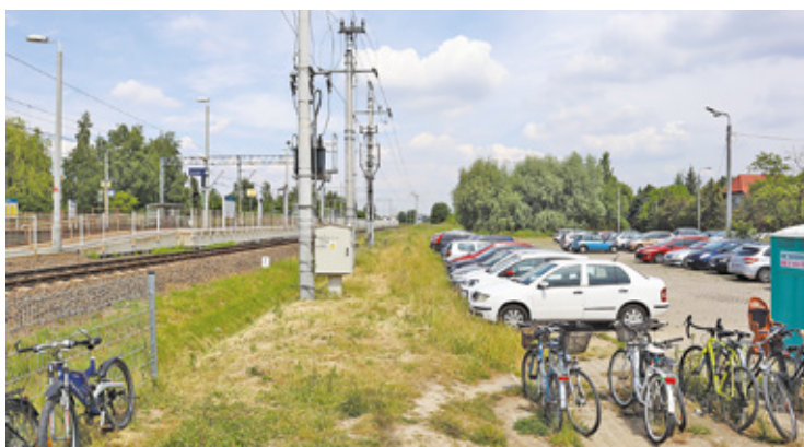
Mieszkańcy martwią się o to, gdzie będą zostawiać swoje samochody od 1 lipca

W ostatnim czasie w popularnym serwisie sprzedażowym pojawiła się oferta wynajmu „atrakcyjnego gruntu pod Warszawą”, obok stacji PKP Nowa Iwiczna. Na zdjęciach widać parking, z którego korzystają dziesiątki, a może nawet setki miesz-