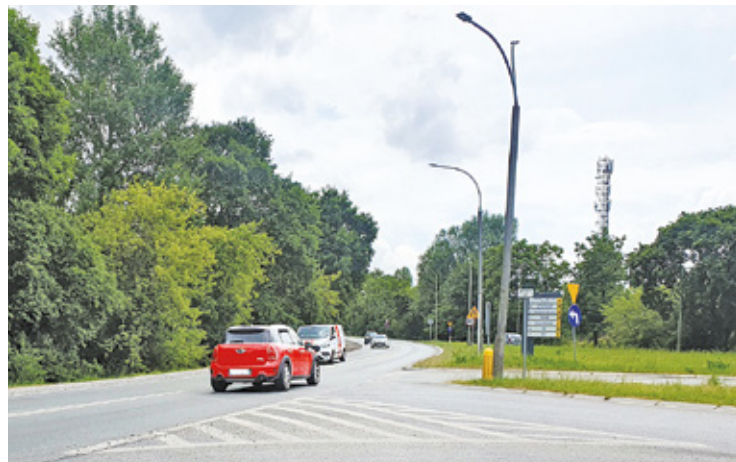
W miejscu niebezpiecznego skrzyżowania drogi krajowej nr 79 z ulicą Księcia Janusza I Starego powstanie węzeł drogowy

kimi zainteresowanymi projektem rozbudowy odcinka o długości ok. 7,8 km DK79 pomiędzy Piasecznem a Solcem. – Będzie to czas na zapoznanie się z projektem, na zadawanie pytań i zgłaszanie postulatów – zapewnia Małgorzata Tarnowska z GDDKiA. – Następnie projektanci przeanalizują zgłaszane postulaty pod względem możliwych korekt przedstawionych rozwiązań