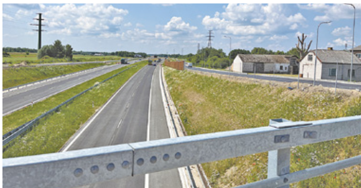
Nowo wybudowany odcinek trasy S7

Problem dotyczy przede wszystkim Wilczej Góry, Władysławowa oraz Antoninowa. Okazuje się jednak, że huk przejeżdżających trasą S7 pojazdów