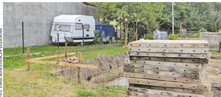
Dom sołdecki w Kawęczynie będzie służył wszystkim mieszkańcom wsi, ale także sąsiadom z pobliskich Turowic

– My czekaliśmy na ten dom 20 lat. Nie mieliśmy swojego miejsca, które byłoby przeznaczone dla mieszkańców. Teraz to się zmieni. To nie tak, że tutaj