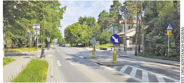
Będzie sygnalizacja świetlna na niebezpiecznym skrzyżowaniu ul. Wilanowskiej z ul. Mickiewicza

Umowa została podpisana 26 lipca i wykonawca ma cztery miesiące na realizację zlecenia. Inwestycja, która będzie kosztować 380 tysięcy złotych, dotyczy budowy kanalizacji kablowej, montażu masztów, słupów oraz aparatury sterowniczej. O budowę sygnalizacji w tym miejscu mieszkańcy walczyli od dawna. Niektórzy nawet twierdzą, że tutaj najczęściej kierowcy hamują z piskiem opon, co jest bardzo niebezpieczne dla pieszych.