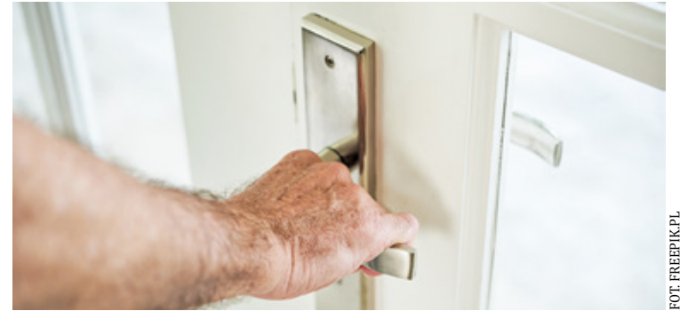
Osób, które odmawiają okazania legitymacji służbowej, kategorycznie nie wolno wpuszczać do swoich domów

pracownicy OPS-u. W poniedziałek późnym popołudniem podejrzany mężczyzna prosił o wpuszczenie do co