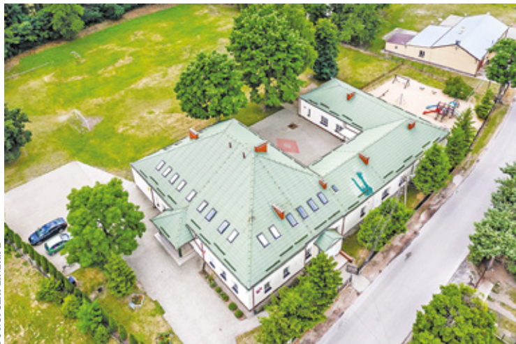
Placówka wreszcie będzie mieć nowoczesną salę gimnastyczną, której nie mogą doczekać się uczniowie szkoły