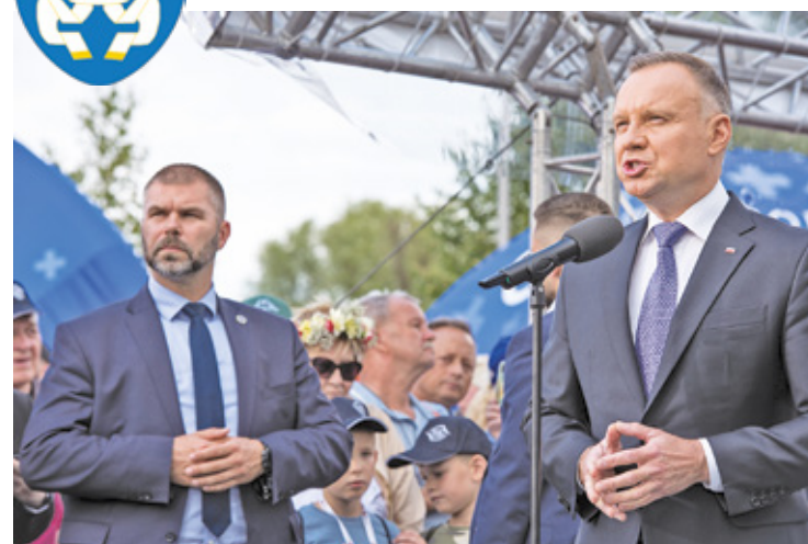
„Największym oparciem dla rozwoju jest rodzina” – mówił Prezydent RP Andrzej Duda.

ul. Juliana Stępkowskiego 17, tel. 22 715 79 00, www.tarczyn.pl