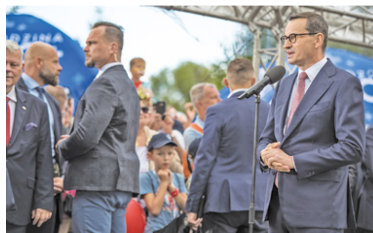
„Sensem naszej polityki jest uśmiech dziecka” – mówił Premier Mateusz Morawiecki.