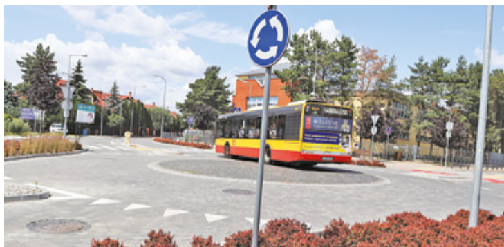
Kierowcy autobusów ścinają rondo, bo pozwalają na to przepisy