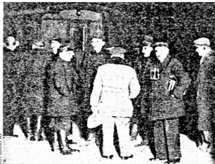
Rozmowy pasażerów z kolejarzami na dworcu w czasie strajku w lutym 1937 r.