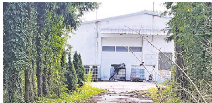
Hala, w której składowane są odpady

– Rozznałem się w kwestii pieniędzy na wywóz tego już w 2020 roku. Przeszedłem całą drogę, pisałem