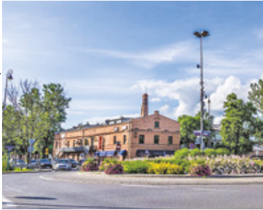
ŹRÓDŁO: UMIG KONSTANCIN-JEZIORNA