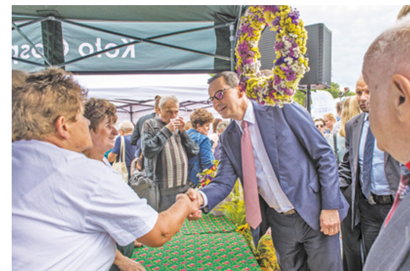
Wspólne rozmowy i pozowanie do zdjęć cieszyły się ogromną popularnością.