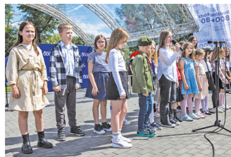
Atrakcją pikniku był występ uczestników zajęć wokalnych GOK w Tarczynie.