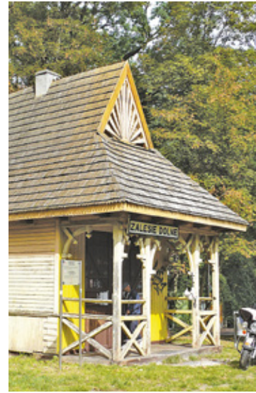
Budynek stacyjki został wzniesiony w latach 30-tych

Autor postu wymienia wiele innych problemów, które należy rozwiązać jak brzydkie okiennice czy kolor, co do którego zdania są podzielone.