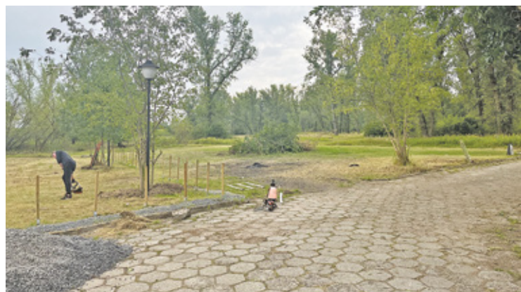
Na razie jednak, zanim to miejsce zacznie błyszczeć i cieszyć mieszkańców Góry Kalwarii przed gospodarzami jeszcze dużo prac porządkowych. Brzanka została przez te kilka lat bardzo zaniedbana