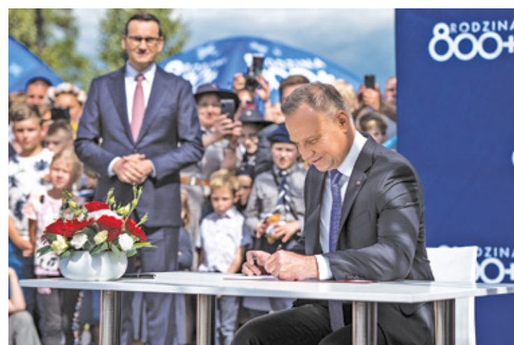
Andrzej Duda podpisuje ustawę z dnia 7 lipca 2023 roku o zmianie ustawy o pomocy państwa w wychowywaniu dzieci.