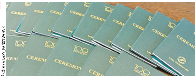
Nad „Ceremoniałem” przez prawie rok pracował zespół, w skład którego wchodziło dwóch dyrektorów regionalnych i dwóch księży

Nowy regulamin mundurów to zbiór zasad, jakimi mają kierować się leśnicy, gdy noszą służbowy mun-