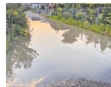
Katuzka na całej szerokości drogi wewnętrznej, na którą splaya woda opadowa z ul. Gogolińskiej