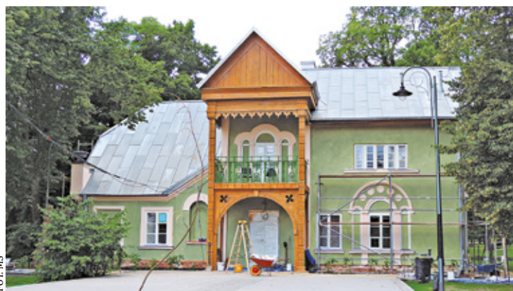
Poniatówka w 2023 r.