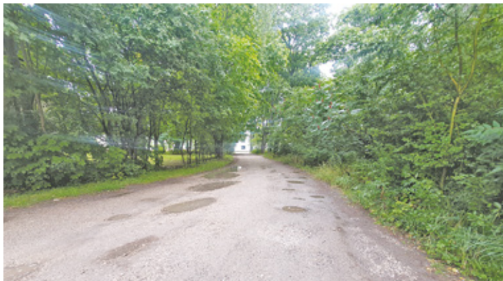
Ulica Kordiana po opadach usłana jest kałużami

Remont ul. Kordiana, który kosztować będzie 1,7 miliona złotych, po-