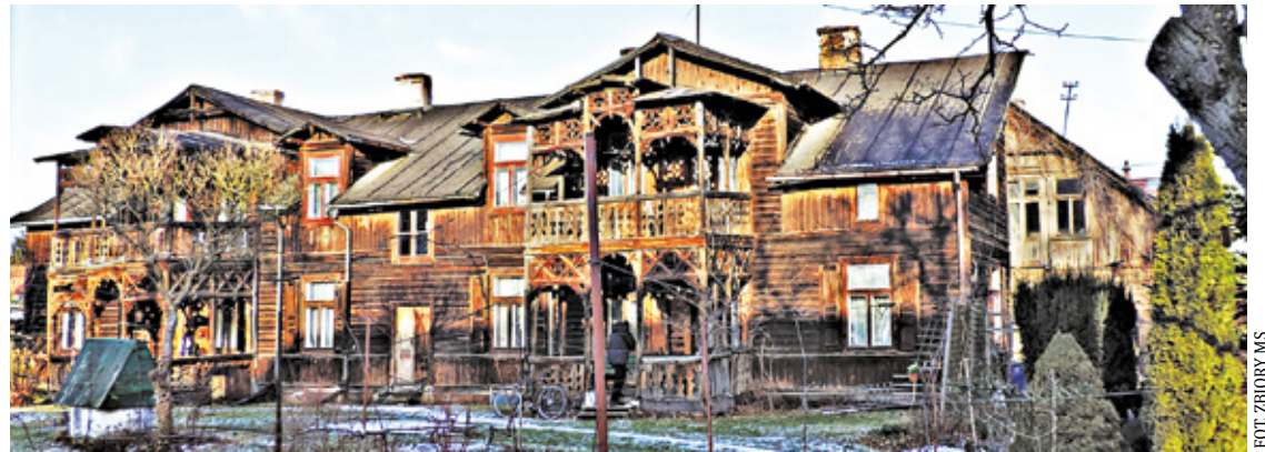
Dom Zarembów przy ul. Świętojańskiej

Te wspólne posiedzenia mieszkańców i napawanie się zapachem kwiatów, działały odświeżająco. Może dlatego tak mało pisano wówczas o depresji. I ta gra światła w południe na przepięknie zdobionych drewnianych werandach. Ponoć oko ludzkie jest spragnione wrażeń świetlnych, jest jedną z koniecznych jego potrzeb i jest radością dla świadomości. Wyobraźmy sobie rodzinny obiad na werandzie. Wilkinowe fotele, okrągły stół i to natężenie światła, inne niż w zamkniętych pomieszczeniach, gra odcieni jest czymś, czego oko ludzkie pożąda, szuka i czym się cieszy. Nie osiągniemy tych doznań