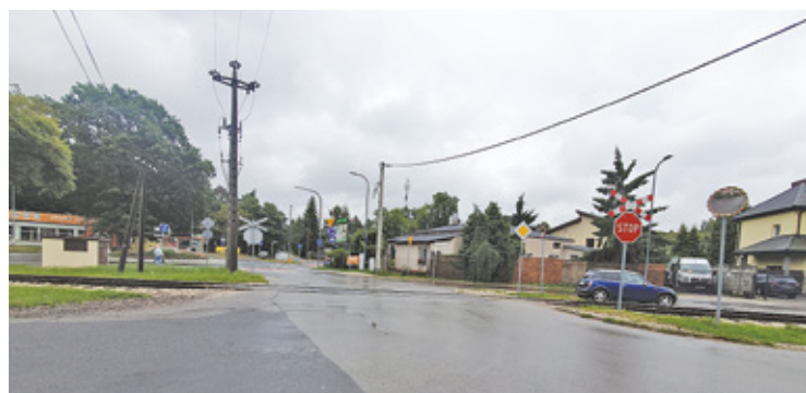
Skrzyżowanie Redutowej, Lipowej i Stołecznej doczeka się przebudowy

W ostatnich dniach piaseczyński magistrat ogłosił przetarg na inną inwestycję w tej części miasta. Chodzi o wykonanie nowego układu komunikacyjnego w rejonie ulic Redutowej, Lipowej, Stołecznej w Piasecznie. Skrzyżowanie z uwagi na jego skomplikowany układ oraz fakt, że przecinają je tory kolejki wąskotorowej, szczególnie w godzinach szczytu sprawia kierowcom wiele problemów. Możliwe, że jeśli postępowanie przetargowe przebiegnie bez komplikacji, nowa wersja krzyżówki będzie gotowa pod koniec tego roku.