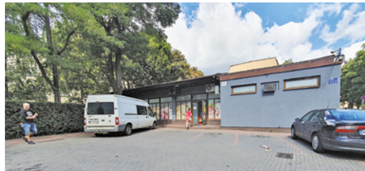
Montaż nowych urządzeń monitorujących ma pomóc w wyeliminowaniu osób, które spożywają alkohol w miejscach publicznych

I tak istniejący system zostanie rozbudowany przy skwerku na ul. Puław-