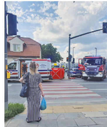
Na miejscu zdarzenia pojawili się strażacy oraz służby medyczne. Niestety mimo podjętej reanimacji mężczyzna zmarł

Do zdarzenia doszło ok. godz. 13. – Mężczyzna kierujący samochodem marki Kia zjechał z drogi i uderzył w zaparkowane volvo, w którym