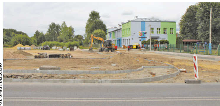
Budowa parkingu ma się zakończyć przed nowym rokiem szkolnym

W końcu jednak życzenie społeczności szkolnej zostanie spełnione, bo trwa remont parkingu. Miasto przebudowuje także skrzyżowanie ulic Szkolnej i Runa Leśnego. Jak informuje urząd miasta, prace budowlane powinny się