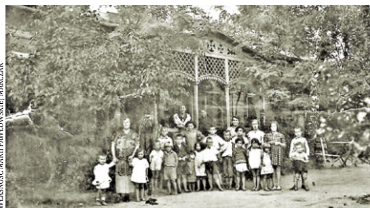
Dom przy ulicy Reytana lata 30. XX w.