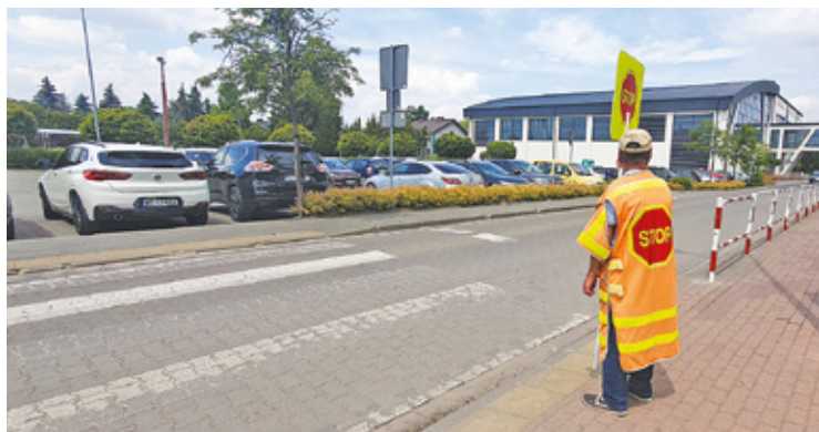
Pan Stopkę przy szkole w Nowej Iwicznej w gminie Lesznowola. Jej władze uważają, że zatrudnienie kontrolerów było trafną decyzją samorządu