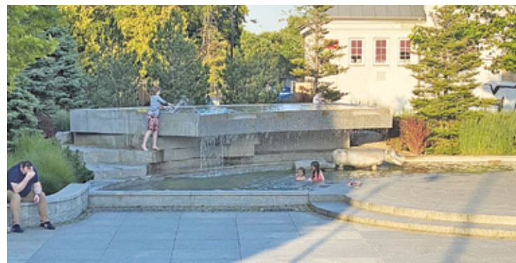
Dzieci nie tylko kąpią się w dolnej partii fontanny na skwerze Kisielela, ale też wchodzi na jej górne partie

Problem w tym, że woda w fontannach działa w obiegu zamkniętym, nie jest filtrowana ani czyszczona. Mogą znajdować się w niej odchody zwierząt, zwłaszcza ptaków i kotów, które często