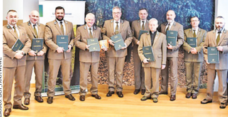
Pracownicy Lasów Państwowych otrzymali nowy regulamin, który może bardzo zmienić ich podejście do zawodu