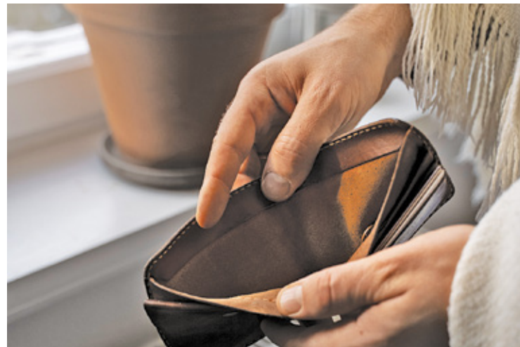
Kobieta oddała fałszywemu adwokatowi wszystkie oszczędności, jakie miała w domu oraz biżuterię

Cała historia rozpoczęła się bardzo charakterystycznie dla tego rodzaju przestępstw. Do pokrzywdzonej, na stacjonarny numer telefonu, zatelefo-