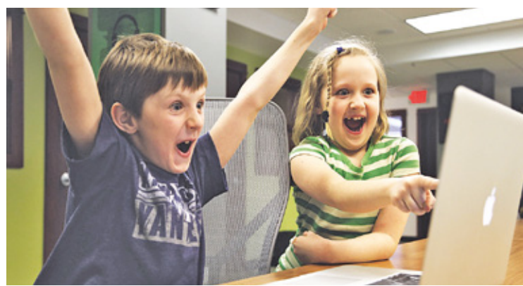
Ważne by zajęcia dodatkowe sprawiły dziecku radość i rozwijały jego predyspozycje