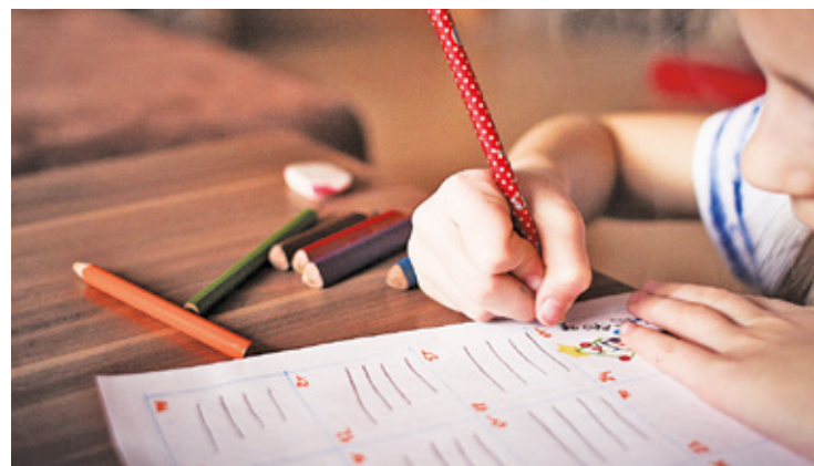
Nieśmiałe dzieci rozwiną swoje zdolności tylko w małej grupie lub kiedy pracują tylko z nauczycielem

Ważne też by dziecko zostało uprzedzone przez rodzica, że na wybrane przez siebie zajęcia będzie chodzić przez cały miesiąc.