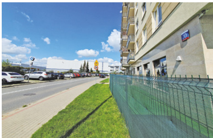
Hałas z hal magazynowych dokucza mieszkańcom bloku przy ul. Jarząbka 20 szczególnie latem

wował, magazyny jednej z firm, zlokalizowane naprzeciwko bloku, hałasują w nocy. – Źródłem hałasu są dmuchawy i wentylacja, która uruchamia się automatycznie, kiedy temperatura przekroczy ok. 7 st. C. Problem występuje pomiędzy kwietniem a październikiem i trwa od lat – mówi mężczyzna. – Apogeeum jest w lipcu i sierpniu, kiedy jest najgłośniejsze – dodaje.