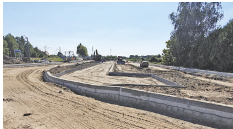
Budowa ul. Sadowej wraz z zatoką i miejscami do parkowania

ulicy Sadowej i ulicy Torowej będzie większa niż na dotychczas dzierżawionym parkingu. W sumie w trakcie