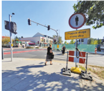
Z powodu remontu tymczasowo zamknięte są dwa przejścia, co utrudnia życie pieszym

Rozpoczęte na wiosnę zazielenianie skweru u zbiegu ul. Jana Pawła II, Puławskiej i Chyliczkowskiej dobiega końca. Jednak mieszkańcy będą jeszcze musieli poczekać na przywrócenie tam ruchu do poprzedniego stanu.