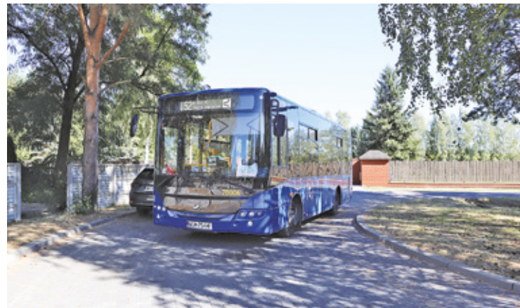
Przewoźnicy mają problem z obsadzeniem kursów i chcą waloryzacji cen za świadczone usługi