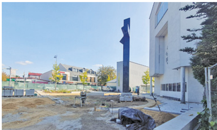
Prace mające na celu m.in. zazielenienie skweru lada chwila się zakończą

ogrodzeniem, konieczne było okresowe, ale całkowite wyłączenie w tym miejscu ruchu pieszych. Usunięto m.in. dwa przejścia dla pieszych przy krzyżu,