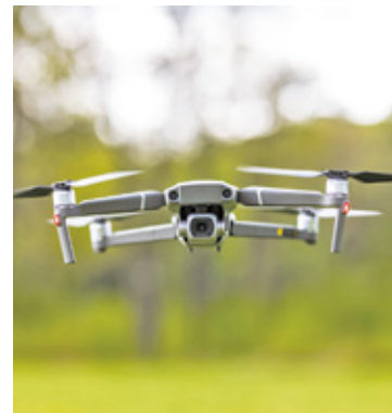
Drony znajdują się w użytku osób prywatnych, ale także różnych służb

Mieszkańcy skarżą się na drony, które zakłócają spokój podczas korzystania z ich posesji. W ostatnich dniach ruch tych statków powietrznych był jeszcze większy, a to za sprawą oblotów na zlecenie Polskiej Agencji Żeglugi Powietrznej.