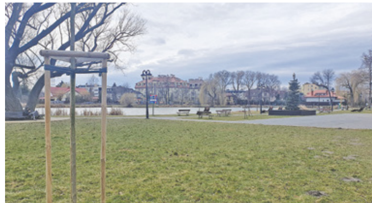
W sąsiedztwie istniejącego terenu ze stawem, alejką spacerową, ławkami i leżakami powstać miałby nowy park

Pod informacją gminy o koncepcji i planowanej realizacji zarożo się od