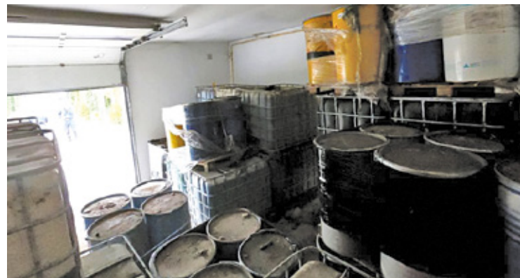
Łącznie potrzeba na wywiezienie niebezpiecznych odpadów z Nowego Prażmowa 21 milionów 640 tysięcy złotych

– Rozmawialiśmy o różnych możliwościach, prosiliśmy o dodatkowe środki. Rozmowa bardzo sympatyczna i rzeczowa, jeśli chodzi o pana prezesa, z dużym nastawieniem na pomoc. Oczywiście są tam przepisy wewnętrzne, więc takiej bezpośredniej obietnicy, że będziemy mogli uzyskać większą kwotę, nie ma. Niemniej jednak rozmawialiśmy także o lepszym rodzaju pożyczki oprócz dotacji. Sprawa nam się wyjaśni co zrobić i będziemy