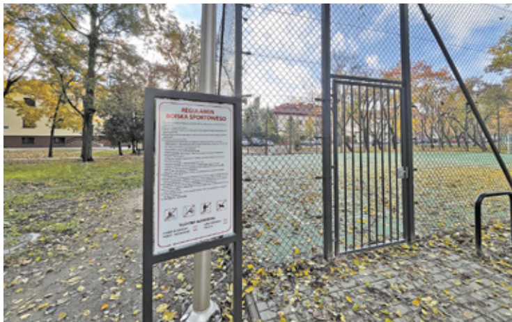
Obiekt jest przeznaczony do gry w koszykówkę oraz piłkę nożną

Boisko wielofunkcyjne na osiedlu Mirków jest już gotowe. Pod koniec października odbył się oficjalny odbiór robót budowlanych. Gmina poinformowała, że niebawem obiekt zostanie oddany do użytku mieszkańcom.