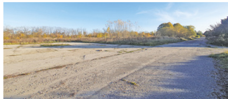
Od półtora roku gmina próbowała sprzedać atrakcyjne działki, zlokalizowane przy ul. Puławskiej