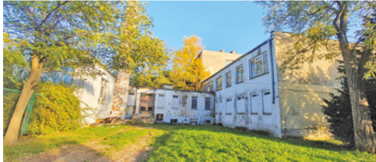
W dawnych zakładach KPGO uprawiano pomidory i kwiaty

Sprzedż działek to dobra informacja dla borykającej się z problemami finansowymi gminy. W październiku ubiegłego roku stan zadłużenia gminy określano na ok. 150 mln złotych, a z uwagi na brak środków wiele ważnych dla mieszkańców inwestycji nie może być realizowanych. Trudna w ostatnich latach sytuacja finansowa miała ulec