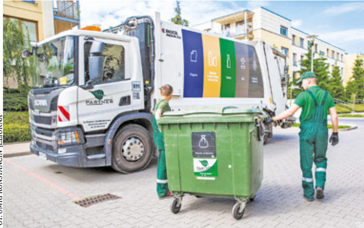
Jak czytamy w komunikacie Urzędu Miasta i Gminy Konstancin-Jeziorna mimo tych wszystkich zmian rachunki nie wzrosną. Od lat obowiązuje ta sama stawka za gospodarowanie odpadami komunalnymi

Przez najbliższe dwa miesiące nadal obowiązują ustalenia z poprzednią firmą Jarper harmonogram odbioru odpadów komunalnych na terenie całej gminy oraz z punktu selektywnej zbiórki odpadów przy ul. Mirkowskiej 43C.