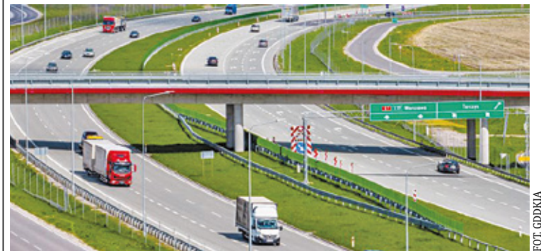
Na nowym odcinku wylotówki z Warszawy w kierunku Krakowa funkcjonują już wszystkie węzły drogowe

Inwestycja drogowa na odcinku Warszawa – Grójec powstała przy wsparciu finansowym Unii Europejskiej, a dokładnie ze środków Funduszu Spójności w ramach Programu Operacyjnego Infrastruktura i Środowisko