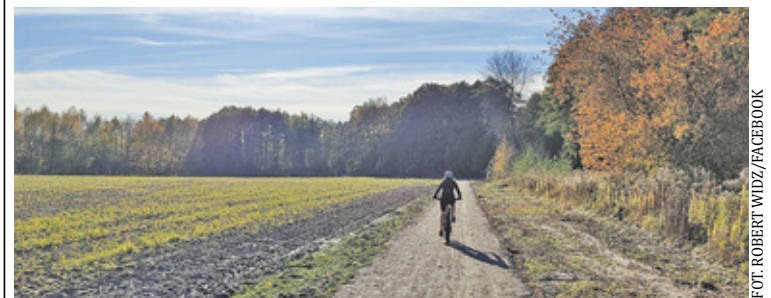
Pierwszy odcinek nowej trasy wiedzie od ul. Traktorzystów w Głoskowie do przejazdu kolejowego na przedłużeniu ulicy Dobrej w Runowie

W trakcie przygotowania jest także ścieżka w Zalesiu Górnym przy ul. Wczasowej dla miłośników bardziej wyczynowych przejazdów rowerowych. – Trasa jest w budowie, a ozna-