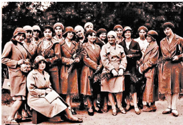
Wycieczka panien z Chyliczek do ogrodu botanicznego około roku 1929