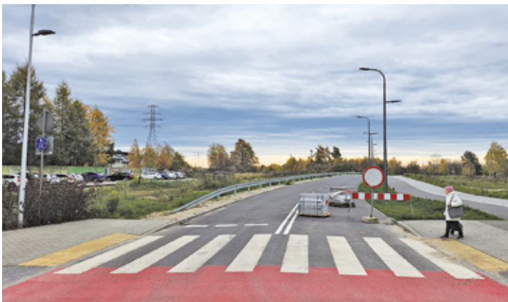
Zupełnie nowa droga zwana Urbanistów Bis wciąż czeka na otwarcie, choć zdarzają się kierowcy, którzy już z niej korzystają

Mieszkańcy z niecierpliwością czekają na otwarcie ulicy Urbanistów Bis. Nowa droga jest praktycznie gotowa, ale wciąż niedostępna dla kierowców z uwagi na prowadzone jeszcze prace budowlane w ramach całej inwestycji.