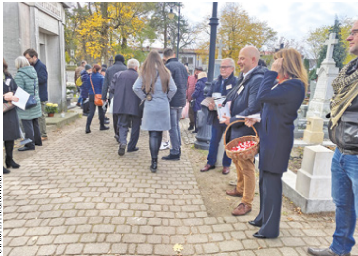
Wśród kwestujących znaleźli się wólarze miasta, ale także ludzie kultury, harcerze, przedstawiciele lokalnych mediów