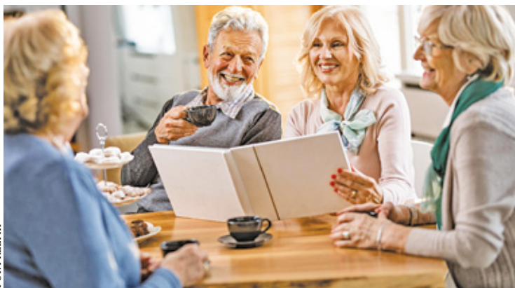
Zgłoszenia kandydatów do rady przyjmowane były do 2 listopada

Praca w radzie będzie miała charakter społeczny. Rada ma być apartyjna, a jej członkowie nie będą angażować się w kampanie i działalność partii politycznych. Jednym z celów statutowych rady jest aktywne wsparcie