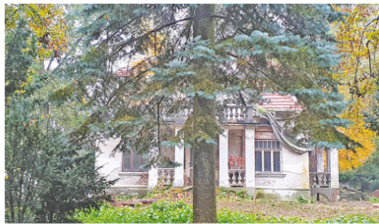
Willa Jast wymaga generalnego remontu, najpierw konieczne jest zabezpieczenie dachu