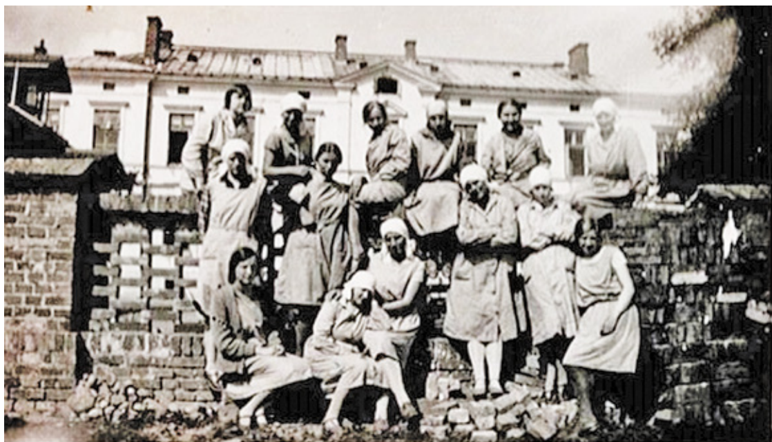
Uczennice przed szkołą w Chyliczkach