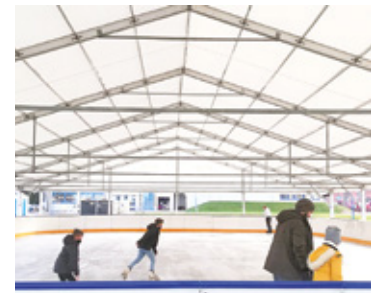
Ośrodek Sportu i Rekreacji planuje uruchomić lodowisko 6 grudnia

– Lodowisko będzie z namiotem zamykanym, czynne przez dwa miesiące. Od poniedziałku do piątku będzie