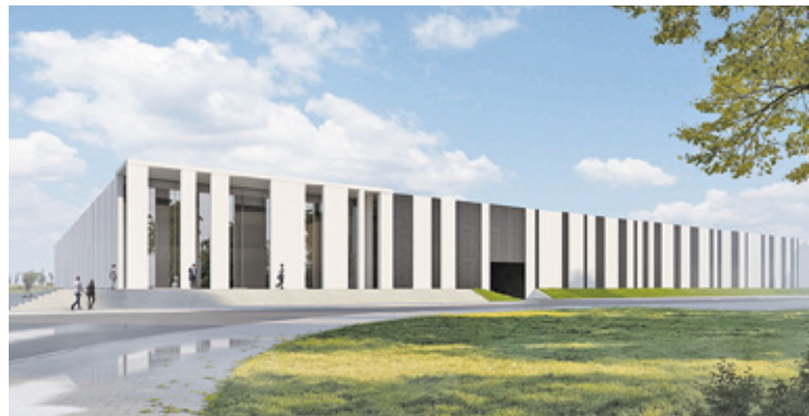
Obiekt ma być przyjazny środowisku i ma mieć maksymalnie obniżoną energochłonność

Prace budowlane już trwają, a otwarcie Panoptikum planowane jest w drugiej połowie 2025 roku. Szacuje się, że inwestycja pochłonie ok. 200 mln zł.