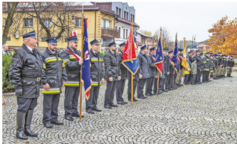
Poczty sztandarowe uświetniły uroczystość swoją obecnością