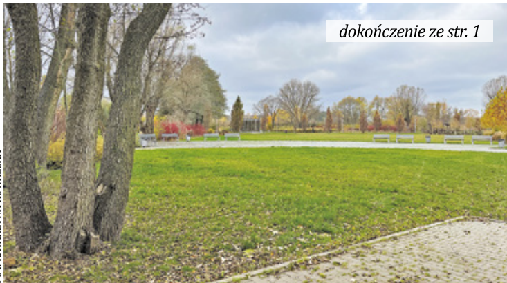
dokończenie ze str. 1

To prawda, że jednym z atutów gminy jest jej położenie. Tarczyn jest usytuowany przy głównych trasach komunikacyjnych blisko Warszawy i lotniska Chopina Okęcie. Dlatego zagospodarowanie terenu w Drozdach jest realizowane z takim rozmachem. Trzeba przyznać, że przestrzeń rekreacyjno-sportowa robi wrażenie. Docel-