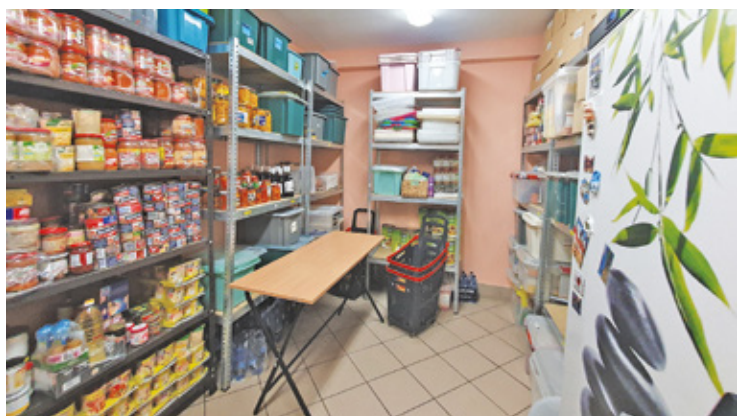
Magazyn z żywnością wypełnia się dzięki darowiznom od osób prywatnych oraz lokalnych marketów, jak również dzięki środkom z gminy Piaseczno