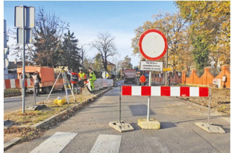
W związku z przebudową ulicy Gerbera droga wojewódzka nr 722 jest zamknięta na odcinku od skrzyżowania z ulicami Sienkiewicza i Wojska Polskiego

W kolejnej fazie powstać mają rondo: na skrzyżowaniu Sienkiewicza z Dworcową oraz drugie – u zbiegu tej drogi z ul. Wojska Polskiego. Starostwo planuje, że te prace również przypadną na wiosnę przyszłego roku. Oprócz skrzyżowań, w zupełnie nowej odsło-