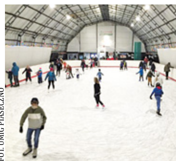
Przy lodowisku działa wypożyczalnia sprzętu - łyżew, kasków, ochraniaczy, jak również chodzików do nauki jazdy

Lodowisko rozpoczęło sezon w sobotę 4 listopada i można z niego korzystać indywidualnie, ale też w ramach zajęć z łyżwiarstwa figurowego na łyżwach dla różnych grup wiekowych. Zajęcia te przeznaczone są zarówno dla dzieci i młodzieży, jak i dorosłych, a