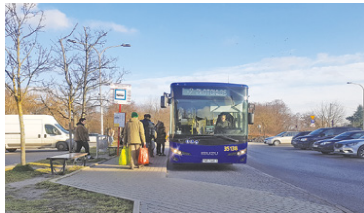
Zwiększenia liczby kursów m.in. linii L chcą mieszkańcy innych miejscowości