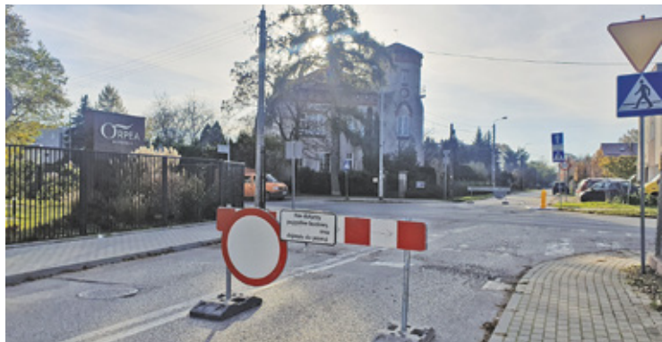
W ul. Gerbera nie można także wjechać z ulic podrzędnych