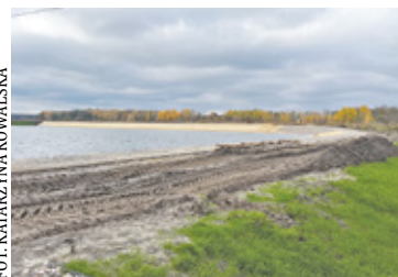
Tarczyn na tę inwestycję pozyskał prawie 7 mln zł z Rządowego Funduszu Polski Ład