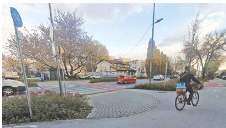
Zdarzenie zakwalifikowano jako kolizję

rany mandatem karnym w wysokości 2500 złotych, a na jego konto funkcjonariusze dopisali punkty karne.