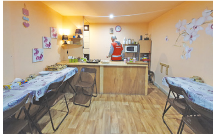
Kawiarenka działająca pomiędzy domem parafialnym a kościołem św. Anny (na tyłach starej plebanii), liczy ok. 10 miejsc siedzących