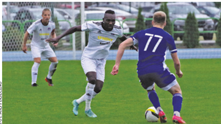
Przed Piasecznem ciężka rywalizacja z Wisłą Płock

Piłkarze IV-ligowego MKS Piaseczno w 16 meczach zdobyli 22 punkty. W najbliższą sobotę zespół rozegra ostatnie w tym roku ligowe spotkanie. Jego przeciwnikiem będą rezerwy Wisły Płock, które nie straciły punktów od września, notując serię imponujących wręcz zwycięstw.