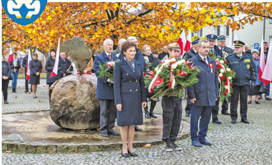
Delegacje złożyły wieńce pod pomnikiem Bohaterów Ziemi Tarczyńskiej

ul. Juliana Stępkowskiego 17, tel. 22 715 79 00, www.tarczyn.pl