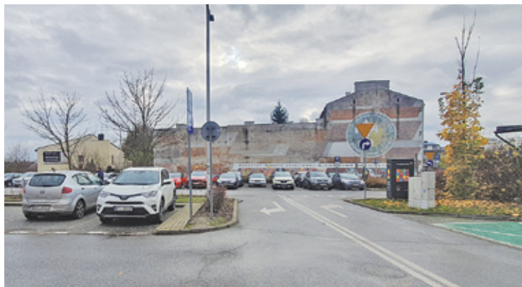
Sala widowiskowa powstanie ma w miejscu, w którym obecnie działa największy w mieście parking

Sala widowiskowa powstanie ma w miejscu, w którym obecnie działa największy w mieście parking – pomiędzy ul. Sierakowskiego a parkiem miejskim, czyli ul. Zgoda. Jak już wcześniej infor-