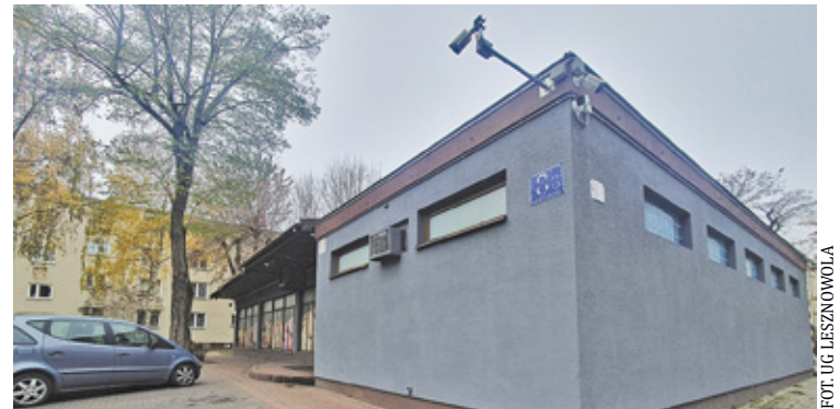
Miejsc, w których uciążliwości dla otoczenia stwarzają osoby raczące się trunkami „pod chmurką”, jest więcej. Imprezowiczów nie odstrasza nawet monitoring miejski