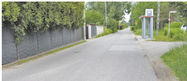
Po modernizacji ulica Ptaków Leśnych zyska m.in. szerszą drogę, chodnik i skrzyżowania w nowej wersji, m.in. wyniesione

Po modernizacji ulica Ptaków Leśnych zyska m.in. szerszą drogę, chodnik i skrzyżowania w nowej wersji, m.in. wyniesione. Pojawiają się także elementy uspokojenia ruchu, kanał technologiczny, kanalizacja deszczowa, prze-