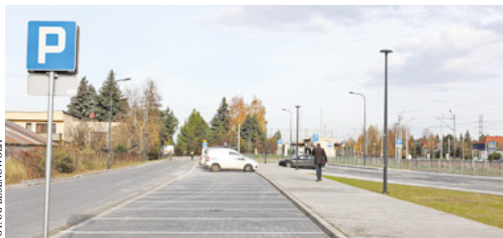
W ramach inwestycji wybudowano jezdnię, dojazdy do działek, chodniki, wiaty na rowery i parking

N a oddanie do użytku ul. Sadowej wraz z infrastrukturą mieszkańcy czekali z niecierpliwością z uwagi na fakt, że od lata mieli problem z zostawianiem aut w rejonie stacji kolejowej. Stało się tak, gdyż gmina zdecydowała się nie przedłużać umowy na dzier-