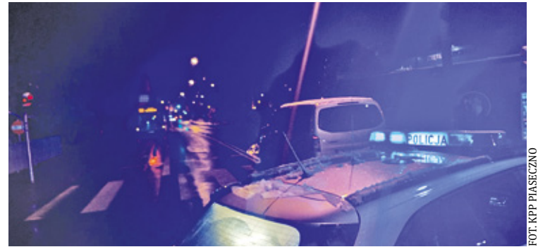
Na ul. Wojska Polskiego w Piasecznie samochód potrącił kobietę, która przechodziła przez przejście dla pieszych na zielonym świetle

Kilka dni wcześniej do groźnego wypadku doszło w Łazach. Na opublikowanym przedwczoraj nagraniu z policyjnego wideorejestratora widać, że przed przejściem dla pieszych, na prawym pasie zatrzymuje się nieoznakowany radiowóz. Młody mężczyzna