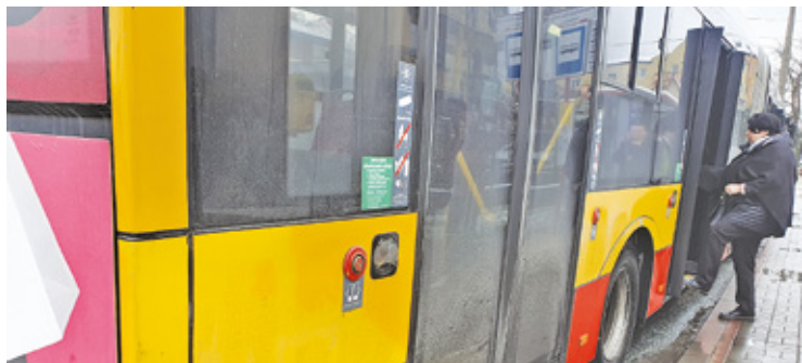
W godzinach porannego szczytu linia 739 kursuje nawet co kilka minut

O wyjaśnienia w tej sprawie poprosiliśmy urząd miasta, który wprawdzie nie odpowiada za rozkład jazdy, bo tym zajmuje się Zarząd Transportu Miejskiego, ale proponowane rozkłady zawsze są z nim konsultowane. – Z analizy przeprowadzonej przez ZTM wynika, że na tym pierwszym odcinku (od cmentarza przy ul. Julianowskiej do Urbanistów – przyp. red.) liczba pasa-