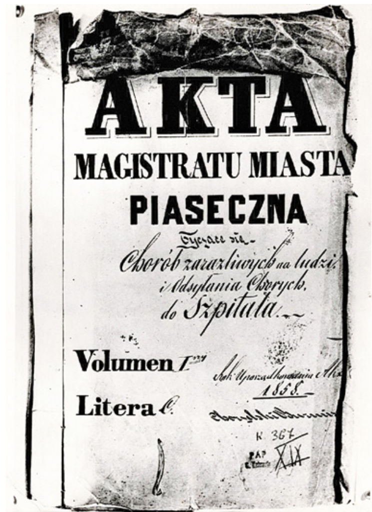
Fotokopia dokumentu Magistratu Miasta Piaseczna dotycząca odsyłania chorych na cholere do szpitala

O przebiegu epidemii w kraju podawała prasa warszawska następujące szczegóły, tu fragment raportu z dwóch dni września: „W guberni kaliskiej w mieście Kole w dniu 22 września zachorowały na cholere 2 osoby, w powiecie łomżyńskim zmarło 5 osób, w powiecie makowskim zachorowało 9 osób, zmarło 7. W powiecie warszawskim w ciągu 2 dni września 1893 r. zachorowały 23 osoby i zmarło 5 osób”. Niestety informacja o badaniach Kocha rozchodziła się powoli i zanim przedsięwzięto skuteczne metody ochrony nastąpiła fala epidemii, czyli ta z roku 1892 pochłonęła bardzo dużo istnień ludzkich. Choć historycy twierdzą, że tym razem jednak na polskich ziemiach nie pociągnęła za sobą licznych ofiar. Co innego w Rosji, gdzie zmarło około ćwierć miliona ludzi. Starano się robić ograniczenia sanitarne. I tak np. do Góry Kalwarii na żydowskie święta miały ściągnąć rzesze Izraelitów do miejscowego rabina. Stwierdzono, że taki tłummy zjazd wobec zdarzających się w kraju przypadków cholery jest niebezpieczny i może spowodować roznoszenie się choroby. Tym bardziej że nie było łatwo zabezpieczyć pielgrzymów w dostatecznie bezpieczny nocleg, a w nim trudno było o wodę i pożywienie odpowiednio zabezpieczone, a co ważne też zdezynfekowanie i utrzymywanie w czystości kloak. Warszawski gubernator zlecił władzom powiatowym zobowiązać rabina, aby nie przyjmował Żydów spoza miasta. Poza tym zalecono sprawdzanie toż-