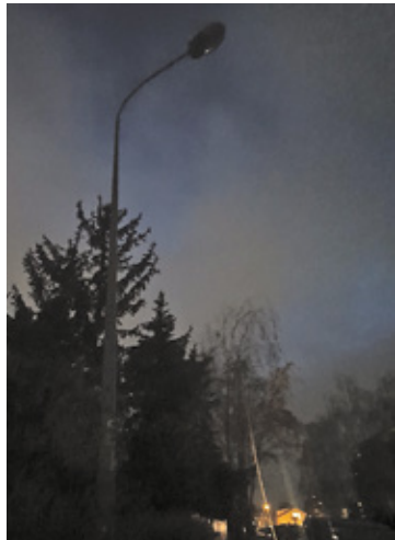
Mieszkańcy narzekali na ciemności i większą aktywność złodziei

Jak poinformował Urząd Gminy Lesznów, sytuacja powinna wrócić niebawem do normy. – W związku z informacją dotyczącą cen energii elektrycznej dla Gminy Lesznów, które w roku 2024 nie będą odbiegały od do-