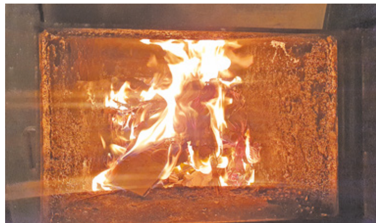
Sadza z nieczyszczonych przewodów kominowych może się zapalić, wydzielając smog, ale też śmiertelnie groźny czad