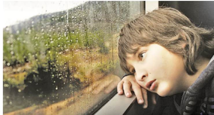
Z roku na rok coraz więcej dzieci szuka pomocy psychologicznej