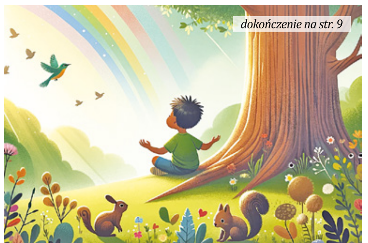
dokończenie na str. 9