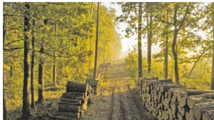
Chojnowski Park Krajobrazowy stworzono w 1993 roku, aby chronić kompleks Lasów Chojnowskich oraz doliny rzek

W Polsce obecnie istnieje 120 parków krajobrazowych. Ich łączna powierzchnia to 2,5 mln ha. Chojnowski