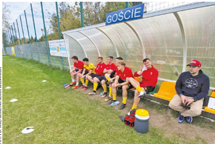
Korona Góra Kalwaria pewnie zmierza po awans

W listopadzie dobiegła końca runda jesienna piłkarskiej A-klasy. Sezon od początku zapowiadał się niezwykle ciekawie – powiat piaseczyński reprezentuje w lidze aż 9 drużyn na 14. Pora podsumować wydarzenia, które działy się na tym szczeblu rozgrywkowym w ostatnich miesiącach.