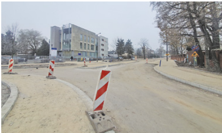
Utrzymujące się niskie temperatury, nie pozwalają na skończenie modernizacji w tej części miasta

Przebudowę ul. Sienkiewicza na odcinku od ul. Wojska Polskiego do ul.