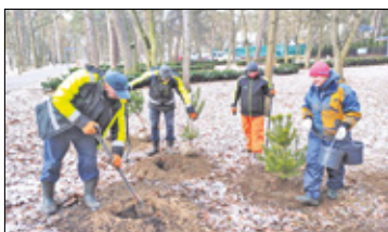
||| Konstancin-Jeziorna - Jeszcze więcej drzew s. 5