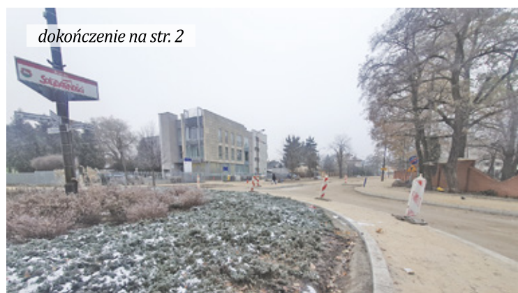
Niestety prognozy pogody na najbliższe dni nie wyglądają zbyt optymistycznie