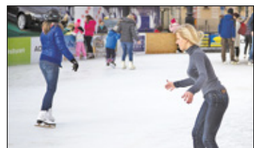
||| Lesznowola - Lodowisko jeszcze przed świętami s. 4