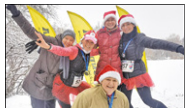
||| Sport - 10. Cross Mikołajkowy s. 10