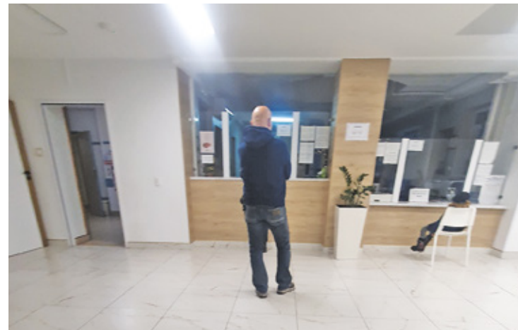
Pacjenci WOZ w Głoskowie mogą korzystać z innych placówek SZPZLO