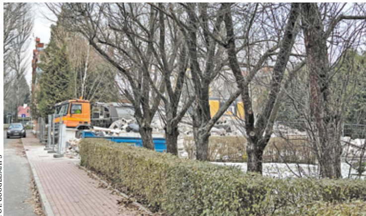
Sklep „Hania” został zburzony. W tym miejscu powstanie apartamentowiec

Zburzyli stare i w tym miejscu zbudują nowe. To tak w skrócie można nazwać ostatnie wydarzenia na osiedlu Mirków. Słynny warzywniak „Hania” i obok stojący pawilon handlowy niedawno zostały zrównane z ziemią. Wyburzenie budynków wywołało zaciętą dyskusję wśród okolicznych mieszkańców.