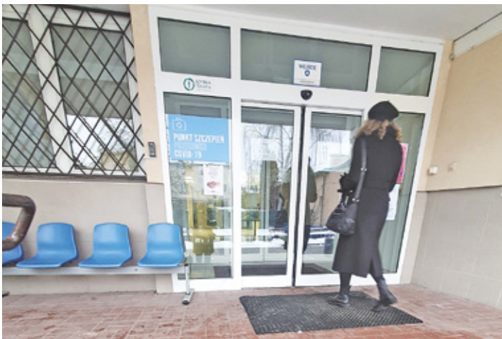
Pacjenci zainteresowani szczepieniem odchodzą z przychodni z kwitkiem

Gdzie są szczepionki Nuvaxovid na krakena – dopytują mieszkańcy. Jak informują, szczepionek, wolnych terminów na szczepienia próżno szukać w miejscowych ośrodkach zdrowia. Przykładowo piaseczyński SZPZLO otrzymał 700 dawek, ale podawanie wakuiny spowalniają nowe wytyczne Ministerstwa Zdrowia.