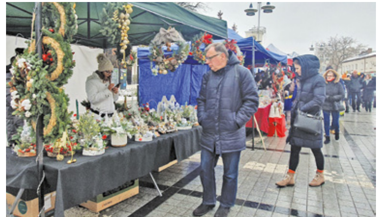
Mieszkańcy tłumnie odwiedzili kiermasz bożonarodzeniowy

Kiermaszowi świątecznemu, jak co roku, towarzyszyły także punkty gastronomiczne. Można było zjeść coś na miejscu, jak też zakupić w ramach upominku różnego rodzaju przysmaki, np. pochodzące z Podlasia mrowiska, czy też miody, domowej roboty soki,