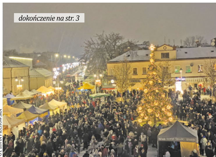
Zwieńczeniem wydarzenia było włączenie lampek na choince