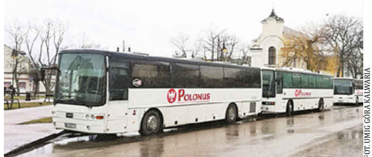
Przewoźnik zapewnia, że w ostatnich latach dokładał wszelkich starań, aby móc obsługiwać jak największą liczbę pasażerów. Jak podkreśla, rentowność linii w okresie ostatnich dwóch lat znacząco spadła

W ubiegły poniedziałek mieszkańcy, korzystający z autobusów PKS Polonus, zaalarmowali naszą redakcję o problemach z zakupem biletów miesięcznych. W kasie biletowej w Górze Kalwarii mieli usłyszeć, że nie wiadomo, czy w 2024 roku autobusy PKS Polonus w ogóle będą jeździły do stolicy. – To by była tragedia. Zostałyby nam „Warka” oraz „elki”, które robią