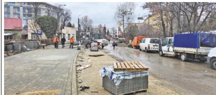
Ukończenie remontu znów może pokrzyżować pogoda

W kolejce dróg w mieście, przeznaczonych do remontu w tym roku, czekała jeszcze ulica Żeromskiego. – Prace