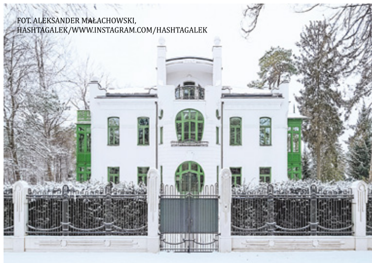
W 2012 roku willa „Anna” została zakupiona przez osobę prywatną, która 3 lata później rozpoczęła remont budynku. Od dwóch lat możemy podziwiać jego efekty

wym, znajduje się wiele wyjątkowych zabytków. Wśród nich jest aż 100 przedwojennych willi. Większość znajduje się w prywatnych rękach. W ciągu ostatnich lat można zauważyć, iż