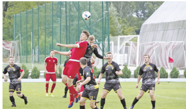
Byli piłkarze Piaseczna są blisko zaplecza Ekstraklasy