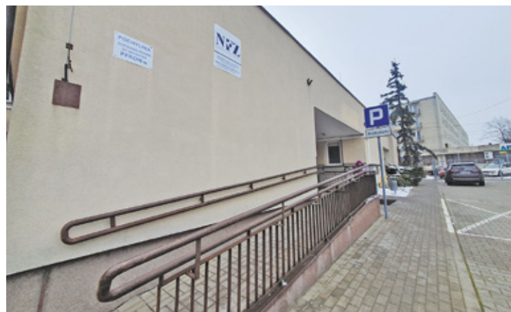
Piaseczyński SZPZLO otrzymał 700 dawek szczepionki Nuvaxovid, ale ich podawanie spowolnił nowy system szczepień

mutacja ta może być groźna, szczególnie dla osób z obniżoną odpornością, w tym osób starszych. – Chciałam zaszczepić się przeciwko najnowszej wersji koronawirusa, ale okazuje się, że to niemożliwe – poinformowała naszą redakcję jedna z mieszkank Piasecz-