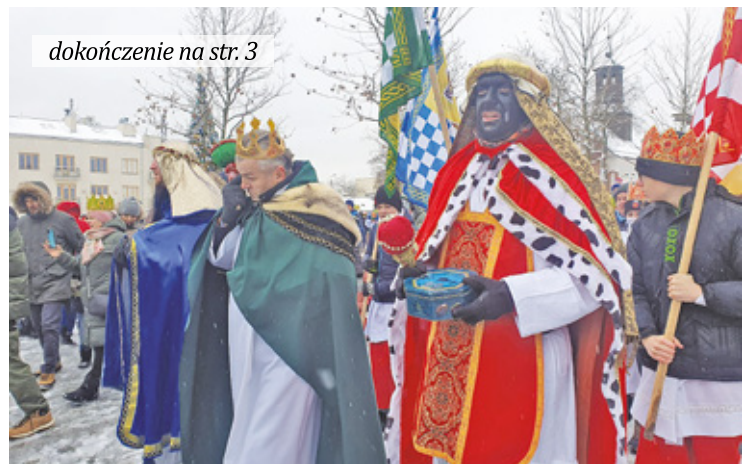
dokończenie na str. 3

||| Zalesie Górne - Single tracki w Zalesiu s. 7