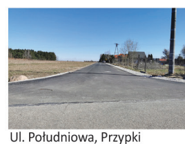
Ul. Południowa, Przypki

Zakończyły się remonty ul. Leśnej w Pracach Dużych (na odcinku 270 m) oraz ul. Południowej w Przypkach (na odcinku 170 m). Łączny koszt remontów wyniósł 394 454, 37 zł i był sfinansowany z budżetu Gminy Tarczyn.