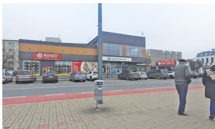
Mieszkańcy mają nadzieję, że po zamknięciu klubu Blu w centrum miasta w końcu będzie spokojniej