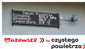
Mazowsze czystego powietrza

Aparatury pomiarowe oraz czujniki zamontowano na budynkach szkół m. in. w Szkole Podstawowej im. Wojciecha Górskiego w Pamiętce, Szkole Podstawowej im. J. Stępkowskiego w Suchostrudzie, Szkole Podstawowej im. Józefa Chelmońskiego w Suchostrudzie, Szkole Podstawowej im. Mieczysława Kaczyńskiego.