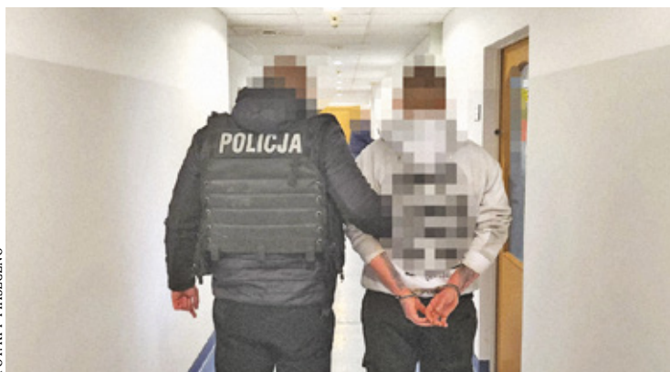
22-latek i 24-latek zostali tymczasowo aresztowani na trzy miesiące

Działania zmierzające do ustalenia sprawców natychmiast podjęli funkcjonariusze wydziału kryminalnego Ko-