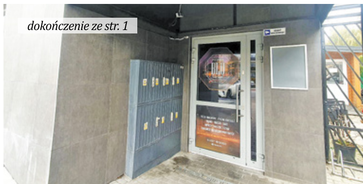
dokończenie ze str. 1

Jak się dowiedzieliśmy, przygotowanie opinii potrwać może od kilku tygodni do kilku miesięcy.