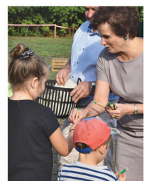
Wojewódzki Fundusz Ochrony Środowiska i Gospodarki Wodnej w Warszawie

2 września odbył się piknik, który wprowadził wszystkich uczestników w świat przyrody i ekologii. Dofinansowany przez Wojewódzki Fundusz Ochrony Środowiska i Gospodarki Wodnej w Warszawie piknik „Ekofestiwal – Odkryj Piękno Przyrody” odbył się na terenie malowniczej zieleni, przyciągając tłumy zarówno młodych jak i starszych miłośników natury.