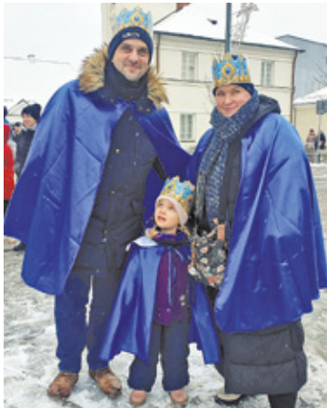
W wydarzeniu wzięło udział kilkaset mieszkańców

Zanim przez miasto przeszedł barwny korowód, w kościele św. Anny w Piasecznie odbyła się msza święta. Następnie pastuszkowie, aniołki i oczywiście trzej królowie: Kacper, Melchior i Baltazar wyruszyli do szopki betlejemskiej. Po uroczystym przemarszu uczestników orszaku częstowano cie-