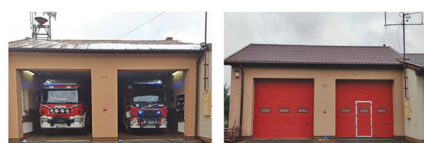
Mazowsze straży pożarnej

strażnicy wykonano w ramach zadania „Mazowieckie Strażnice OSP – 2023”.