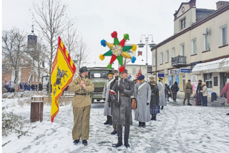
Orszak przeszedł trasą inną niż w ubiegłym roku

plym posiłkiem. Następnie w auli niebieskiej domu parafialnego odbyło się wspólne koledowanie.