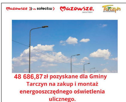
48 686,87 zł pozyskane dla Gminy Tarczyn na zakup i montaż energooszczędnych oświetlenia ulicznego.

W pięciu sołectwach gminy zostały przeprowadzone zostały prace remontowe – wymiana 53 lamp oświetleniowych oraz zakup i montaż tablicy informacyjnej. Wkład własny gminy wyniósł 58 372,33 zł. Całość inwestycji to koszt 107 059,20 zł.