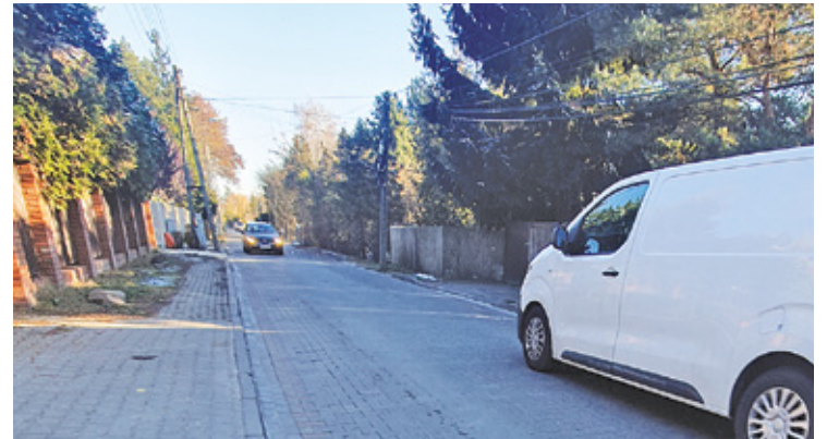
Na ul. Kuropatwy panuje duży ruch aut, ale nie ma infrastruktury dla pieszych i rowerzystów

W realizację zadania zaangażowane są aż trzy samorządy z uwagi na położenie ulicy Kuropatwy na skraju gminy Lesznowola, Piaseczno oraz warszawskiej dzielnicy Ursynów. – Ulice na styku gmin są najtrudniejsze do realizacji. W tym przypadku 3 gminy: Lesznowola, Piaseczno i Warszawa musiały dojść do porozumienia – i to