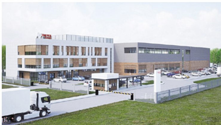
Spółka poszukuje specjalistów w dziedzinie inżynierii elektrycznej, energoelektroniki, mechatroniki oraz elektromontażu

obejmował nie tylko część produkcyjną, ale również magazyn oraz nowoczesne pomieszczenia biurowe. Przy ul. Adamowicza produkowane, montowane i magazynowane będą urządzenia elektroenergetyczne.