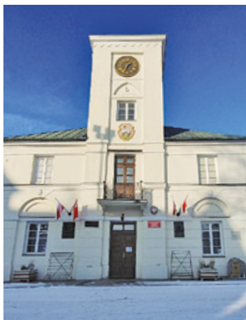
W 2023 roku na terenie Piaseczna zawarto 184 małżeństwa