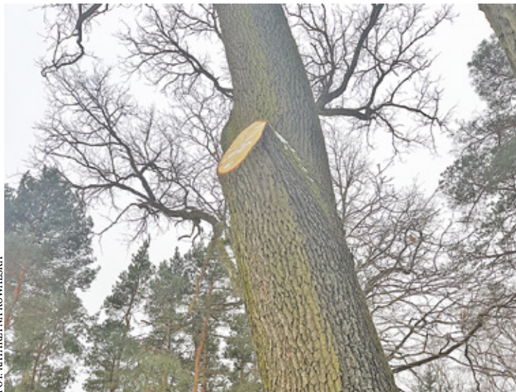
Trzy lata temu właściciel działki, który czuje odpowiedzialność związaną z posiadaniem na swojej posesji pomnika przyrody, poprosił o przeprowadzenie prac konserwatorskich i zabiegów pielęgnacyjnych

Redakcja Przeglądu Piaseczyńskiego skierowała zapytanie do burmistrza Góry Kalwarii, jak było możliwe wycięcie konarów dębu, który rośnie na prywatnej posesji, nie posiadając pozwolenia na wejście od właściciela?