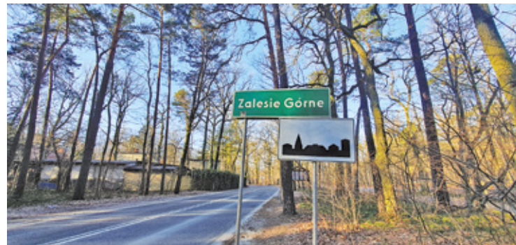
Zalesie Górne zachwyca przyrodą i atmosferą, ale też zaspokaja potrzeby mieszkańców coraz bogatszą infrastrukturą