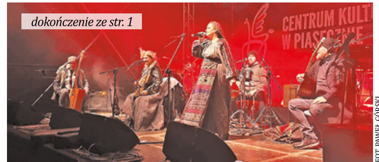
Finałowi WOŚP towarzyszyły liczne koncerty, warsztaty i pokazy. Na zdjęciu zespół Łysa Góra, który wystąpił w Piasecznie

Środki z tegorocznej zbiórki przeznaczone zostaną na zakup sprzętu do diagnozowania, monitorowania i rehabilitacji chorób płuc pacjentów na oddziałach pulmonologicznych. Chodzi o urządzenia zarówno dla małych pacjentów, jak i osób dorosłych, bo w trakcie pandemii koronawirusa ucierpiały nie tylko osoby starsze, ale także ludzie młodzi i dzieci. Po COVID-19 wciąż wiele osób cierpi na uporczywy kaszel, duszności, brak możliwości wzięcia pełnego oddechu, co znacząco