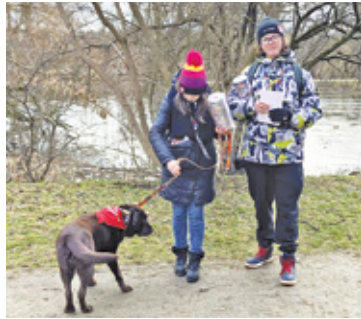
Na ulicach i w parkach kwestowały setki wolontariuszy

Liczne koncerty, licytacje, turniej siatkówki, a na koniec pokaz laserów – to niektóre z licznych wydarzeń, jakie na 32. finał Wielkiej Orkiestry Świątecznej Pomocy przygotował piaseczyński sztab. Wiele działań się także w Górze Kalwarii i Konstancinie-Jeziornie.