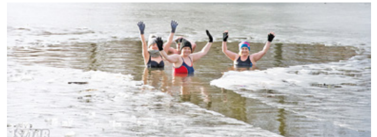
Morsy z Piaseczussets

pogarsza komfort życia. Zmagają się z nimi nawet osoby, które przechodziły koronawirusa nawet bezobjawowo.