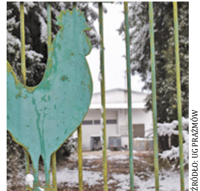
Teraz pozostaje tylko ogłosić przetarg na utylizację niebezpiecznych odpadów z Nowego Prażmowa

Przypomnijmy nielegalne składowisko w Nowym Prażmowie, zostało zlokalizowane w maju 2020 roku. Funkcjonariusze z wydziału do walki z przestępczością gospodarczą i korupcją weszli wtedy do hal magazynowych przy ulicy Akacjowej. Zgodnie z