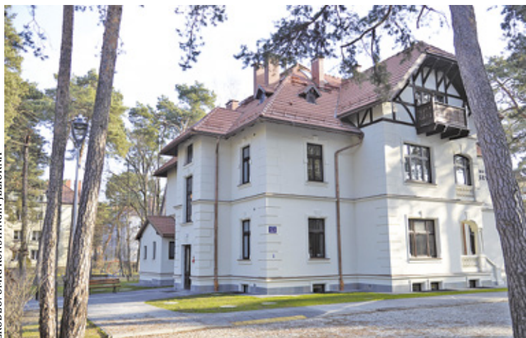
Liczący prawie 120 lat budynek stał się cztery lata temu miejscem wielopokoleniowej integracji ludzi zamieszkujących gminę

Odnowiona willa Gryf w Konstancinie przy ulicy Sobieskiego została udostępniona mieszkańcom 3 lutego 2020 r. Liczący prawie 120 lat budynek