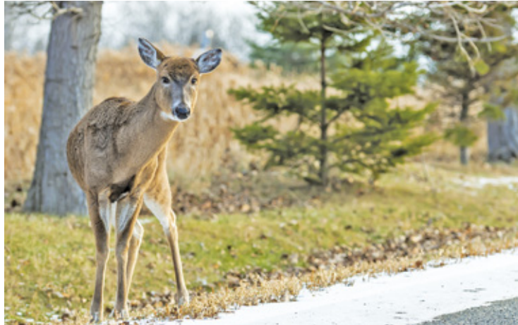
Zdaniem włodarzy miasta w kwestii pomocy dzikim zwierzętom panuje chaos kompetencyjny

W ubiegłym tygodniu rada miejska poparła projekt uchwały w sprawie wniesienia skargi do Wojewódzkiego Sądu Administracyjnego na uchwałę RIO. Jednak w związku z decyzją warszawskiej izby, miasto zmuszone było rozwiązać umowę z fundacją Animal Rescue Poland. To ona realizowała w gminie Piaseczno zadania w tym zakresie. – Umowa obowiązywać miała do końca lutego 2024 r. Na pomoc dzikim zwierzę-