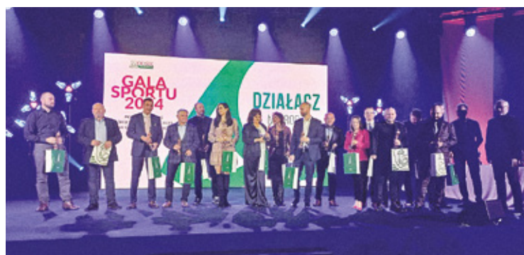
Nagrody dla działaczy