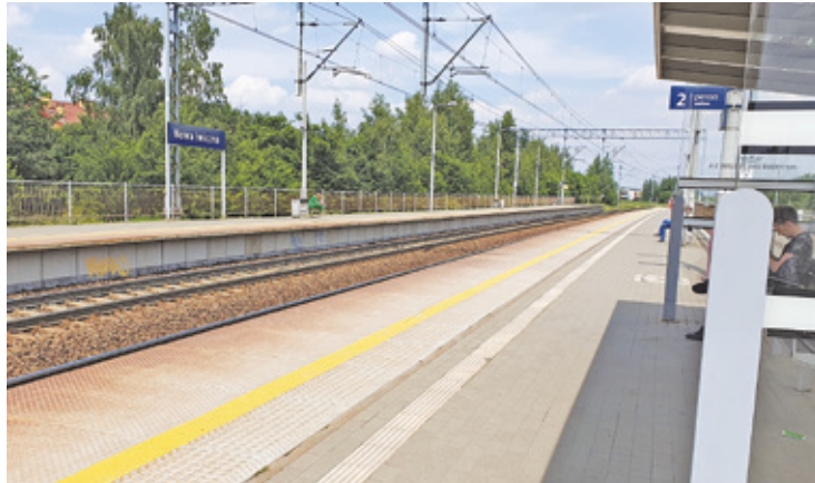
Na podniesieniu dopłat do biletu metropolitalnego zaoszczędziliby mieszkańcy, korzystający z publicznego transportu zbiorowego

korzystają z takich samych zniżek, jak mieszkańcy stolicy. Traci za to na tym budżet podwarszawskiego samorządu.