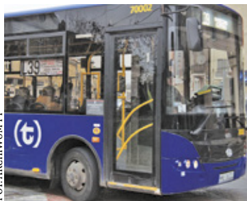
Zmiany ułatwią życie pasażerom korzystającym na co dzień z transportu miejskiego

D zięki zmianom w kursowaniu linii autobusowych L33 i L39 pasażerowie będą mieli ułatwiony dojazd do Warszawy zarówno autobusem do stacji metra Wilanowska, jak i pociągiem ze stacji PKP Jeziorki.