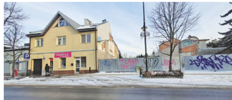
Inwestor planuje 100 mieszkań i garaże podziemne, ale póki co nie ma pozwolenia na budowę