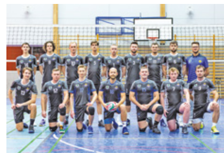
FB: SPS KONSTANCIN-JEZIORNA SENIORSZY

Choć w II Lidze Mazowieckiej siatkówki odbędą się jeszcze 3 spotkania, kwestia tego, kto na koniec uplasuje się na pierwszym miejscu w stawce, została już rozstrzygnięta. Ani GKS Jaguar Wolanów, ani GLKS Nadarzyn nie są w stanie zepchnąć z fotelu lidera siatkarzy drużyny SPS Konstancin-Jeziorna.