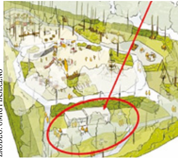
Obiekt u zbiegu ulic Cyraneczki i Ogrodowej ma być wybudowany i rozpocząć działalność jeszcze w tym roku

Pod koniec 2023 r. gmina Piaseczno złożyła wniosek do Urzędu Marszałkowskiego Województwa Mazowieckiego o dofinansowanie miejsca aktywności lokalnej w Józefosławiu. – Bardzo się cieszę, że został on pozytywnie rozpatrzony i takie dofinansowa-