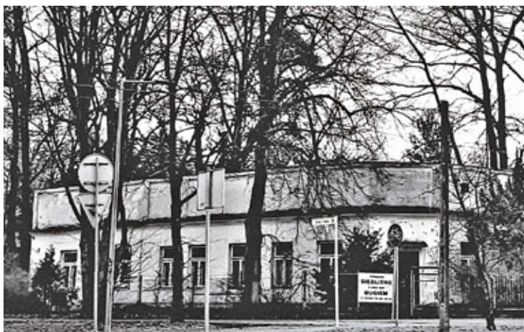
Dom Orłowskich 2023 r. – pl. Wolności, ulica 3 Maja

Dom Orłowskich został podzielony tak, że stał się niewygodny dla wszystkich lokatorów, ale nikt nie narzekał, bo czas był tak ciężki, że mało ludzi mieszkało wygodnie. Tu przykład: Orłowscy, aby skorzystać z łazienki, musieli wyjść na zewnątrz budynku i przejść przez podwórko. W czasie zimy kąpiel w wannie była dość ryzykowna.