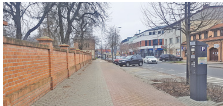
Osoby skazane sprzątają, odśnieżają czy montują uchwyty i flagi na lampach ulicznych z okazji świąt państwowych

muje Joanna Ferlian-Tchórzewska, rzeczniczka piaseczyńskiego ratusza. – Prace realizowane są również przez placówki wskazane przez Burmistrza Miasta i Gminy Piaseczno do wykonywania pracy społecznie użytecznej: Szpital św. Anny w Piasecznie EMC Sp. z o.o. i Caritas przy parafii św. Anny w Piasecznie, a także Wydział Utrzymania Terenów Publicznych naszego urzędu.