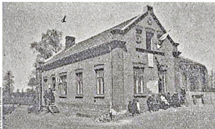
Budynek gminy w Jazgarzewie

obszar w dużej części dziś należy do powiatu piaseczyńskiego. Bo trzeba pamiętać, że ówczesny powiat grójecki sięgał aż do piaseczyńskiego „Wiaduktu”. Dwa zdarzenia, które opisywała prasa, miały miejsce w Jazgarzewie i Tarczynie.