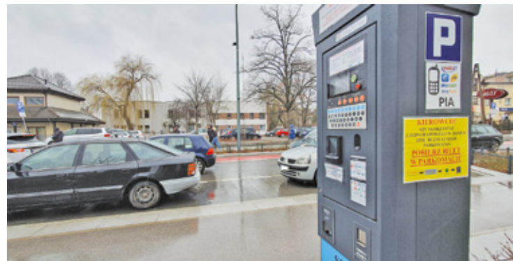
Możliwe, że jeszcze w tym roku zwiększy się liczba płatnych miejsc wzdłuż ulic