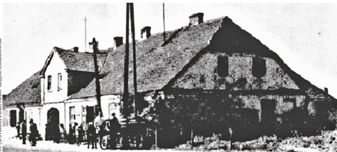
Zajazd poczty konnej w Tarczynie stan z 1958 r.