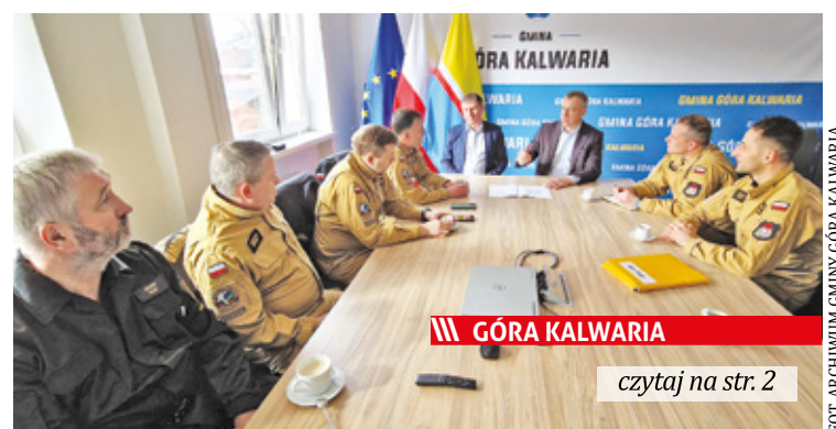
Spotkanie w urzędzie w sprawie budowy Państwowej Straży Pożarnej