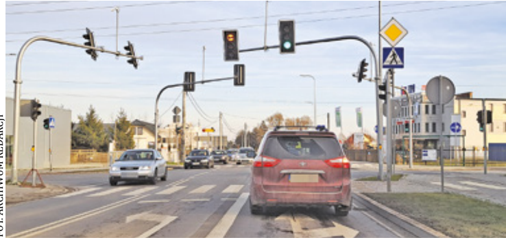
Deklaracje w sprawie wniosku o pozwolenie na realizację obwodnicy Lesznowoli składano wielokrotnie, ale dokument wciąż nie trafił do wojewody

Mieszkańcy gminy narzekają na to, że tkwią w korkach na dojazdach do dróg ekspresowych i wręcz duszą się od ruchu tranzytowego. Od lat z niecierpliwością czekają na wybudowa-