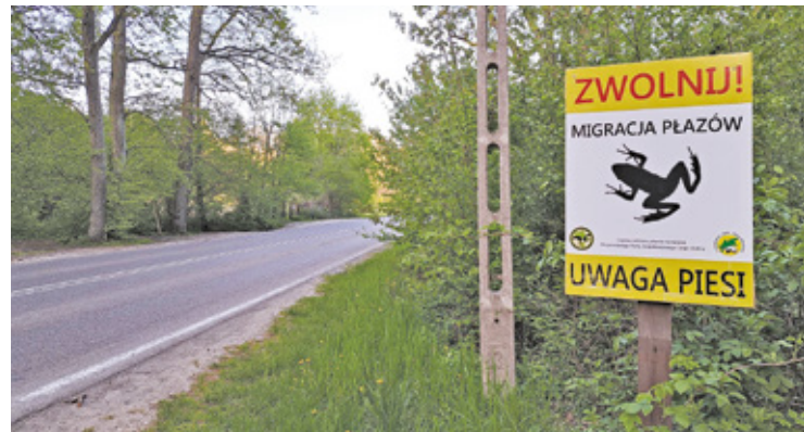
Znaki ustawione na terenie Chojnowskiego Parku Krajobrazowego