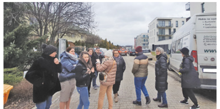
Mieszkańcy liczą na maksymalizację miejsc parkingowych

||| PIASECZNO Mieszkańcy z ul. Kwitnącej Gruszy niemal każdego ranka pędzą do swoich samochodów, aby zdążyć odjechać przed kontrolą straży miejskiej. Na wielu miejscach, z których dotąd korzystali, pojawiły się bowiem zakazy parkowania, ale z braku alternatywy zostawiają tam swoje auta.