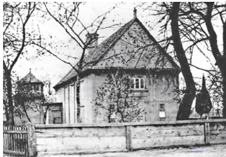
Kościół w Jazgarzewie widok sprzed 1914 r.

Historia z roku 1902, jaka wydarzyła się w Jazgarzewie, niewielkiej wówczas wsi pod Piasecznem, nieco wyjaśnia opieszałość w pogoni za bandytami z Tarczyna. Chodzi tu o odwagę, jaką prezentowali strażnicy. Jazgarzew był wówczas gminą w powiecie grójeckim i przypominę, że Piaseczno było pozbawione praw miejskich po powstaniu styczniowym. W Jazgarzewie znalazła sobie kwaterę banda rzezimieszków. Gazeta Polska tak opisuje sytuację we wsi Jazgarzew: „Była to zorganizowana banda złodziejska,