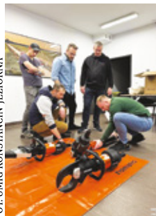
FOT. UMIG KONSTANCIN-JEZIORNA

W najbliższym czasie do jednostki trafić mają: motopompa szlamowa, wentylator oddymiający, dwie motopompy pływające oraz latarka kątowna z akcesoriami. Sprzęty te kosztować będą około 37 tys. zł. Znajdą się one na wyposażeniu nowego ciężkiego samochodu bojowego scania, który po zakończeniu wszelkich formalności zostanie przekazany druhom. Jego wartość to 1 374 894 zł, z czego 599 894 zł stanowił wkład konstancińskiego samorządu.