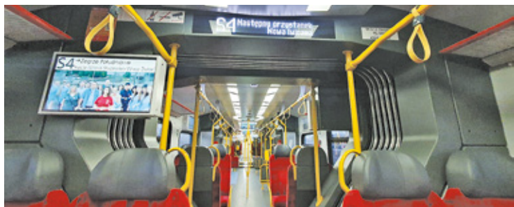
SKM-ka to nowoczesne, ciche i czyste pociągi