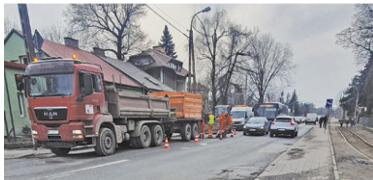
Starostwo powiatowe tłumaczy, że czeka z remontem na bardziej stabilną pogodę

Według ubiegłorocznych zapowiedzi przebudowa ul. Sienkiewicza, na odcinku od ul. Wojska Polskiego do ul. Dworcowej (bez skrzyżowań) ma rozpocząć się wiosną tego roku, podobnie jak fragment tej drogi od skrzyżowania z ul. Pomorską do ul. Dworcowej. – Wprawdzie do astronomicznej wiosny jeszcze kilka dni, ale przy takiej pogodzie można by prowadzić remont.