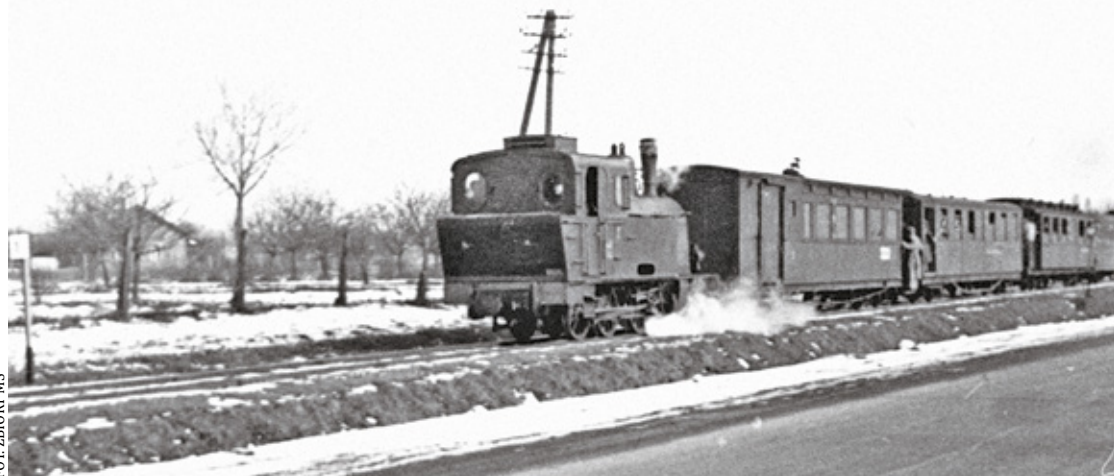
Kolejka grójecka na ul. Puławskiej

No i jak zawsze skorzystali z tego cwani ludzie, którzy posiadali konie i furmanki. Dziennikarz pisze, że: „Rozgrywały się dantejskie wprost sceny. Oczywiście przodowały w tym kobiety, które podniosły lament, mając w perspektywie pieszą wędrowkę do stolicy. Korzystali z tej okazji okoliczni kmiotkowie i żydzi, którzy na przykład za przejazd z Kątów do Piaseczna żądali po 5 zł od osoby”. No tak, znamię czasu, czyli krytyka kobiet i żydów, bo wszyscy mężczyźni na pewno rażno ruszyli pieszo w drogę, a większość wozaków za darmo woziła pasażerów.