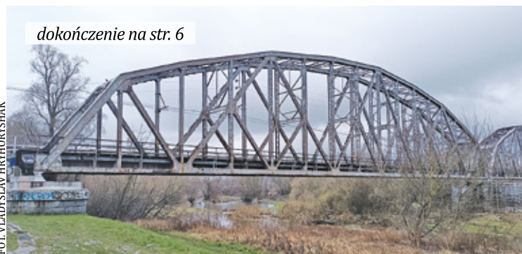
Ścieżka łącząca dwa brzegi Wisły mogłaby stać się atrakcją turystyczną