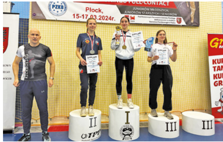
Medalistki z powiatu piaseczyńskiego

W weekend 15-17 marca w Płocku trwały Mistrzostwa Polski Full Contact Juniorów i Seniorów. W turnieju odbywającym się pod patronatem Polskiego Związku Kickboxingu wzięło udział łącznie 319 przedstawicieli kickboxingu z 69 klubów. Reprezentanci Piasecz-