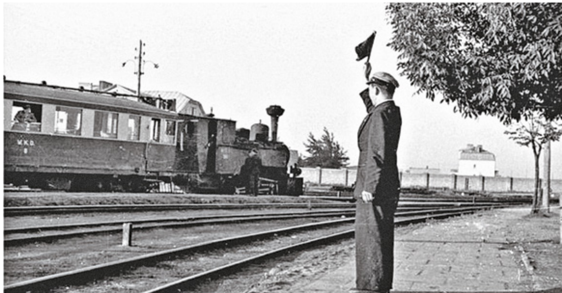
Pociąg kolejki grójeckiej na trasie Warszawa – Piaseczno przy Dworcu Południowym

Ta informacja pochodzi z lipca 1933 roku i dotyczy katastrofy, w której zginęła jedna osoba i kilka osób było rannych (w sumie 22). Katastrofa wydarzyła się między Wierzbem a Służewcem w Szopach, czyli później w okolicach dworca południowego, dziś Wilanowska. Policja, która prowadziła śledztwo w sprawie katastrofy, wydała decyzję, aby zatrzymać ruch pociągów na trasie Warszawa – Piaseczno do czasu oceny przez specjalnie powołaną komisję powodów katastrofy. W skład komisji weszli przedstawiciele ministerstwa komunikacji i władz sądowno-śledczych. Nawiasem mówiąc, dla mnie to jest spora ciekawostka z historii kolejki dojazdowej, że w ogóle ktoś zadecydował o zatrzymaniu ruchu pociągów, gdyż jak sądzię, musiało to