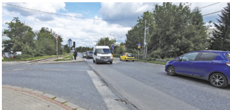
Roboty rozpoczną się jeszcze w pierwszej połowie tego miesiąca

Starostwo przypomina także o innych prowadzonych remontach i możliwych uciążliwościach. Od 21 marca na około 4 miesiące całkowicie zamknięta jest ulica Raszyńska w Zgorzale, Zamieniu i Podolszynie. W Żabieńcu kontynuowane są prace przy budowie ścieżki