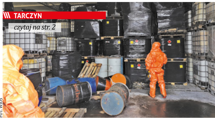
Kontrola WIOŚ, urzędników miejskich i prokuratorów w 2021 roku

PIASECZNO || GÓRA KALWARIA || KONSTANCIN-JEZIORNA || LESZNOWOLA || PRAŻMÓW || TARCZYN || URSYNÓW