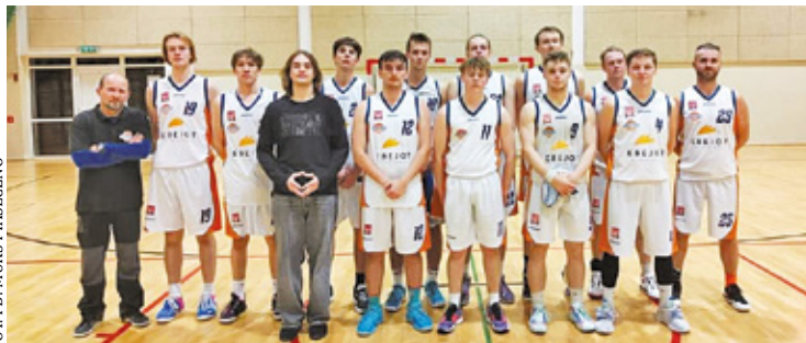
Piaseczyńscy koszykarze mają szansę, aby awansować do wyższej klasy rozgrywkowej

W 2. etapie rozgrywek MUKS przegrał 42:58 z Legionem Legionowo, pokonał 99:83 KS Mexum Grójec i w kolejnym starciu 87:61 Legionowo. W lutym w rewanżu lepsi okazali się gracze z Grójca, którzy wygrali 97:91. Finalnie Piaseczno uplasowało się na pozycji wicelidera tabeli i zagrało o miejsca 1-4, gdzie udało mu się triumfować jedynie w wyjazdowej rywalizacji z klubem Grupa Strategia Gim92 Warszawa (82:58), któremu wcześniej uległo we