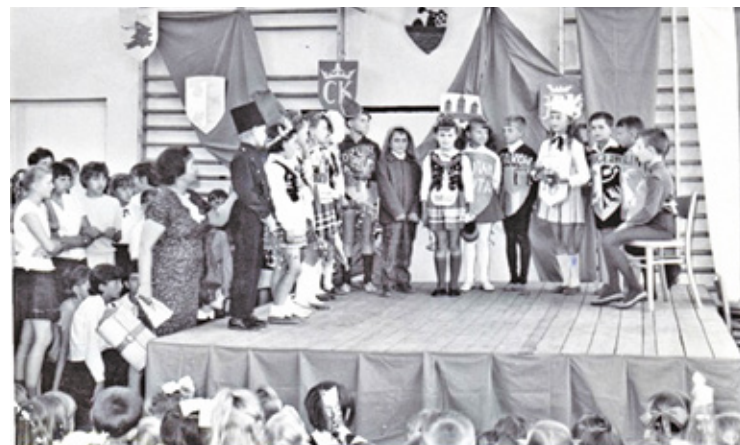
Przedstawienie w szkole nr 5. Stoję tu pierwsza od lewej, prowadzę konferansjerkę