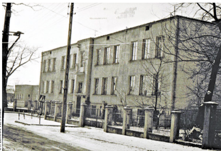
Budynek szkoły nr 1. przy ul. Świętojańskiej w roku 1988