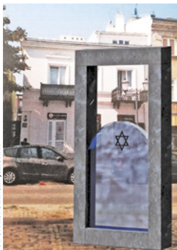
Wizualizacja Macewy Pamięci

Na macewie zostanie umieszczony w języku polskim napis o treści: Dla upamiętnienia społeczności żydowskiej, żyjącej na terenie obecnej gminy Konstancin-Jeziorna, eksterminowanej przez Niemców w czasie II wojny światowej, oraz tych Polaków, którzy nieśli jej pomoc. Społeczność Gminy Konstancin-Jeziorna. Konstancin-Jeziorna, 2024 r. Na obiekcie znajdzie się także tłumaczenie treści napisu w językach angielskim i hebrajskim.