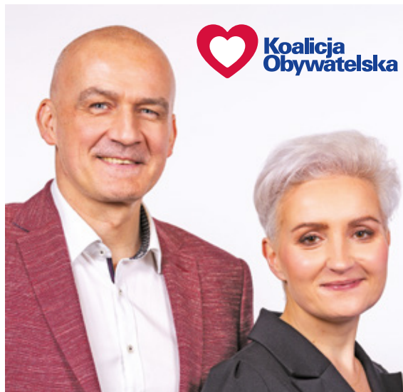
Materiał KW Koalicja Obywatelska