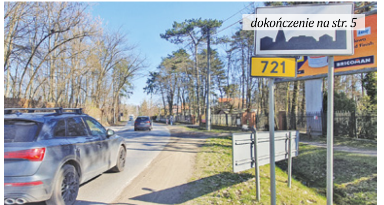
Droga wojewódzka, łącząca Piaseczno z Konstancinem-Jeziorną, zostanie przebudowana na prawie pięciokilometrowym odcinku

Jak poinformował wykonawca przebudowy, firma SKANSKA, nowa organizacja ruchu, wdrażana na czas robót budowlanych, zacznie obowiązywać 9 kwietnia od godz. 9.