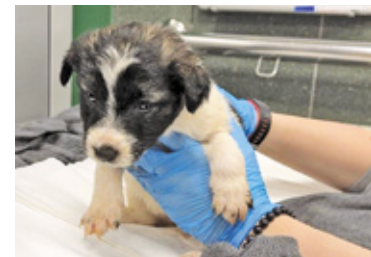
Czworonogi trafiły do schroniska

Służby poszukują osoby, która podrzuciła w kartonie pod jedną z posesji przy ulicy Rejtana gromadę piesków. Osoby posiadające istotne informacje w tej sprawie powinny zgłaszać się je straży miejskiej.