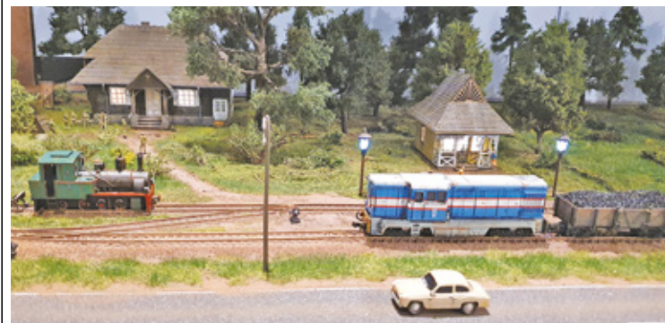
Muzeum Piaseczna to liczne eksponaty i zdjęcia, także w postaci grafik ściennych. W placówce wciąż trwa montaż ekspozycji

Nie lada gratką dla zwiedzających będzie zapewne znajdująca się na piętrze obiektu makieta prezentująca fragment trasy kolejki wąskotorowej, na