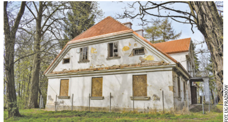
Po remoncie dwór pełni będzie funkcje kulturalno-edukacyjne i służyć ma integracji społecznej

Jak czytamy na stronie gminy, majątek Prażmów w nadaniu królewskim otrzymał kamerdyner i przyjaciel kró-