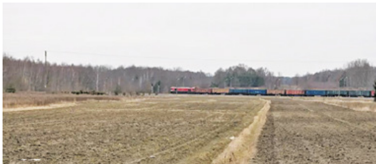
Decyzje w sprawie przyszłości tych terenów będzie musiała zatem podjąć nowa rada

Choć procedura planistyczna trwa od kilku lat, miejscowe plany zagospodarowania przestrzennego samorządu nie zostaną już przyjęte w kończącej się