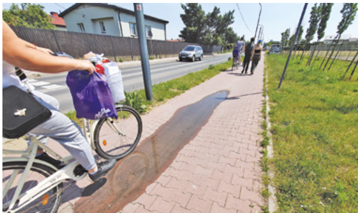
Na ścieżkach, które obecnie wyłożone są kostką brukową, pojawi się asfalt

Wymiana nawierzchni obejmie fragment ścieżki, biegnącej wzdłuż ulicy Młynarskiej od ul. Okulickiego do ronda im. Ryszarda Szurkowskiego, i dalej na odcinku od tego