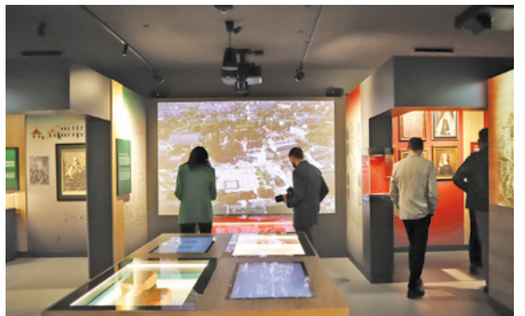
Mieszkańcy będą mogli zwiedzić Muzeum Piaseczna w Noc Muzeów