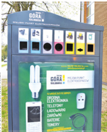
Na facebookowym profilu gminy informacja o pojemnikach zebrała pozytywne komentarze

Miejski Punkt Elektroodpadów zbudowany jest w taki sposób, aby wrzucane odpady nie zagrażały środowisku: ich konstrukcja zapobiega przedostawaniu się wody do wnętrza, a otwory wrzutowe są specjalnie przystosowane do umieszczania w nich odpowiednich rodzajów odpadów - kształt otworu zapobiega wrzuceniu do tuby odpadów innych niż te, na które została ona przeznaczona. Tuba przeznaczona do wrzucania zużytych żarówek wypełniona jest specjalnym