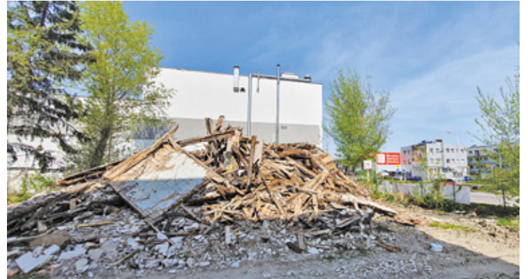
Z uwagi na nierozstrzygnięte wciąż kwestie własnościowe gmina nie może uprzątnąć nieruchomości

Gmina, która od kilkadziesiąt lat była posiadaczem samoistnym (czyli użytkownikiem) nieruchomości, podjęła się interwencji i poniosła koszty,