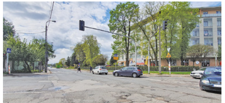
Od jutra wyłączony z ruchu będzie odcinek ul. Sienkiewicza od skrzyżowania z ulicami Wojska Polskiego i Gerbera do ul. Dworcowej - z zachowaniem przejazdu przez te skrzyżowania

Remont ulic w ramach przebudowy ulicy Sienkiewicza rozpoczął się pod koniec ubiegłego roku od modernizacji ul. Gerbera i ronda Solidarności. Teraz na mieszkańców i kierowców czekają kolejne poważne utrudnienia.