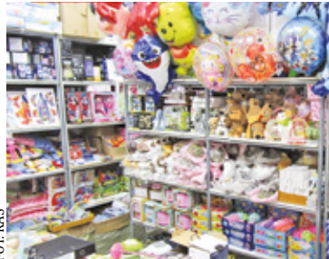
W produkowanych bez kontroli i nadzoru zabawkach wielokrotnie znajdowano szkodliwe ftalany

Przedstawiciele kancelarii prawnej, reprezentującej firmę będące