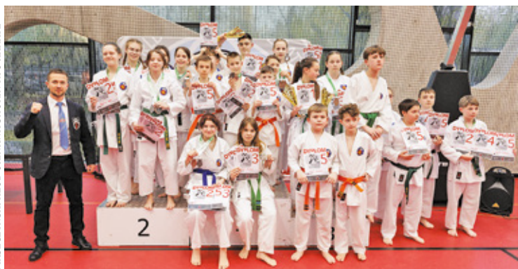
PIASECZYŃSKI KLUB OKINAWA SHORIN RYU KARATE