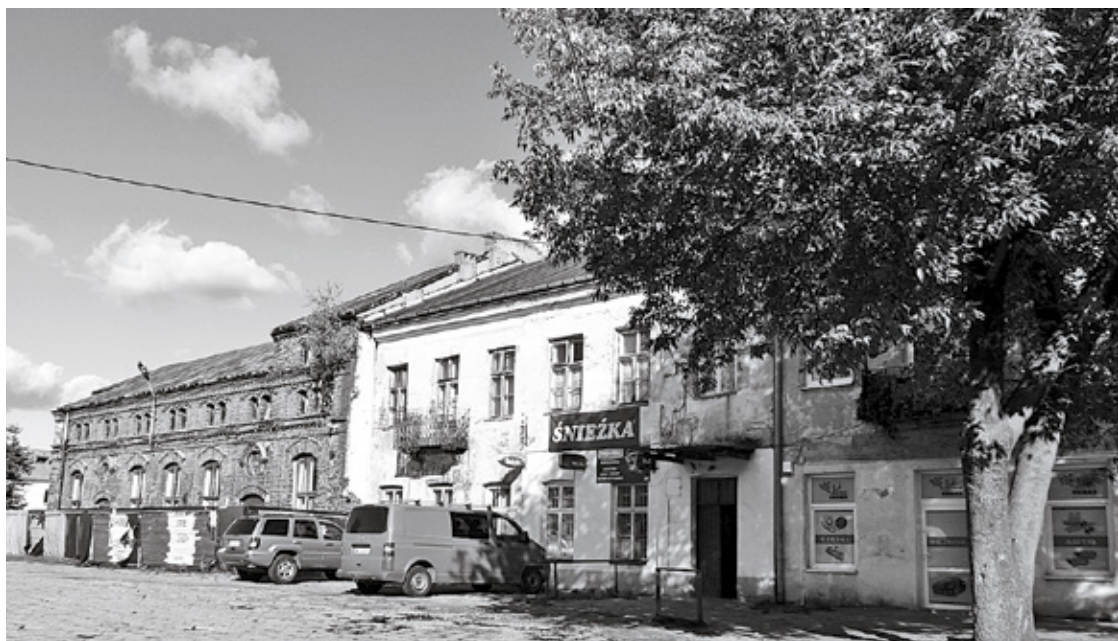
Dwór i prywatna synagoga cadyka z Góry Kalwarii

Następcą Altera miał zostać jego syn Abraham Mordechaj Alter (1865–1948) i kiedy został cadykiem, miał