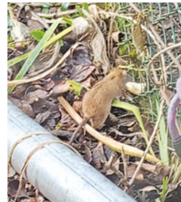
Gniazdo szczurów znajduje się pod budynkiem socjalnym przy ulicy Mirkowskiej

– Państwowy Powiatowy Inspektor Sanitarny w Piasecznie informuje, że do Sekcji Higieny Komunalnej Powiatowej Stacji Sanitarnej-Epidemiologicznej w Piasecznie wpłynęło zgłoszenie dotyczące pojawienia się gryzoni pod ww. adresem. Zgodnie z właściwością sprawa została przekazana do Burmistrza Miasta i Gminy Konstancin Jeziorna – informuje Marlena Lichočka z Sekcji Higieny Komunalnej.