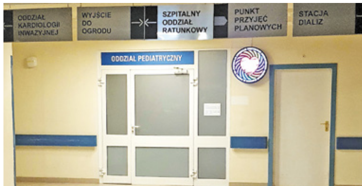
Choroba ma najcięższy przebieg u najmłodszych pacjentów

O wroście zachorowań w powiecie poinformowano m.in. szkoły i przedszkola, podlegające gminie. Te otrzymały również zalecenia, które mają również trafić do rodziców dzieci, wraz z informacją o objawach, charakterystycznych dla tej choroby. Natomiast w samych placówkach edukacyjnych zalecono częste wietrzenie pomieszczeń i naświetlanie ich lampą bakterioobójczą, jak również zwiększenie liczby dezynfekcji powierzchni biurek, stołów w stołówce czy kłamek.