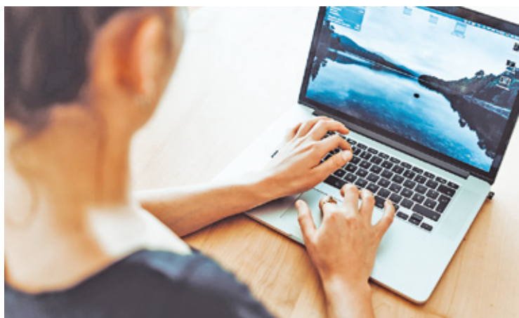
Na zmianie przepisów skorzystają samozatrudnieni z różnych branż

Problem ten dotyczy nawet kilka milionów osób, które pracują, ale nie mają umów o pracę.