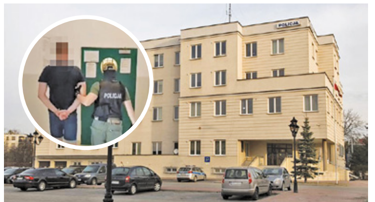
Za to, co zrobił 21-latkowi, kierowcy z aplikacji grozi nawet 15 lat więzienia