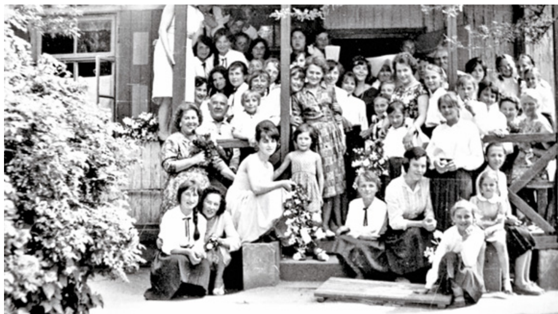
1962 r. – pożegnanie sierot wychowywanych przez Siostry Szarytki odchodzących do Państwowego Domu Dziecka

Jest rok 1651 i przez Polskę przechodzi epidemia morowej zarazy, jest to czas, gdy na ulicach Warszawy leżą zwłoki umarłych, a między nimi drepczą dzieci, których rodzice albo pozostawili na pastwę losu, albo zmarli i nie ma nikogo z rodziny, kto by zaopiekował się wygłodniałymi maluchami. Król Polski Władysław IV, a potem od wolnej elekcji w 1648 r. Jan Kazimierz obaj z dynastii Wazów i obaj ożenieni z księżniczką z Mantui Ludwiką Marią Gonzagą ciągle byli uwikłani w wojny i inne niepokoje, które mnożył tylko biedę i ludzkie nieszczęścia. W takim oto czasie królowa małżonka,