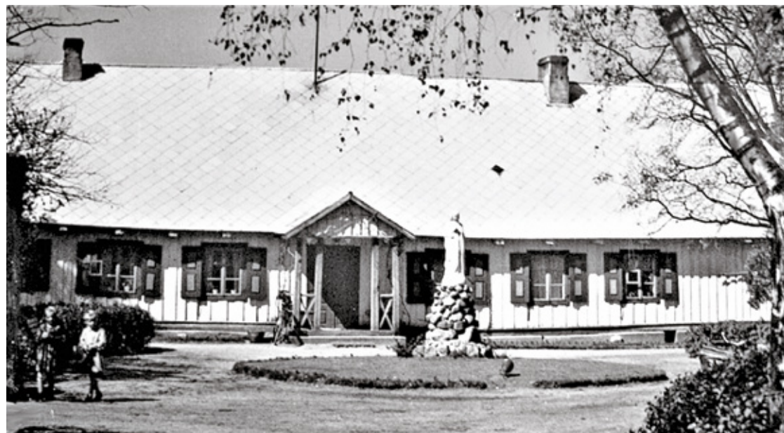
Stary budynek Ośrodka Wychowawczego w Łbiskach – czasy międzywojnia

patrząc z okien pałacu na ten ogrom nieszczęścia, postanawia sprowadzić z Francji Siostry Miłosierdzia. Królowa wychowana we Francji widziała i znała działania księży i zakonnic powołanych do pracy z chorymi i porzuconymi według reguł wdrożonych przez księdza Wincentego a Paulo. I tak najpierw do Polski przyjeżdżają z Paryża trzy siostry miłosierdzia. Płyną Bałtykiem do Gdańska i konno docierają do Warszawy. Natychmiast wyszukują potrzebujących pomocy i skutecznie jej udzielają. To inspiruje królową do dalszych działań. Zostaje utworzony przez Marię Ludwikę Gonzaga tzw. Instytut św. Kazimierza, będący pod zarządem Sióstr Miłosierdzia św. Wincentego a Paulo, czyli wspomnianych tu Szarytek, nazwa od francuskiego słowa charité (czyt. szarite) co znaczy miłosierdzie, który praktyczną działalność rozpoczął w 1659 r., a czas był straszny, trwała wojna ze Szwedami nazwana później Potopem, na wschodzie utarczki z Rosjanami i powstanie Chmielnickiego. Maria Gonzaga nadaje Zakonowi Szarytek