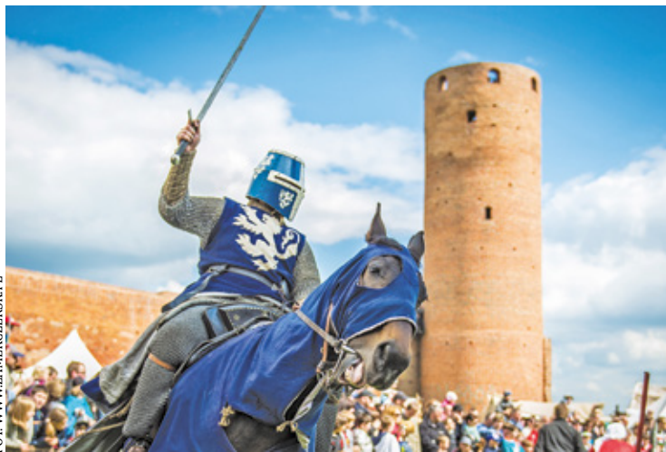
Budowla jest dostępna dla turystów przez cały rok, a nadzór administratorski nad nim pełni Ośrodek Kultury w Górze Kalwarii. Odbywają się tu przeróżne wydarzenia, które ściągają turystów z całego Mazowsza

– Rozmawialiśmy o potrzebach finansowych związanych z pracami konserwatorskimi przy naszym najważniejszym zabytku, czyli Zamku Książąt