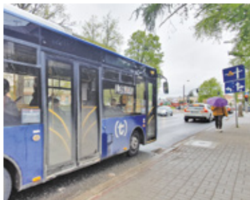
L39 łąpie opóźnienia m.in. przez remont ul. Sienkiewicza, który powoduje korki na innych ulicach miasta

Wiosną wdrożono zmianę. – Niestety mimo krótszej trasy autobusy linii L39, która dojeżdża i rusza spod szpitala w Piasecznie, wciąż łąpią duże opóźnienia – informuje jeden z podróżnych. – Chodzi szczególnie o kursy w popołudniowych godzinach szczytu, kiedy to opóźnienia sięgają nawet 15 czy 20 minut. W tym czasie można przejść kawał drogi – dodaje.