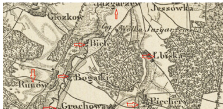
Mapa okolic Piaseczna z 1843 r. z zaznaczonymi miejscowościami, których historia łączy się z historią Sióstr Miłosierdzia

Miłosierdzia, która by nie cierpiała pokus przeciwko swojemu powołaniu. Bądź przekonana, że nie wytrwasz, je-