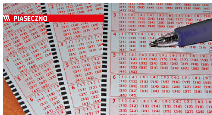
Nowy Lottomilioner zagrał w punkcie LOTTO przy ul. Sierakowskiego 13/3

|| Mazowsze - Kradli auta na potęgę s. 9