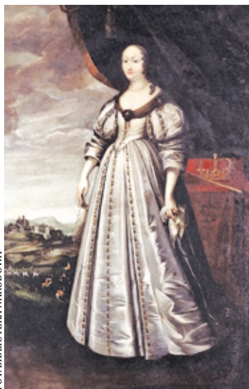
Królowa Ludwika Maria Gonzaga

i organizatorzy kolonii nie pokrywali kosztów podróży. Ale nie z tej akcji kolonijnej były znane Łbiska.