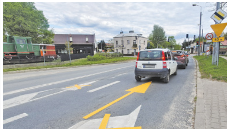
Starostwo zmieniło przed długim weekendem czasową organizację ruchu, wydzielając lewoskręt

sy ruchu na każdym z wlotów, dlatego w celu zapewnienia bezpieczeństwa niechronionych uczestników ruchu