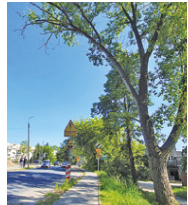
Suche konary zagrażają nie tylko pieszym, korzystającym z chodnika po południowej stronie drogi, ale także kierowcom i rowerzystom