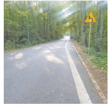
Petycję w sprawie wdrożenia zmian na Gościńcu Wareckim podpisało 1689 osób