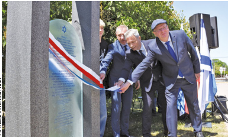
Macewa stała na skwerze przy ul. ks. Sajny, czyli na terenie dawnego getta

– Patrząc na pomnik Adama i Ewy, myślimy o początku świata, a Macewa Pamięci przypomina o końcu świata górkokalwaryjskich Żydów – powie-