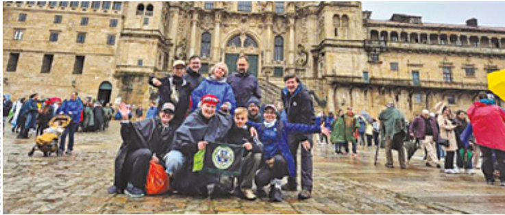
FOT. UROCZYSKO KONSTANCIN

Harcerze obrali za cel drogę św. Jakuba, która jest szlakiem pielgrzymkowym do katedry w północno-zachodniej Hiszpanii. Nim jednak wyruszyli, przygotowawali się do wyprawy niemal rok. Najważniejsze było trenowanie kondycji. Wędrówka rozpoczęła się 25 kwietnia. Każdego dnia harcerze szli około 20 km, a łącznie pokonali trasę 221 km. Wyprawa trwała 9 dni i wzięto w niej udział 11 osób.