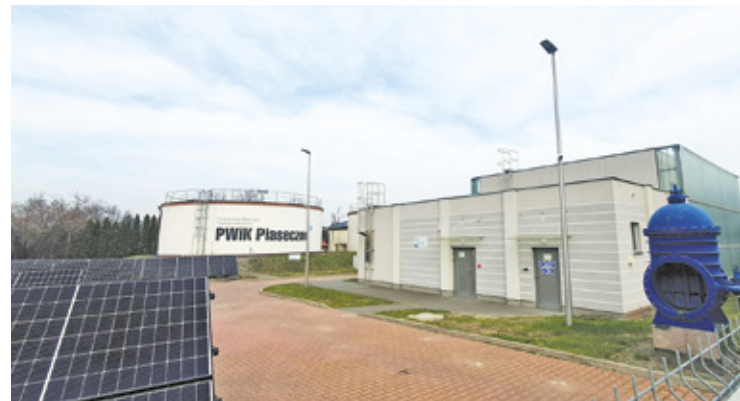
PWiK od lat inwestuje w odnawialne źródła energii, co pozwala ograniczyć wpływ rosnących cen na wzrost kosztów dostarczania wody i odprowadzania ścieków

– Jak wiadomo w tym czasie znacząco wzrosły przede wszystkim koszty energii, paliw czy koszty pracy. Gmina spółka wodociągowa od lat inwestuje m.in. w odnawialne źródła energii, co