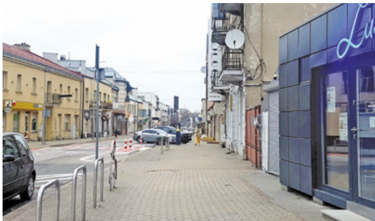
Jak tłumaczy urząd miasta, na więcej ławek wzdłuż ulicy Kościuszki nie ma na razie miejsca

Ulica Kościuszki pełna jest punktów handlowych i usługowych, licznie odwiedzanych przez mieszkańców. Ci narzekają na niewystarczającą liczbę ławek. Od skrzyżowania z ulicą Nadarzyńską, gdzie znajduje się jedna ławka, idąc w stronę starego cmentarza, przysiąść można jedynie pod sklepami sieci Rossmann i Pepco. W ubiegłym roku zlikwidowano ławki na skwerze u zbiegu Kościuszki z ul. Sienkiewicza, które i tak najczęściej, a nierzadko godzinami, służyły osobom raczącym się trunkami z alkoholem.