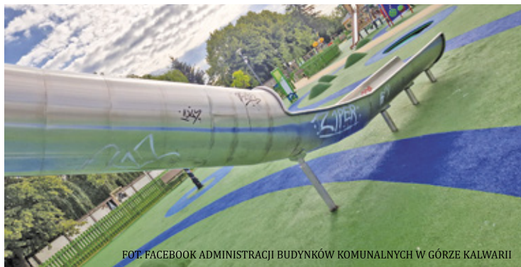
Pomazane elementy infrastruktury nie są rzadkim widokiem na placu zabaw

– Jeśli chodzi o to konkretne miejsce aktywnego wypoczynku, borykamy się z wandalizmem w postaci zabrudzenia elementów wyposażenia napisami i innymi rysunkami wykonywanymi na elementach wyposażenia przez młodzież i dzieci. Są to najróżniejsze napisy i znaki wykonywane głównie pisakami lub sprayami. Jest dla nas