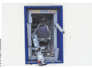
Do wybuchu doszło w piątek ok. godz. 2.30

Mundurowi sprawdzali także, czy w pasażu bądź jego okolicy działały