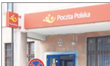
||| Góra Kalwaria - Pocztowy problem s. 2

PIASECZNO ||| GÓRA KALWARIA ||| KONSTANCIN-JEZIORNA ||| LESZNOWOLA ||| PRAŻMÓW ||| TARCZYN ||| URSYNÓW