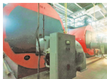
Dzięki inwestycji w kogenerację, gminna spółka produkuje i sprzedaje prąd

zwanego skojarzenia, czyli kogeneracji wysokosprawnej. Dzięki temu przy pomocy spalania gazu, na odwrót wytwarzamy energię elektryczną, a odpadem jest ciepło które zagospodarowujemy w naszej sieci ciepłowniczej – dodaje prezes gminnej spółki.