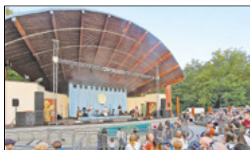
||| Konstancin-Jeziorna - Moc Atrakcji s. 3