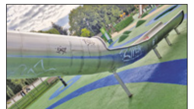
||| Góra Kalwaria - Apel rodziców s. 7