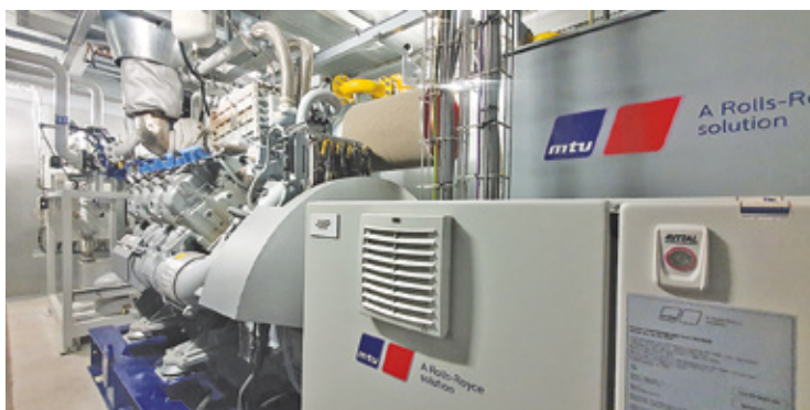
Nowy system kosztował blisko 52 mln zł, z czego prawie połowę tych środków pozyskano w formie dotacji