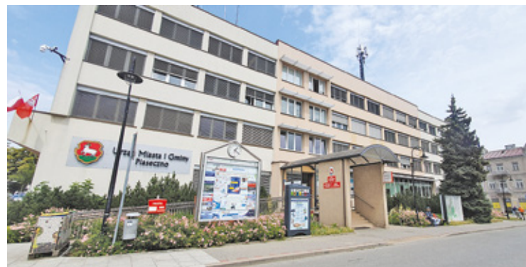
Obiekt pamięta jeszcze lata 60. ubiegłego wieku

Władze miasta i gminy nie mają na razie sprecyzowanych planów co do budynku „starego” magistratu. – Do wybudowania nowego ratusza jeszcze daleka droga. Przed nami projektowanie, później szukanie finansowania, wy-