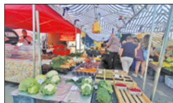
||| Prażmów - Targ od lipca s. 7