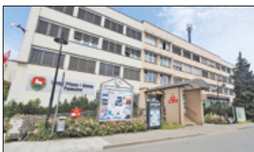
||| Piaseczno - Stary urząd czeka na decyzję s. 2