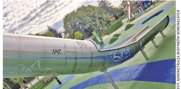
Pomazane elementy infrastruktury nie są rzadkim widokiem na placu zabaw

– Mieszkańcy miasta żywo interesują się nowym obiektem i zgłaszają niepokojące ich sytuacje zarówno do administratora terenu tj. Administra-