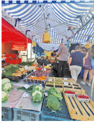
Mieszkańcy gminy Prążmów będą mieli swój targ. Na zdjęciu targowisko w Piasecznie

Do urzędu zgłaszać mogą się sprzedawcy – przedsiębiorcy, rolnicy, koła gospodyń wiejskich i wszyscy inni, którzy mogliby oferować swoje wyro-