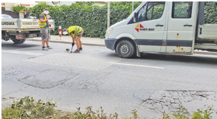
W ramach doraźnego remontu poprawiono m.in. zapadlisko przy skrzyżowaniu Jana Pawła II z Ludową

W czwartek 4 lipca na ww. fragmencie ulicy pojawili się drogowcy.