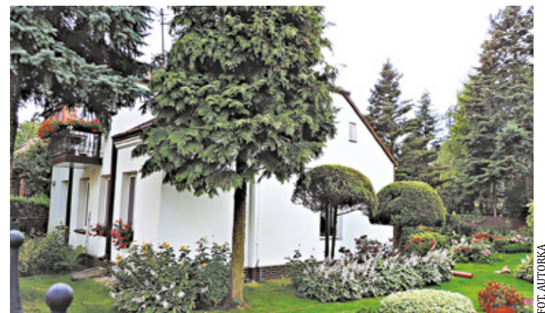
Stuletni dom przy ul. Kniaziewiczza

Dopiero w trzeciej klasie Wiktoria zabrała syna do klasy, w której miała wychowawstwo. Skończyło się na tym,