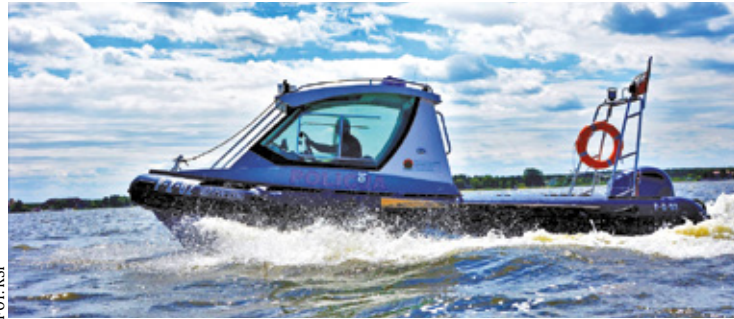
Statystyki policyjne wskazują, że do największej liczby utonięć dochodzi na rzekach