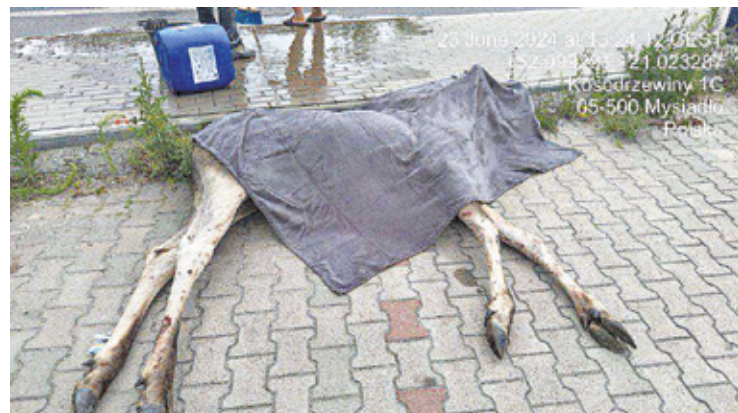
Niestety oba łosie, które od rana kręciły się po okolicy, zginęły w dramatycznych okolicznościach

– Poprosiliśmy o interwencję SRS Animals Rescue Poland. Na miejscu