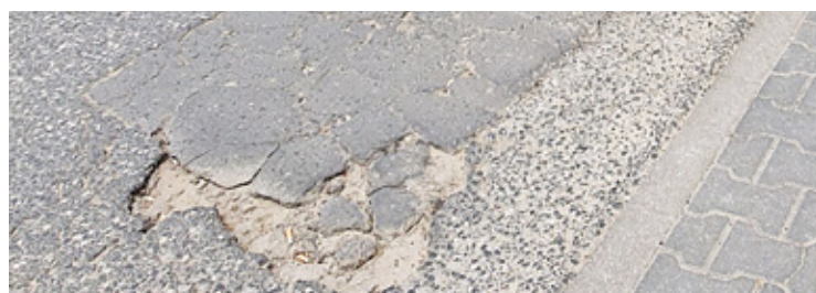
Ulica Jana Pawła II, szczególnie fragment od ul. Puławskiej do Wojska Polskiego, to liczne dziury i wyboje, nie tylko na drodze, ale także na chodniku