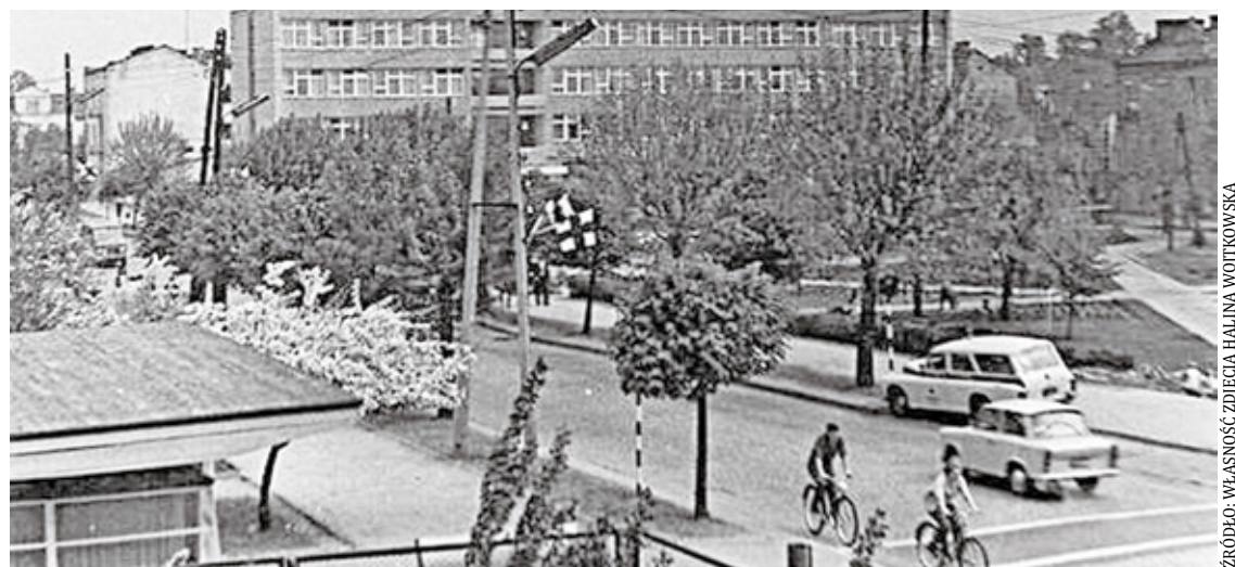
Samochód karetki pogotowia. Zdjęcie zrobione tuż przy budynku Pogotowia Ratunkowego w Piasecznie, jedno z wielu miejsc pracy bohatera mojego opowiadania

się tajnym nauczaniem, za tę działalność dostanie na koniec swojej pracy order Polonia Restituta. Podróż z Pia-