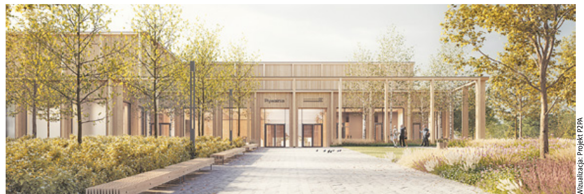
Wizualizacja: Projekt PZPA

Do dyspozycji mieszkańców i gości będzie basen sportowy o sześciu torach długości 25 m i stałej głębokości 2 m. W strefie przeznaczonej dla rodzin z dziećmi znajdą się: basen o głębokości 1,1 m do nauki pływania, wodny plac zabaw, dwie zjeżdżalnie,