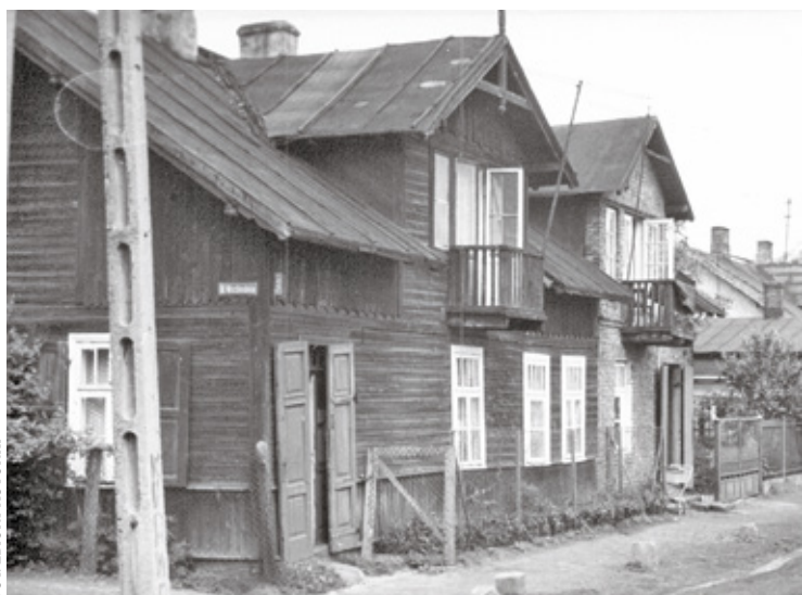
Dawna zabudowa ul. Kauna dom na rogu ul. Wschodniej i ul. Kauna

nad Jeziorką, pić lemoniadę i słuchać dziadkowych opowieści o wojnie. Zimą podróżować do warszawskiego mieszkania dziadków. To był piękne czasy dzieciństwa i nagle zetknięcie się z odejściem niezwykle bliskiej osoby