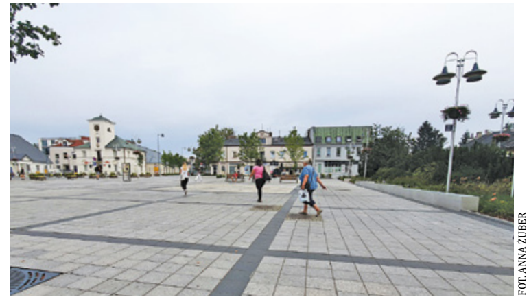
Rynek w Piasecznie – klasyczny przykład betonozy