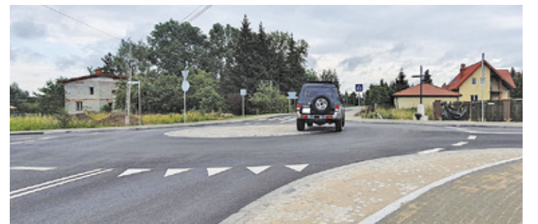
Po kilku tygodniach utrudnień kierowcy mogą korzystać ze skrzyżowania w zupełnie nowej odstonie