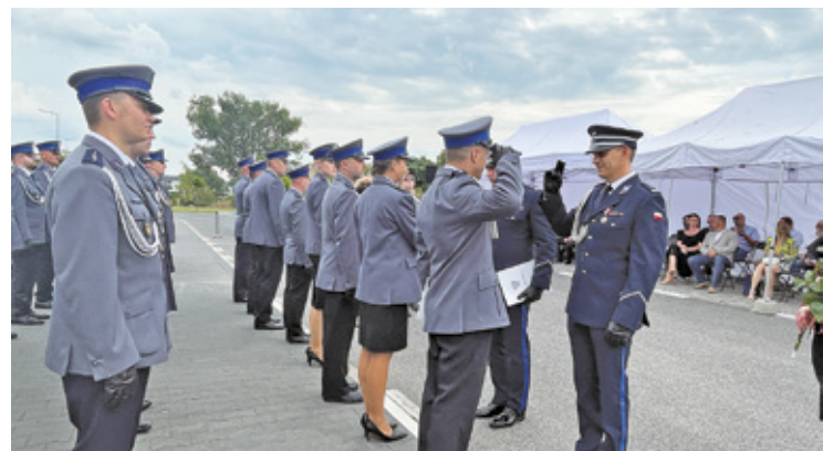
Podczas uroczystości kilkudziesięciu funkcjonariuszom wręczono awanse na wyższe stopnie policyjne

Obchody rozpoczął o godz. 14 uroczysty apel, podczas którego kilkudziesięciu funkcjonariuszom