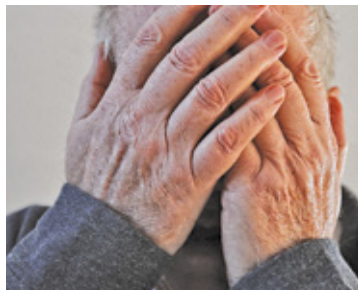
Po upadku mężczyzna nie był w stanie wstać z podłogi

gotowia stan mężczyzny nagle się pogorszył. 71-latek stracił przytomność, konieczna była reanimacja. – Szybkie wspólne działania ratujące życie, które razem podjęli policjanci i ratownicy medyczni, sprawiły, że senior przeżył. Dopiero po tych działaniach mężczy-