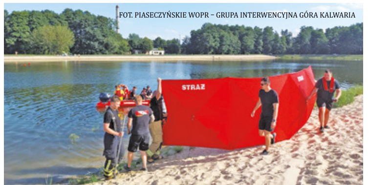
FOT. PIASECZYŃSKIE WOPR - GRUPA INTERWENCYJNA GÓRA KALWARIA