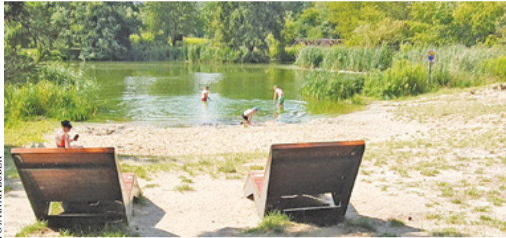
Na Górkach Szymona obowiązuje zakaz kąpielii, ale jest on regularnie łamany. W połowie lipca tonął tu mężczyzna, który zmarł w szpitalu

Nielegalne kąpieliska z terenu powiatu piaseczyńskiego ponownie trafiły na listę miejsc szczególnie niebezpiecznych oznakowanych tablicami „Czarny punkt wodny” na terenie województwa mazowieckiego. Jak przypomina piaseczyńska policja, tablicą „CZARNY PUNKT WODNY” oznaczone są dwa miejsca: na Górkach Szymona i na 475 kilometrze Wisły – w rejonie dzikiej plaży przy tzw. tamie wojskowej w Górze Kalwarii.