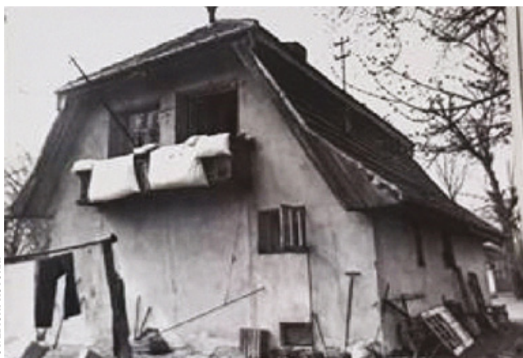
Dom rodziny Kleszczów z ul. Rejtana