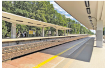
Weekendowe utrudnienia dotkną pasażerów SKM-ki oraz Kolei Mazowieckich

Jak informuje PKP PLK, zmiany dotkną 140 pociągów regionalnych i aglomeracyjnych kursujących między Radomiem, Piasecznem a Warszawą