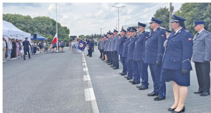
Tegoroczne obchody odbyły się w Lesznowoli przy tamtejszym urzędzie gminy