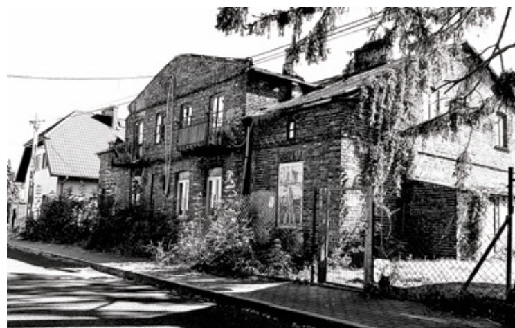
Zabudowa ul. Kauna coraz bardziej nowoczesna, niewiele domów zaprojektowanych przed 1939 r. tu zobaczymy, oto jeden z nich

Nie pomogły msze za jej duszę, systematyczne palenie zniczy na jej grobie. W końcu sprowadzono zakonnik z zakonu Paulinów z ulicy Długiej w Warszawie. On na szczęście wiedział, co robić. Pochodził po domu, pochodził po ogrodzie, odprawił modlitwy i na koniec kazał ściąć dwa drzewa: wier-