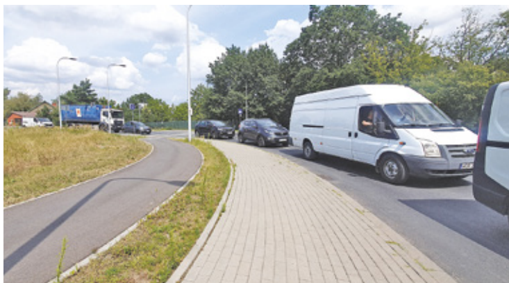
Za kilka lat ulica Julianowska zmieni swój charakter

Szykuje się kolejna rewolucja drogowa w mieście. Włodarze gminy planują, że po wybudowaniu nowego połączenia drogowego – ulicy Żeromskiego i Mazurskiej do ulicy Chyliczkowskiej, zamknie ulicę Julianowską.