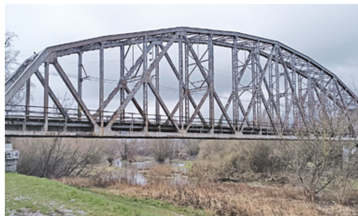
Kładka powstanie, gdy będą do tego warunki

– Bardzo podoba nam się pomysł (o ile będzie on mógł być wdrożony) dostosowania do ruchu rowerowego kładki technicznej na moście, który ma powstać. Z żalem musimy uznać argumentację PKP PLK, że nie będzie możliwości wykorzystania jako kładki