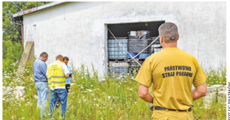
17 lipca służby po raz kolejny skontrolowały magazyn przy ul. Akacjowej