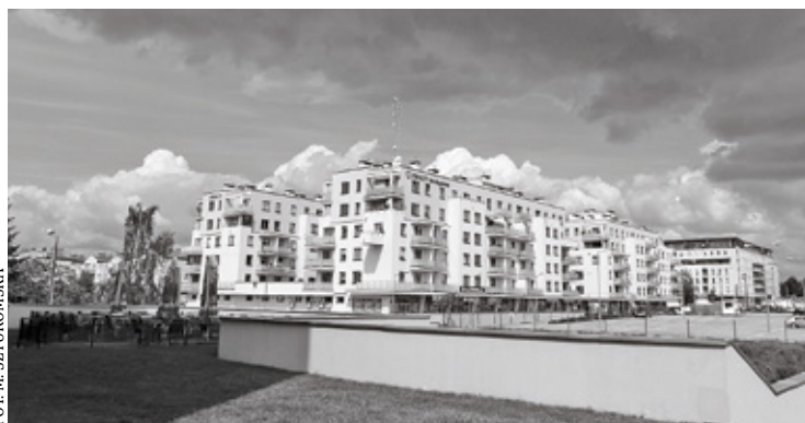
Fragment ulicy Kniaziewicza nad Perełką dziś

Lecz generał Kniaziewicz, wzrostem najszlachetniejszy, Pokazało się, iż był w rękę najsilniejszy; Ujawszy rapier, lekko jakby szpadę dźwignął I nad głowami gości błyskawicą mignął, Przypominając polskie fechtarskie wykrety: