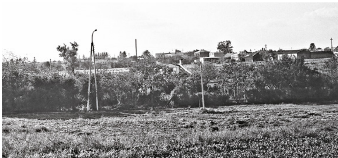
Nad Perełką przy ul. Kniaziewicza lata 70.

Domek, co pamięta salonik fryzjerski, to już jedyny drewniany relikw z przeszłości, który jakimś cudem zachował się do dziś. Zastanawiam się jednak, czy pamięć nie spletała mi figla i może był tu kiedyś po prostu identyczny domek z identyczną werandą i panią fryzjerką, ale zniknęła jak inne domy. Może mieszkańcy ul. Kniaziewicza wyjaśnią mi tę zagadkę.