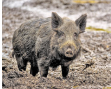
Dziki zwierzęta coraz częściej pojawiają się w okolicach ludzkich siedlisk, głównie z powodu działalności człowieka

Po fatalnym zdarzeniu z łosiami, które przez kilka godzin przemieszczały się w okolicy ul. Puławskiej i Geodetów, a ostatecznie musiały być uśpione, mieszkańcy zastanawiają się, skąd ich obecność na terenach zurbanizowanych. Okazuje się, że najczęściej sami się do tego przyczyniamy.