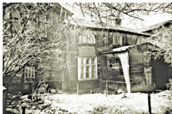
Dom burmistrza Herba przy ulicy Kniaziewicza (nie istnieje)

ile jest prawdy z tymi rakami, trudno dziś ustalić.