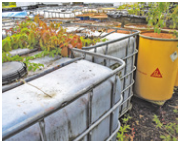
W zadanej hali magazynowej wciąż zalega około 2000 pojemników typu mauser i nieustalona liczba beczek stalowych o pojemności 200 litrów

W maju 2020 roku wyszło na jaw, że przy ul. Akacyjowej w Nowym Prażmowie składowane są odpady szkodliwe dla ludzi i środowiska. Okazało się, że w murowanej i zadanej hali magazynowej znajduje się około 2000 pojemników typu mauser i nieustalona liczba beczek stalowych o pojemności 200 litrów. Z uwagi na bardzo duże stężenie lotnych związków organicznych w powietrzu do hali weszli jedynie strażacy w szczelnych kombinezonach i aparatach tlenowych.