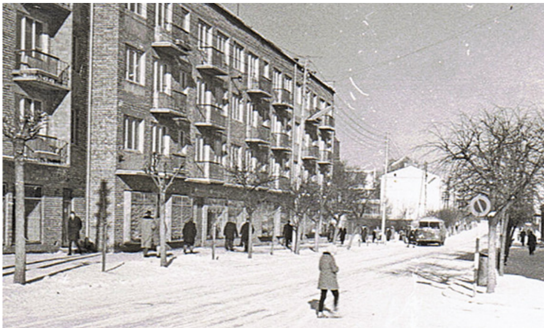
Blok przy ul. Kościuszki 18 w 1963 r.