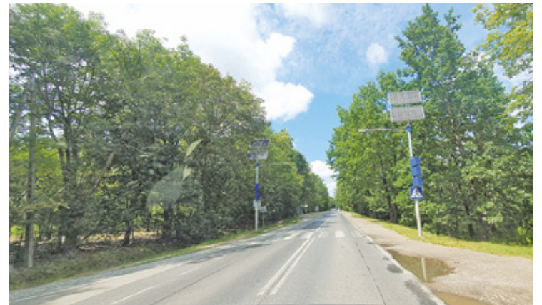
Realizacja koncepcji z obecnymi założeniami oznaczałaby m.in. wycinkę wylesienie, czyli wycinkę na znacznych terenach

Fundacja wskazała także, że koncepcja jest rażąco niezgodna z zapisami