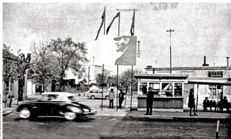
Przystanek autobusowy do Warszawy przy ul. Kościuszki w latach 70.

szły z niezamkniętymi drzwiami oraz wiszącymi „winogronami”, jak nazywano ludzi stojących na schodkach w niedomkniętych drzwiach. Nieszczęślikowi z łubiankami nie udało się wsiąść do środka pojazdu. Stał na schodkach i