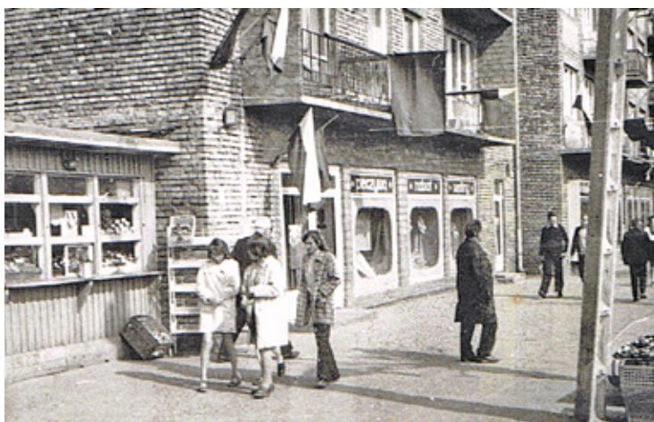
Blok przy ul. Kościuszki 18 w roku 1973

mat, no bo kto nie pamiętałby kobiety zatrudnionej przy porządkowaniu chodników? Było ją słychać od świtu zamiatającą miotłą chodniki, dźwięk był charakterystyczny i ten jej głos! Na widok syna wracającego rankiem z zabawy nocnej (zdarzało się to często, a