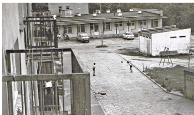
Przychodnia przy ul. Fabrycznej w 1981 r.