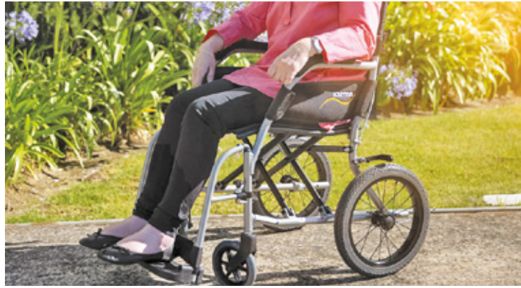
Dzięki usłudze osoby z niepełnosprawnościami będą wygodniej podróżować

Pierwszeństwo w realizacji przewozu mają osoby, które udają się na rehabilitację, leczenie, do pracy bądź