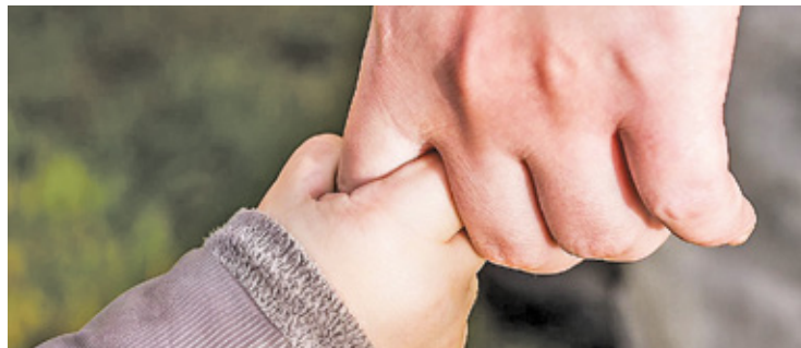
O pieniądze z programu Aktywny rodzic będzie można ubiegać się od 1 października

– Dla pracujących opiekunów przeznaczony jest świadczenie „Aktywni rodzice w pracy”. Jeśli dziecko uczęszcza do żłobka, to będzie na nie przysługiwać świadczenie „Aktywnie w żłobku”, które zastąpi dotychczasowe dofinansowanie żłobkowe z ZUS. Trzeci rodzaj