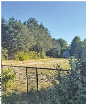
Poszukiwania idealnej działki

– Gmina Tarczyn planuje zakup działki i w związku z tym ważnym kryterium wyboru jest cena. Działka ma mieć minimum 1 ha i znajdować się w mieście Tarczyn. Gmina Tarczyn