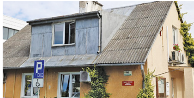
Obecna siedziba GOPS

Wynajem powierzchni biurowej przy ul. Oficerskiej ma rozwiązać nie tylko problem z komfortem pracy pracowników, lecz także podnieść standard obsługi mieszkańców. Dodatkowo