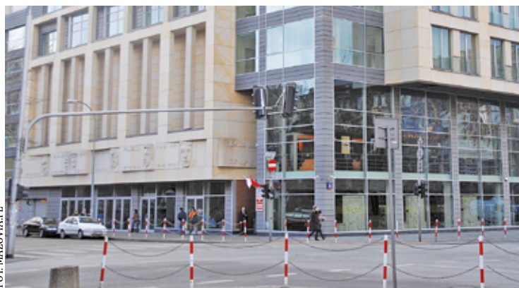
Siedziba Urzędu Marszałkowskiego Województwa Mazowieckiego w Warszawie ul. Jagiellońska 26

Wykonawca wybrany w przetargu, firma Mota-Engil Central Europe wybuduje 3-kondygnacyjny obiekt