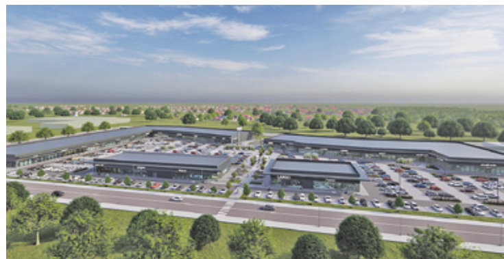
SMYK będzie jednym z ok. 40 sklepów i zajmie powierzchnię ponad 600 m kw.

Jak poinformował San Park Piaseczno, do grona najemców San Parku w ostatnim czasie dołączyła kolejna ciesząca się ogromną popularnością marka – SMYK. Sklep znany jest w Polsce od wielu lat, ale swoje placówki ma na