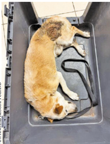
Pies niestety musiał zostać uspijony

– Interwencja odbyła się wieczorem. Podczas gdy pies konał, jego właściciele spożywali kolację, nie przejmując się jego stanem. To było chyba najbardziej przerażające, ta obojętność,