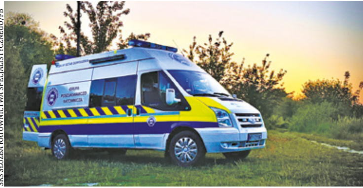
Bus pomoże m.in. podczas koordynacji poszukiwań osób zaginionych

W środku pojazdu znajduje się niezależne źródło energii, łączność radio i internetowa, GPS, monitoring, system SIRON wspierający poszukiwania osób zaginionych i sprzęt ratowniczy. Oprócz tego jest też kącik dla samych