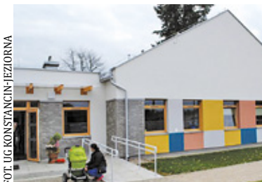
Przedszkole nr 3 „Kolorowe Kredki”

Montaż kolejnych paneli fotowoltaicznych. Energia słoneczna będzie źródłem zasilania Przedszkola nr 3 „Kolorowe Kredki” w Oborach.