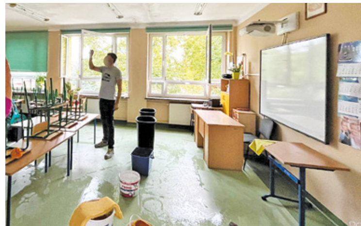
Szkody, jakie wyrządziła woda opadowa, usunie wykonawca remontu dachu