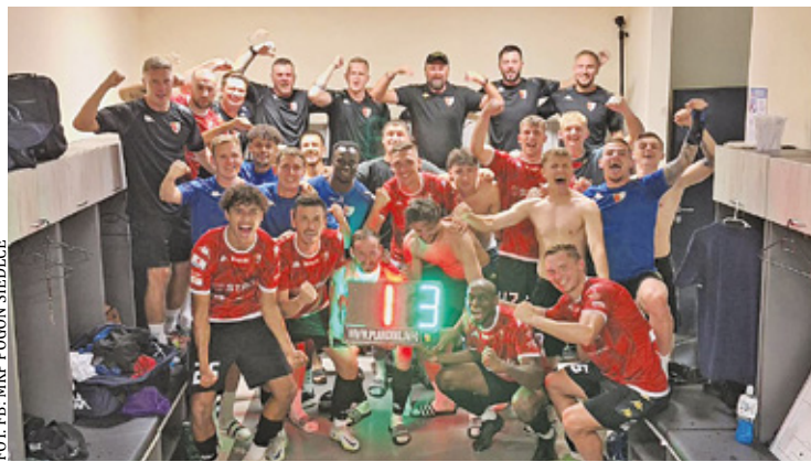
Byli piłkarze Piaseczna grają na drugim najwyższym poziomie w kraju

Po trzech seriach gier w IV Lidze MKS Piaseczno z zerowym dorobkiem punktowym plasuje się na 16. miejscu. Bez punktów są również jeszcze w tym sezonie Tygrys Huta Mińska (beniaminek) oraz Pilica Białobrzegi, która w zeszłej edycji rozgrywek występowała ligę wyżej. W środę 28 sierpnia o godzinie 17:00 ktoś z dołu tabeli na pewno wywalczy już pierwsze oczko – właśnie wtedy w Mińsku Mazowieckim rozpocznie się mecz Tygrysa z Piasecznem. Podopieczni tre-