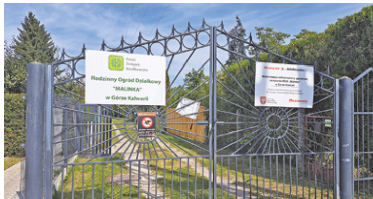
W czasie upałów działkowicze podlewiają ogródki. To powoduje problemy w ciśnieniem wody na pobliskim osiedlu

– Oczywiście wszyscy wiemy, że problem istnieje, pomimo zwiększonej ilości wody w systemie i możliwości dostawy. Klientem dla ZGK jest cała spółdzielnia, a nie pojedynczy odbiorcy. Pytanie co dzieje się z siecią rozprządzającą wodę po osiedlu, skoro na wejściu do tego układu jest wystarczająco