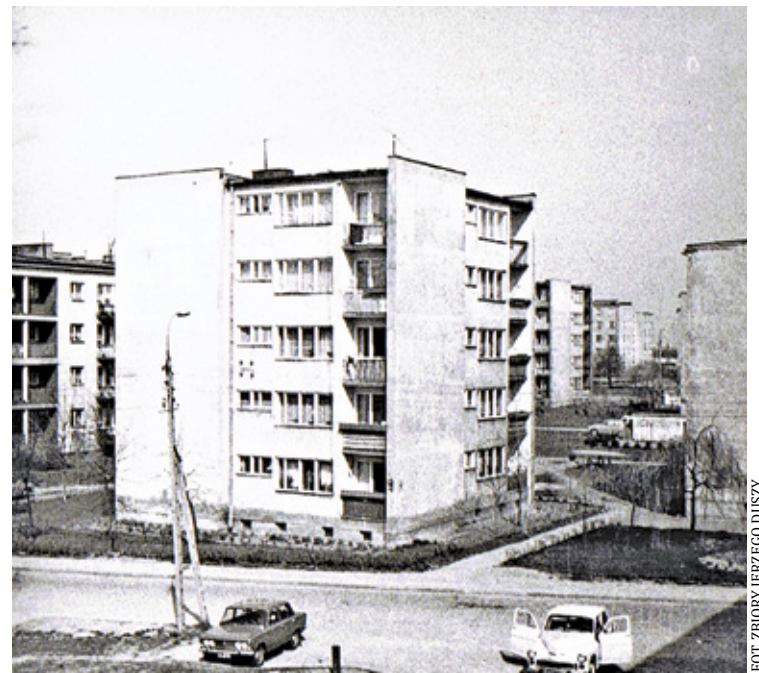
Piaseczyński świat w roku 1977, dziś ulica Szkolna

przy ul. Puławskiej, tych pierwszych jeszcze z cegły funkcjonowały kuchnie węglowe, sprowadzano wozami węgiel, do kuchni zamawiano butle gazowe propan butan. Brak w części starego Piaseczna kanalizacji powodował, że niektórymi ulicami płynął rynnikiem strumień składający się z zawartości nocników i mydlin z prania. Domy, nawet eleganckie, nie miały bieżącej wody i kanalizacji. Była i owszem dzielnica dawniej letniskowa w okolicach ul. Rejtana, gdzie w pięknych willach były łazienki z przyłączami do szamb, ale to była rzadkość. Sławojki, czyli ubikacje dla lokatorów, na podwórkach były wszędzie. Taki świat z jeżdżącymi szambiarzami i wozami z węglem, z dymiącymi kominami i smrodem. Zaczęło z tym walczyć, ale żeby walczyć trzeba było mieć wykształconą i uczciwą kadrę. Żeby walczyć trzeba było mieć utwardzone, solidne drogi, żeby samochody dostawcze z materiałami budowlanymi nie grzęzły w błocie. Pani inżynier opowiada jak to asfalt produkowany w Baniosze dla potrzeb piaseczyńskiej GK rozwożono po