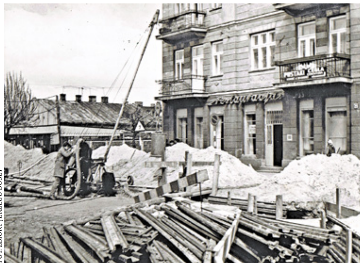
Kanalizacja i wodociągi, prace przy ulicy Kościuszki, skrzyżowanie z ul. Sienkiewicza w 1972 r.

Gospodarki Komunalnej z prośbą aby przeszła do jego instytucji, zostawiła Stolbud z jego awanturami. No i tu Bo-