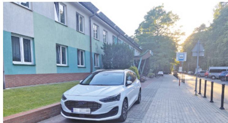
Na chodniku pod CKR-em zatrzymują się rodzice odwożący dzieci na basen, ale też parkują tu pacjenci

Pod Centrum Kompleksowej Rehabilitacji przy ulicy Gąsiorowskiego kierowcy wjeżdżają na chodnik i na nim parkują. – Aktualnie problem nie jest tak duży, ponieważ są wakacje, ale w roku szkolnym na chodniku robią się wręcz korki samochodów i pieszy jest zmuszony iść ulicą – zaalarmował nas Czytelnik. CKR problem dostrzegł i już wprowadził zmiany.