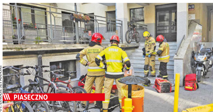
FOT. LUKASZ SZYMAŃSKI ||| PIASECZNO 6-latka zsunęła się z podwyższenia i upadła na chodnik

||| Góra Kalwaria - Strach przed migrantami s. 8