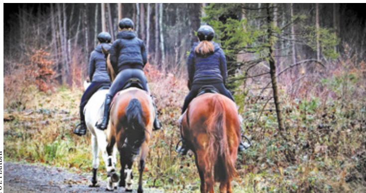
Miłośnicy koni nierzadko korzystają z dróg i chodników, by na przykład przedostać się na leśne dukty

Po koniach też trzeba sprzątać, ale chamstwo uważa, że nie musi. Kulturalny człowiek wie, że się brudu po sobie nie zostawia – napisała jedna z mieszkank na forum mieszkańców gminy Konstancin-Jeziorna.