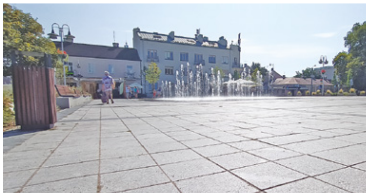
Drzewa nawet jak urosną cienia wypoczywającym na ławeczkach nie dadzą