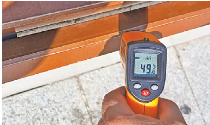
Pomiar bezdotykowym miernikiem laserowym wykazał, że ławka na rynku już o godz. 14 nagrzała się do blisko 50 stopni Celsjusza

Z czystej ciekawości wybraliśmy się na piaseczyński rynek z laserowym miernikiem temperatury powierzchni. O godzinie 14:00 pokazał on, że betonowe płyty na rynku miejskim nagrzały się do 42 stopni Celsjusza.