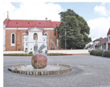
Po zmianie władzy w Tarczynie trwa audyt gospodarczy

Urzędnicy zapewnili, że finalny raport z audytu będzie udostępnio-