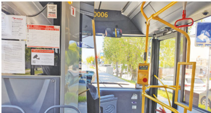
Policjanci, jadący autobusem L39, przyłapali 66-letniego kierowcę na rozmowie przez telefon

Niestety jak się okazało, jazda autobusami nie zawsze jest bez-