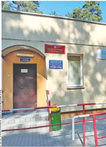
Ośrodek dla cudzoziemców w Lininie