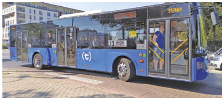
L13 nie zniknie całkowicie, ale na trasie z Góry Kalwarii do Piaseczna pojawi się nowa linia autobusowa

Zdaniem mieszkańców połączenie autobusowe Góry Kalwarii