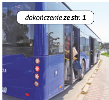
dokończenie ze str. 1

Nowa linia będzie jeździła częściej, prostszą trasą, dotrze do PKP Piaseczno (przesiadka do SKM) oraz zakończy trasę przy punkcie przesiadkowym do 709 (przystanek Zgoda). Dodam, że podobnie jak to ma miejsce obecnie posiadacze karty mieszkańca pojedają nią bezpłatnie. Nowa linia to póki co