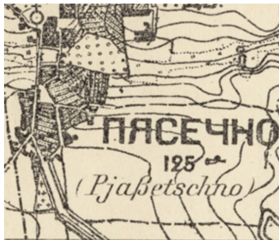
Mapa Piaseczna sprzed 1914 r. (od południa) widoczny cmentarz i brak zabudowań za nim. Granica miasta tuż obok murów cmentarnych

zonego przez hrabiankę Cecylię Plater Zyberkównę, a ta chętnie wszystkich zapraszała do Chyliczek. Czym, czyli jakim środkiem transportu przybywała owa publika do Piaseczna, ano oczywiście kolejkami wąskotorowymi.