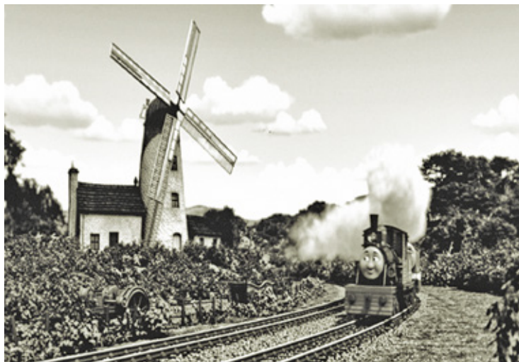
Zabawny rysunek do książeczki dla dzieci, jakoś mi się skojarzył z naszą Ciuchcią i stacją Wiatrak

czy chodziło o to, że na peronie była przepychanka wśród pasażerów, czy dziewczyny sądziły, że do przyjazdu pociągu jest jeszcze czas. Pociąg nadjechał nagle. Maszynista widząc kobiety na torach dawał znak gwizdkiem, żeby