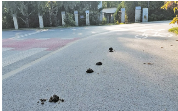
Końskie odchody w Bobrowcu na ścieżce pieszo-rowerowej poirytowały niektórych mieszkańców

Od kiedy Bobrowiec i okolice coraz gęściej pokrywają ogrodzenia, jezdnie, chodniki, ścieżki rowerowe