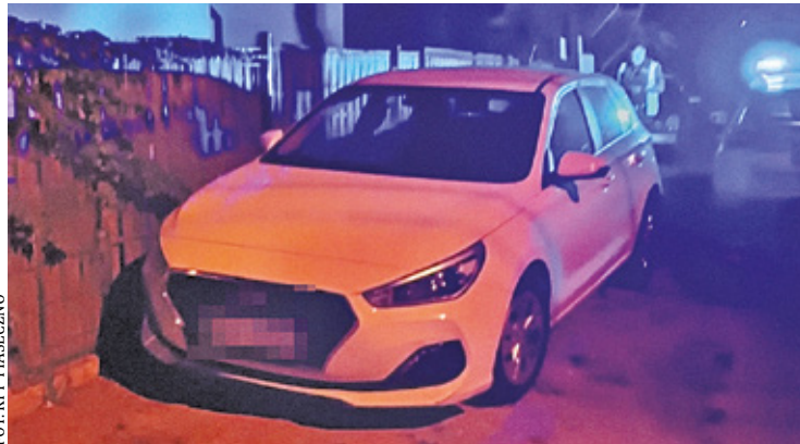
56-latek miał prawie 2 promile alkoholu w wydychanym powietrzu

F unkcjonariuszy zaalarmował inny uczestnik ruchu drogowego, który zauważył niebezpieczną jazdę 56-latką i nie pozostał obojętny na stwarzane przez niego zagrożenie drogowe. - Na miejsce, wskazane przez zgłaszającego, który był świadkiem zagrożenia na drodze, natychmiast zostali zadysponowani funkcjonariusze ruchu drogowego, którzy pojawili się tam niezwłocznie, by ustalić, co się stało. W chwili, gdy policjanci chcieli przebadać 56-latkę na trzeźwość, spotkało się to z dużym niezadowoleniem mężczyzny, który znieważał funkcjonariuszy, używając wielu wulgarnych i obelżywych słów wobec nich - relacjonuje mł. asp.