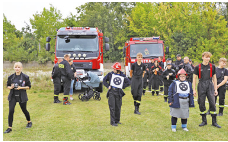
Drużyny składające się z osób z niepełnosprawnościami brały udział w dwóch konkurencjach: sztafecie i bojówce