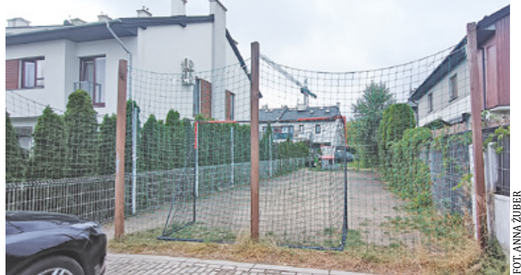
Mini boisko przeszkadza jego sąsiadom

Mieszkańcy dwóch lokali sąsiadujących z boiskiem poskarżyli się na uciążliwość związane z zabawami i rozgrywanymi na placu meczami.