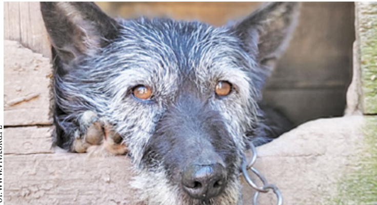
Nowelizacja ustawy ma ograniczyć bezdomność zwierząt, która w Polsce wciąż jest na zatrważającym poziomie

P od koniec maja do Sejmu trafił obywatelski projekt ustawy „Stop łańcuchom, Pseudohodowcom i Bezdomności Zwierząt”. Miesiąc później Marszałek Sejmu wydał postanowienie o przyjęciu zawiadomienia o utworzeniu inicjatywy obywatelskiej. Dzięki temu mogła się rozpocząć akcja zbierania