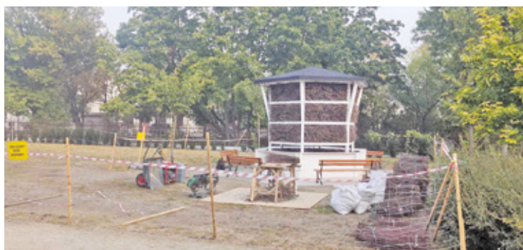
Na budowę nowej tężni władze Góry Kalwarii pozyskały dofinansowanie z programu „Mazowsze dla klimatu”