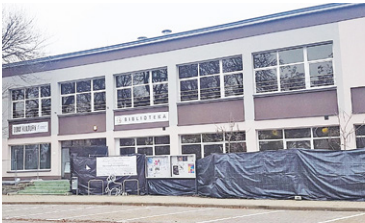
W Domu Kultury zamontowana zostanie pompa ciepła powietrze-woda i instalacja fotowoltaiczna

D om Kultury w Piasecznie, to wyjątkowe miejsce na kulturalnej mapie miasta. To tu od lat odbywa się kultowe „Świeczowisko”, tu przyjeżdżają i grały gwiazdy polskiej muzyki, które w kameralnej sali przy Kościuszki były dosłownie na wyciągnięcie ręki.