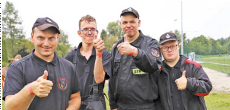
Tegoroczne zawody były już czwartą edycją tego wyjątkowego wydarzenia