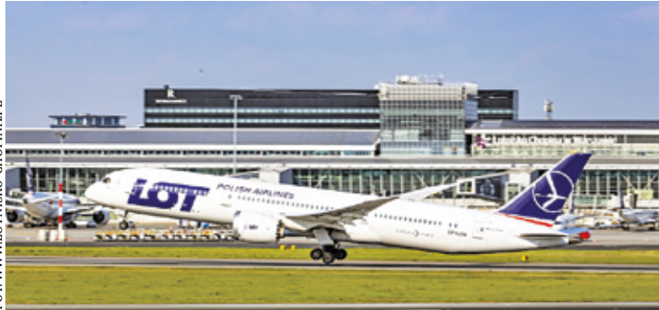
Polskie Porty Lotnicze spodziewają się we wrześniu dużego ruchu pasażerskiego

- Jeszcze nigdy w swojej 90-letniej historii warszawskie lotnisko nie od-