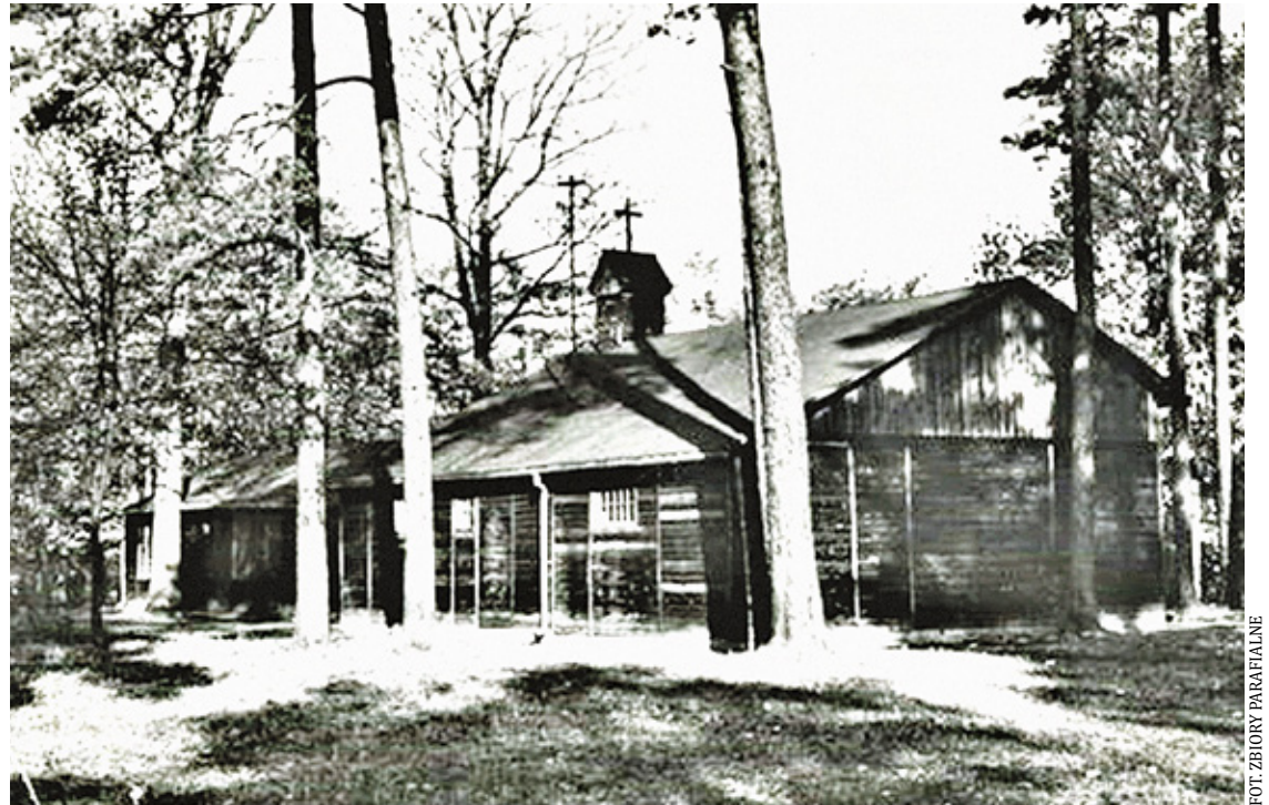
Drewniana kaplica w Zalesiu Dolnym przy ul. Modrzewiowej lata 60. XX W.