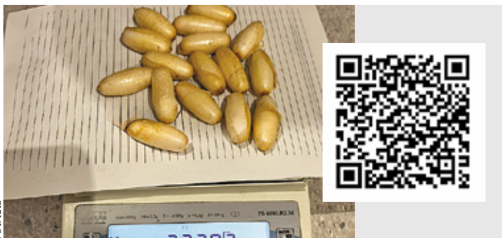
Podróżny z kokainą w żołądku przyleciał do Warszawy z Paryża. Zeskanuj kod QR i zobacz film z zatrzymania przemytnika

Mazowiecka Krajowa Administracja Skarbowa (KAS) udaremniła przemyt kokainy na Lotnisku Chopina w Warszawie. Okazuje się, że mężczyzna, który próbował przemyścić ponad kilogram narkotyków w żołądku, to nie pierwsza taka osoba w tym roku.