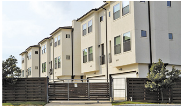
FOT. ZDJĘCIE ILLUSTRACYJNE

Wójt gminy Prażmów Michał Kmieciak uznał, że planowana w Krępie inwestycja na ponad 400 lokali, nie jest zgodna z miejscowym planem zagospodarowania przestrzennego. Chodzi o osiedle w rejonie ul. Krótkiej i Długiej, w ramach którego powstać miało ponad 200 domów jednorodzinnych i budynek usługowy.