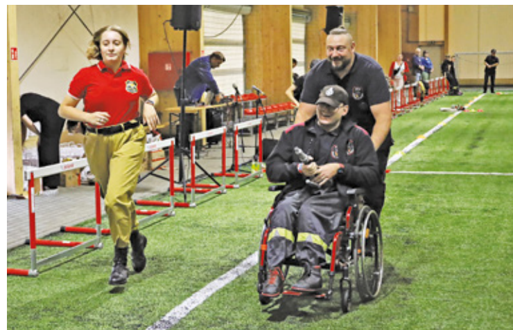
W zawodach uczestniczą osoby z niepełnosprawnościami, a każdą z nich podczas „rywalizacji” opiekuje się strażak państwowej straży pożarnej, OSP lub młodzieżowej drużyny pożarniczej