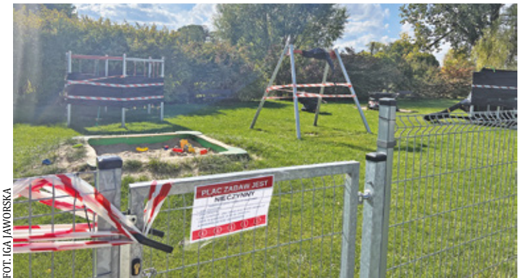
Plac zabaw został zamknięty, a urządzenia oklejone taśmą, by nikt z nich nie korzystał

Plac zabaw przy ulicy Gminnej został zamknięty, bo powstał bez odpowiedniej dokumentacji budowlanej. Mimo wcześniejszych prób legalizacji, obiekt nie spełnia wymogów planu zagospodarowania przestrzennego. Gmina planuje przeniesienie urządzeń w inne lokalizacje, a przyszłość placu pozostaje niepewna.