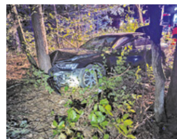
Kierowca audi opuścił samochód samodzielnie. Pojazd po uderzeniu w drzewo automatycznie wezwał służby ratunkowe

– To spotkanie kierowcy z łosiem. Nie każdej kolizji da się uniknąć, ale możemy złagodzić jej skutki, zachowując rozsądną prędkość, dostosowaną do panujących warunków. Przypuszczamy, że tym razem tak właśnie było – podkreślali strażacy w wieczornym komunikacie. – Kierowca opuścił pojazd o własnych siłach. Zwierzę nie zostało potrącone i uciekło do lasu. Uważajmy