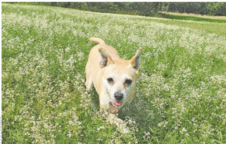
Nowelizacja ustawy ma poprawić los zwierząt

Projektodawcy chcą m.in. wprowadzenia zakazu stosowania łańcuchów i uwięzi, co uznawane jest wręcz znęcanie się nad psami, jak również ograniczenia pseudohodowli. Chodzi o stworzenie rejestru hodowli, nad którym czuwałaby inspekcja weterynaryjna. Ograniczyłyby to także niekontrolowane rozmnażanie zwierząt i pozwoliło określić warunki w hodowlach. W projekcie ustawy znalazł się też zakaz sprzedaży zwierząt domowych przez portale aukcyjne i sprzedażowe w Internecie. Jeśli nowelizacja wejdzie w życie, znęcaniem się nad zwierzętami