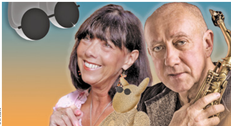
Krystyna Podleska (na zdjęciu obok Henryka Miśkiewicza) popularność zyskała dzięki roli w filmie „Miś” Stanisława Barei

Ważną częścią festiwalu jest konkurs filmowy zarówno dla pasjonatów filmu, studentów i absolwentów szkół artystycznych, jak i dla młodych, aktywnych amatorów oraz twórców niezależnych. Jego celem jest wyróżnienie artystów, którzy potrafią wnikliwie i krytycznie obserwować świat, przedstawiając go przy tym w sposób pogodny i życzliwy, sięgając po charakterystyczne dla patrona festiwalu środki - dystans, humor, ironię i sarkazm. W tym roku o nagrody rywalizuje ponad