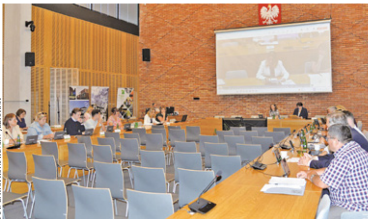
Inicjatywa wsparcia finansowego dla Łądko-Zdroju została poparta przez radnych jednogłośnie

– Każda forma pomocy finansowej, która pomoże nam odbudować naszą