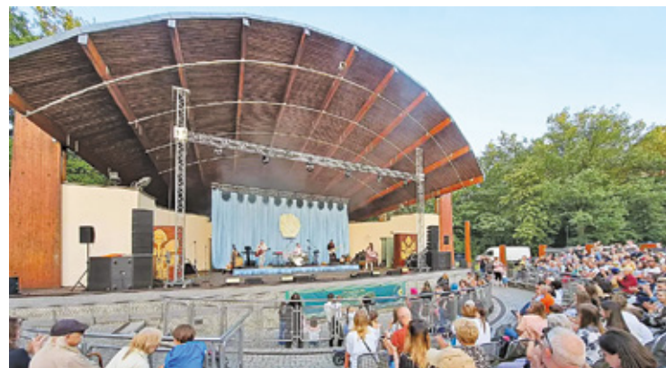
Jednym z letnich wydarzeń w amfiteatrze były Dni Konstancina

Otrzymałmy też dokładną rozpiskę wydarzeń z tegorocznego sezonu letniego. W maju zorganizowano w amfiteatrze Jarmark Kultury Urzecza i Dzień Strażaka. W czerwcu odbyły się tu Dni Konstancina, Turniej Orkiestr Dętych, Festiwal CHOPIN en VACANCES, a w lipcu zaplanowany był Jazz Zdrój Festiwal, który finalnie przeniesiono do sali w Hugonówce, mając na uwadze komfort artystów i publiczności. W dniu wydarzenia temperatura sięgała bowiem powyżej 35 stopni.