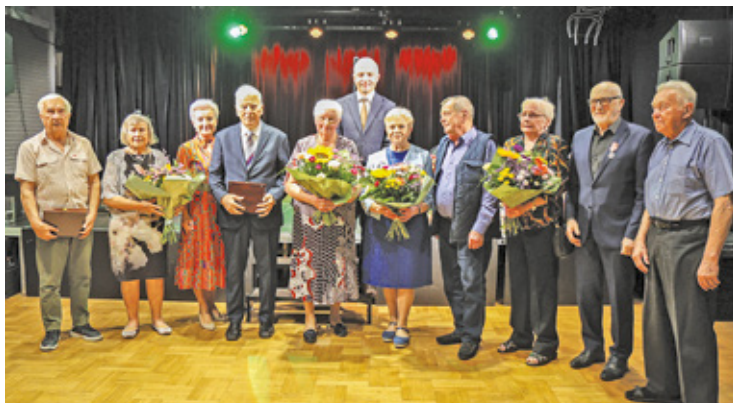
Gratulujemy parom z długim stażem!

W piątek (20 września) w Domu Kultury w Piasecznie uhonorowano małżeństwa, które mogą pochwalić się długim stażem. Złote i dia-