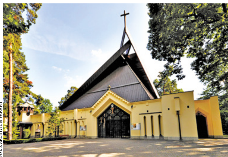
Kościół w parafii pod wezwaniem Najświętszej Marii Panny Wspomożenia Wiernych w Zalesiu Dolnym

Może się tak zdarzyć, że jak zostanie zgromadzony materiał budowlany na budowę budynku plebanii dojdzie do samowoli budowlanej i materiał zostanie wykorzystany do budowy kościoła