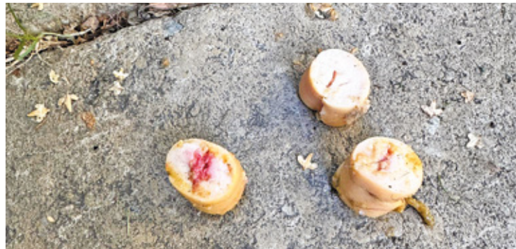
Zwierzę po zjedzeniu takiej trutki będzie umierać w męczarniach!!!

kiełbasy z trutkami. Były to dość regularne akcje, bo zwierzęta znalazły jedzenie 5 i 10 sierpnia. Mięso wyglądało na świeże, a trutki były dokładnie wciśnięte do środka. We wrześniu