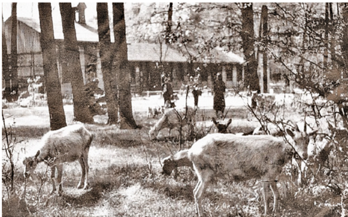
Jeszcze drewniana kaplica