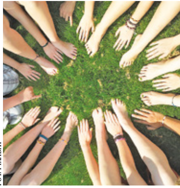
Młodzież będzie mogła doradzać radnym w sprawach jej dotyczących

Z pomysłem utworzenia Młodziżowej Rady Gminy do prążmowskiego urzędu zgłosiła się sama młodzież.