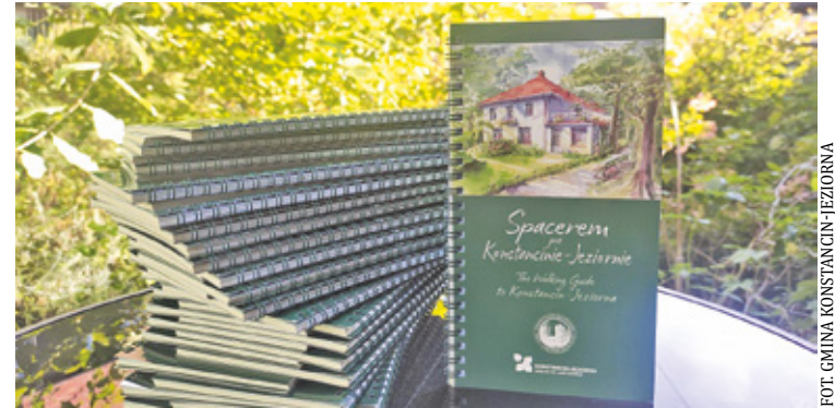
To wyjątkowa publikacja, która ma ułatwić zarówno mieszkańcom, jak i turystom zwiedzanie jedyne go uzdrowiska na Mazowszu

Pierwsza, licząca około 3 km, obejmuje zabytkowe wille i obiekty w samym centrum Konstancina-Jeziorna, na terenie Parku Zdrojowego i w jego bezpośredniej okolicy. Trasa nr 2 prze-