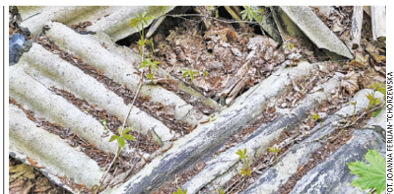
Azbest jest materiałem niebezpiecznym dla zdrowia

Szczegóły na stronie: www.piaseczno.budzet-obywatelski.org/wyniki