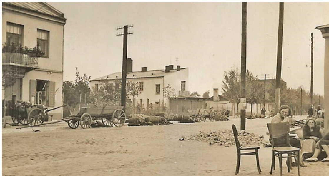
Ulica Tadeusza Kościuszki w Piasecznie zdjęcie z dni od 10-12 września 1939 r.

„Pod wozem leży poległy, polski żołnierz. Za leżącymi końmi, przy ogrodzeniu, leży kolejny. Mam ich zdjęcia zrobione z bliska, ale są bardzo drastyczne i póki co ich nie publikuję. Niemcy lubili fotografować naszych poległych i takie zdjęcia często umieszczali w albumach. Zdjęć poległych Niemców jest mało, gdyż cenzura niemiecka dbała o to, aby takie widoki nie wpływały na morale wojska. Przewa-