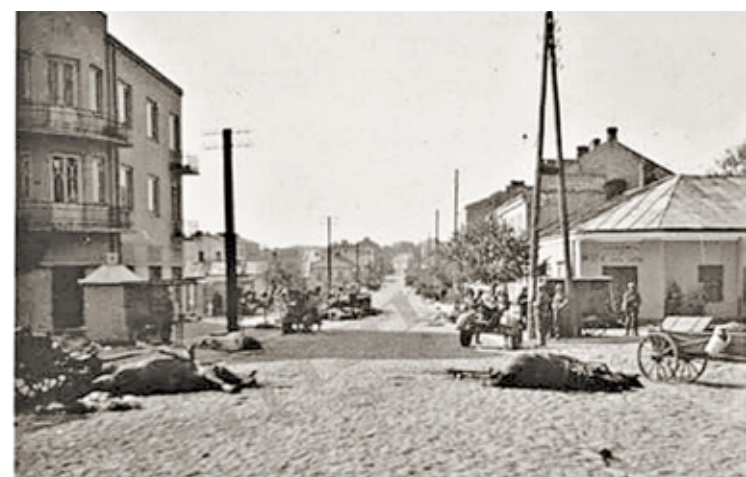
Zdjęcie z dni od 10-12 września 1939 r. Widok na ul. Kościuszki z rynku