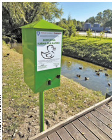
Automat do karmienia kaczek zawiera bezpieczną karmę

– Nowa inwestycja to krok w stronę połączenia edukacji, przyrody i technologii, mający na celu podniesienie świadomości ekologicznej mieszkań-