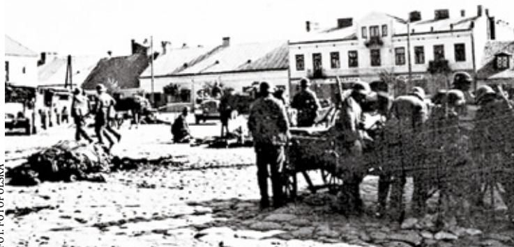
Rynek w Piasecznie we wrześniu 1939 r. widać martwe konie

w jakiej liczbie żołnierze polscy zdołali przedostać się przez Piaseczno do Warszawy. W aktach IPN sygnatura akt S 9/02/Zn czytamy o 21 żołnierzach polskich wziętych tej nocy do niewoli i rozstrzelanych w ogrodzie przy plebanii przez żołnierzy Wehrmachtu. Czyn ten stanowi zbrodnię ludobójstwa i był przedmiotem badań Komisji Ścigania Zbrodni przeciwko Narodowi Polskiemu. Śledztwo w tej sprawie umorzono. Dość dziwne jest to, że w aktach IPN rozstrzelani żołnierze figurują jako bezimienni, nie ustalono też formacji, z jakiej pochodzili mordercy. Historia 9, 10, 11 i 12 września w Piasecznie to ciąg zagadek i niejasności. Wehrmacht zamordował w tym czasie