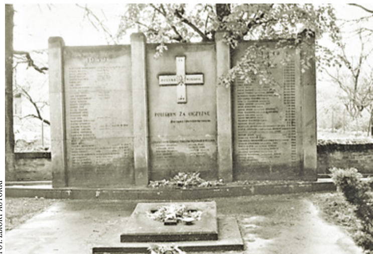
Mauzoleum na cmentarzu parafialnym w Piasecznie poświęcone poległym za Ojczyznę. Widok na stronę południową cmentarza, pomnik nie istnieje zastąpiony nowym