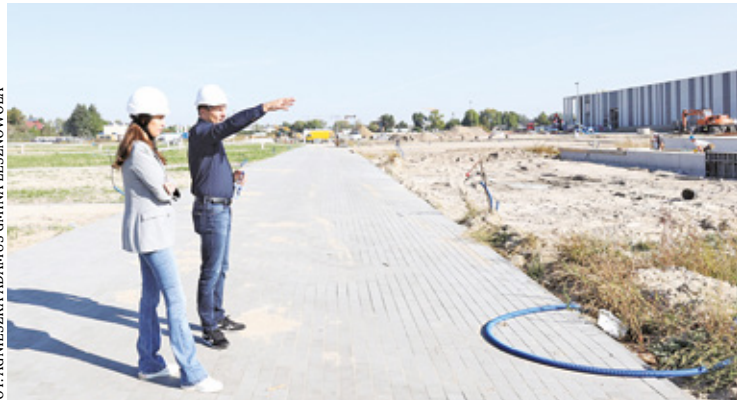
Wójt Gminy Lesznowola odwiedziła budowę inwestycji

Idea tego miejsca wzorowana jest na podobnych budynkach w Danii, Holandii czy Finlandii. Istnieje bowiem