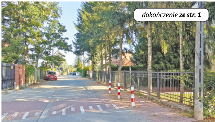
dokończenie ze str. 1

Jak mówią mieszkańcy, przez kilka lat pisanie pism byli odsyłani od urzędu. – Tu było ze 20 kontroli: z sanepidu, ze straży miejskiej. Raz urzędnicy dobiegali się do zakładu z pół godziny, bo był taki hałas, że pracownicy nie słyszeli, że ktoś się dobiega – twierdzą. – To był jeden wielki bałagan prawny, sprawa trafiła nawet do Najwyższego Sądu Administracyjnego. W końcu jednak