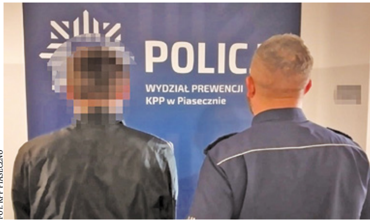
Uczestnicy bójki byli pijani. Pierwszy z nich miał blisko 2,5, a drugi prawie 3 promile

Obaj zatrzymani zostali przewiezieni do Komendy Powiatowej Policji w Piasecznie. Podczas przeszukania okazało się, że 42-latek posiada przy sobie marihuanę. Obaj mężczyźni trafili do cel.