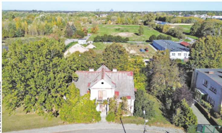
Willa w Mysiadle przy ulicy Osiedlowej 6

Przypomnijmy, że w październiku na Facebook'owych grupach mieszkańcy zaczęli dopytywać o budynek w Mysiadle, który według plotek miałby trafić do pobliskiej parafii. Rzecznik lesznowolskiego urzędu potwierdziła, że willa przy Osiedlowej 6 była przedmiotem dyskusji Komisji Merytorycznych Rady Gminy Lesznowola. Temat okazał się ważny dla mieszkańców, dlatego gmina postanowiła opublikować informację w tej sprawie na stronie internetowej.