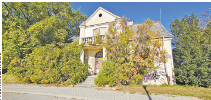
Ekspertyza pozwoli ocenić, jaki jest rzeczywisty stan techniczny budynku

„Nie podjęto żadnej decyzji administracyjnej o dzierżawie willi komukolwiek”