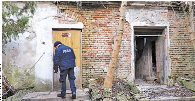
Policjanci podczas patroli zwracają szczególną uwagę na miejsca, gdzie mogą szukać schronienia i nocować bezdomni

Funkcjonariusze zachęcają też do zwracania uwagi na osoby starsze, samotne, schorowane, nieporadne życiowo.