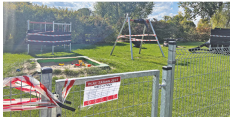
Plac zabaw pomiędzy ulicami Borsuka, Gminną i Słoneczną w Lesznowoli powstał na działce należącej do Krajowego Ośrodka Wsparcia Rolnictwa

– Plac zabaw pomiędzy ulicami Borsuka, Gminną, a Słoneczną w Lesznowoli powstał w roku 2019, na działce należącej do Krajowego Ośrodka Wsparcia Rolnictwa (KOWR). Gmina, nie będąc właścicielem gruntu, nie mogła zgłosić jego budowy do Starostwa. Budowa odbyła się zatem z pominięciem procedur. Dodatkowo nie została także zachowana określona w ustawie Prawo Budowlane minimalna odległość zabawek od drogi. Są to dwa główne powody, dla których podjęto decyzję o zamknięciu obiektu – wyjaśnia gmina w opublikowanym pod koniec października oświadczeniu.