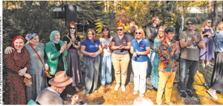
Sąsiedzki Klub Wolontariuszy działa na rzecz potrzebujących nie tylko w powiecie, ale też w Warszawie, Białej Podlaskiej, a nawet w Ukrainie

Działania grupy nie ograniczają się do jednego pola.