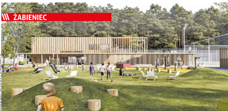
Wizualizacja z zewnątrz