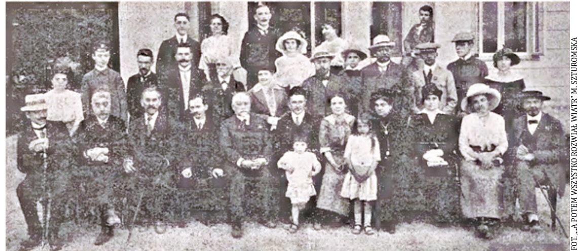
Stacja Entomologiczna w Borówce