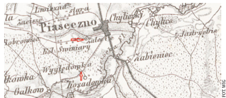
Mapa okolic z końca XIX w. Zaznaczona karczma Zalesie i Wyglądówka