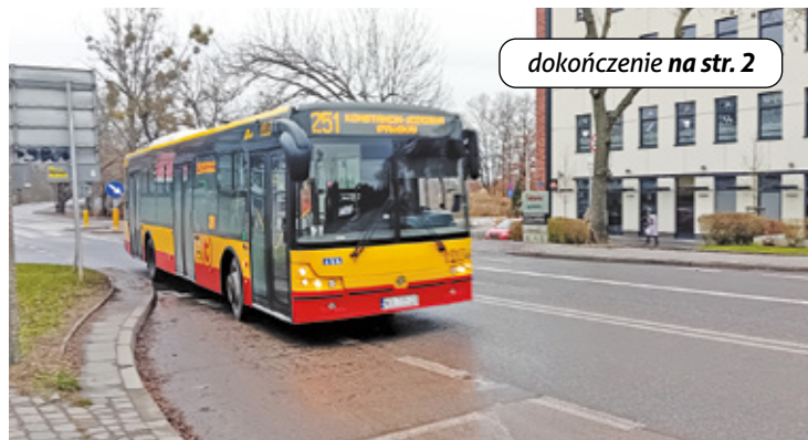
Linie 251 obsługują pojazdy standardowe o długości 12 metrów

Czy słynny „Tramwaj do Wilanowa” może utrudniać życie mieszkańcom Konstancina? Okazuje się, że tak. W związku z otwarciem połączenia tramwajowego do Wilanowa w Konstancinie-Jeziornie wprowadzono liczne modyfikacje linii autobusowych. Mieszkańcy coraz głośniejszemu narzekają.