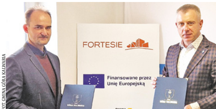
Umowa podpisana 5 grudnia dotyczy wymiany urządzenia odpowiedzialnego za temperaturę i wilgotność powietrza, a także wymianę ciepłą i przepływ wody basenowej

– Nowe urządzenia będą nie tylko nowoczesne, ale i energooszczędne. Dodatkowo do ich zasilania na części dachu basenu zostaną zamontowane panele fotowoltaiczne. Całość zostanie