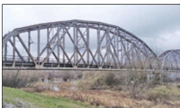
||| Góra Kalwaria - Szansa na kładkę s. 4