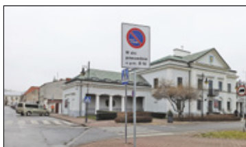
||| Góra Kalwaria - Strefa parkowania s. 2

PIASECZNO ||| GÓRA KALWARIA ||| KONSTANCIN-JEZIORNA ||| LESZNOWOLA ||| PRAŻMÓW ||| TARCZYN ||| URSYNÓW