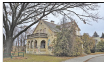
||| Mysiadło - Mieszkańcy w sprawie willi s. 6