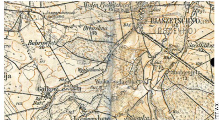
Mapa okolic Piaseczna z początku wieku XX około 1914 r. z zaznaczonymi liniami kolejki wąskotorowej

„Zosia poprosiła mnie o napisanie wspomnień o moim dziadku Szymo-