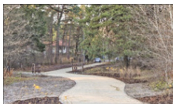
||| Zalesie Dolne - Aleja Kasztanów cieszy oko s. 5