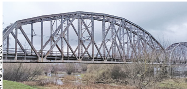
Ścieżka łącząca dwa brzegi Wisły mogłaby stać się atrakcją turystyczną

Temat jest szeroko omawiany w sieci, ale nie tylko – mieszkańcy w sierpniu zorganizowali pokojową demonstrację, która miała okazać poparcie dla tego pomysłu. Jak się okazuje