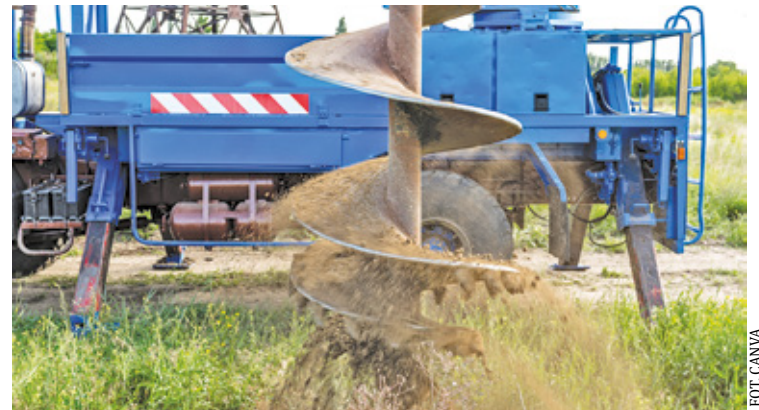
Przez wiele tygodni w mediach społecznościowych mieszkańcy gminy Lesznówola żyli tematem planowanego otworu wód geotermalnych, który miał być wykonany w Mysiadle

Z punktu widzenia warunków złożowych warto jest podkreślenia, że