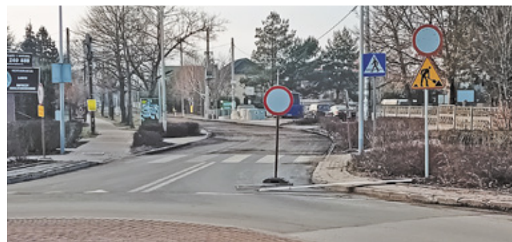
Objazd między Łączności, a ks. Stojewskiego wyznaczono ulicami Lipową i Rolną

Zmiany nie ominą także komunikacji publicznej.