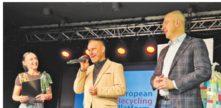
Góra Kalwaria, to jedna z sześciu gmin z całej Polski, będących partnerami projektu

była, wśród innych, ambasadorką Mody na Recykling w poprzednich edycjach.