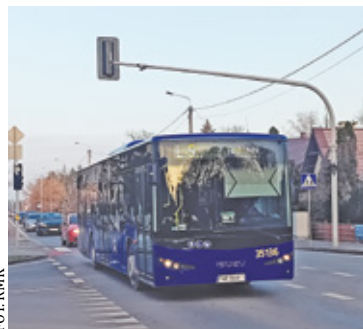
Wszystkie przystanki funkcjonują w trybie „na żądanie”

RADOMSKA 03 – przy ul. Radomskiej w Antoninowie, przed skrzyżowa-