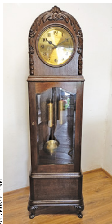
Zegar stojący Gustav Becker