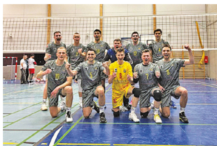
FOT. SPS KONSTANCIN-JEZIORNA SENIORZY

13 meczów – 13 zwycięstw. Kto zdoła zatrzymać rozpędzonego lidera? Na kolejny mecz MUKS-u będziemy musieli chwilę poczekać – następny pojedynek w sobotę 22 lutego o godzinie 13:15 w Warszawie. Przeciwnikiem będzie UKS LA Basket Warszawa.