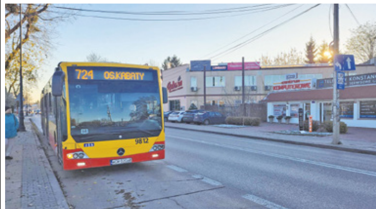
Władze gminy prowadzą intensywne rozmowy z ZTM, aby uniknąć wyłączenia weekendowych kursów

O d 20 stycznia linia autobusowa 724 kursuje na skróconej trasie, obejmującej jedynie odcinek pomiędzy osiedlem Kabaty a centrum Konstancina-Jeziorny. Zmiany te są wynikiem fatalnego stanu drogi wojewódzkiej nr 721, która jest w trakcie przebudowy. Jednocześnie trasy linii L16, L32, L52, N50 pozostają bez zmian.