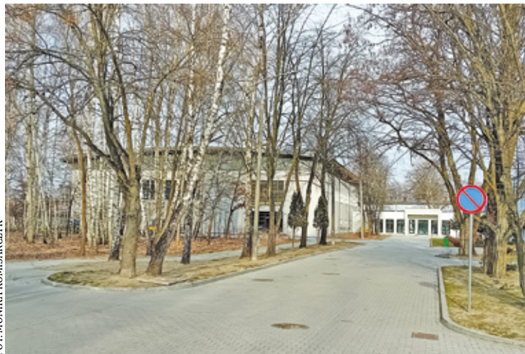
Budowa trwała aż pięć lat, mimo że według planów hala miała powstać do końca marca 2021 roku

Na budowie były nawet kilkumiesięczne przestoje. W 2023 roku urzędnicy mieli zerwać umowę z dotychczasowym wykonawcą, który się z niej nie wywiązywał, ale ostatecznie to on kończy budowę. Nowy wykonawca podjął pracę na budowie, ale pojawiły się problemy z terminowym dostarczeniem potrzebnych materiałów.