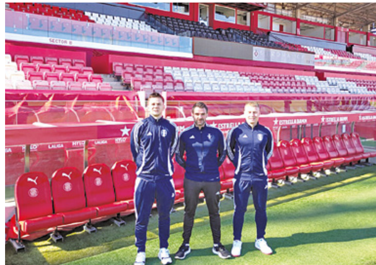
Trenerzy MKS Piaseczno uczą się od najlepszych

Jak się uczyć, to od najlepszych. Trenerzy piłkarskiego MKS Piaseczno efektywnie wykorzystują czas w trakcie zimowego obozu i nabywają wiedzę od szkoleniowców pracujących w jed-