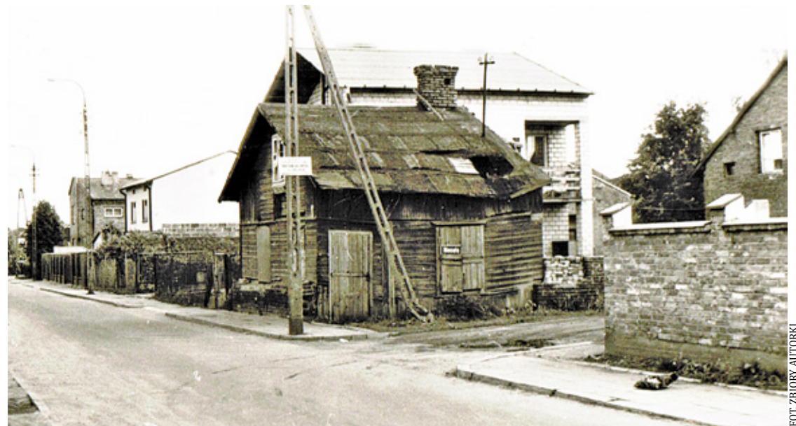
Sklepik państwa Kłosów na rogu ul. Wschodniej i ul. Niecałej

Ten sklepik pojawia mi się czasami w snach, w których jestem małą dziewczynką i idę tam po zakupy. I zawsze