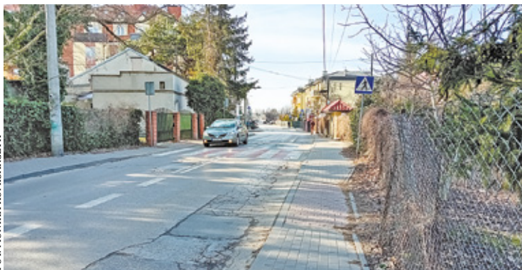
Przy modernizacji Nadarzyńskiej zaplanowano też poprawę odwodnienia i budowę nowego oświetlenia

Przypomnijmy, że piaseczyński urząd w ubiegłym roku przygotował koncepcję przebudowy ul. Nadarzyńskiej na odcinku od Kniaziewicza do Dworcowej. Mieszkańcy mogli składać uwagi do opracowania. Po zaplanowanej rozbudowie na Nadarzyńskiej pojawi się ma chodnik po obu stronach jezdni – obecnie jedna strona posiada odcinki o bardzo wąskim chodniku. Powstaną też ścieżka rowerowa i przejścia dla pieszych. Wzdłuż drogi powstanie pas zieleni ze szpalerem drzew. Ponadto przy okazji modernizacji Nadarzyńskiej zaplanowano również poprawę odwodnienia drogi, budowę nowego oświetlenia ulicz-