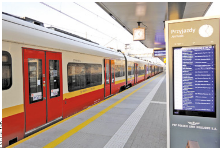
W 2026 roku ekrany pojawią się na stacjach Nowa Iwiczna, Piaseczno, Zalesie Górne, Ustanówek, Czachówek Górny i Czachówek Południowy

Elektroniczne tablice z rozkładem jazdy, monitoring i system nagłośnienia