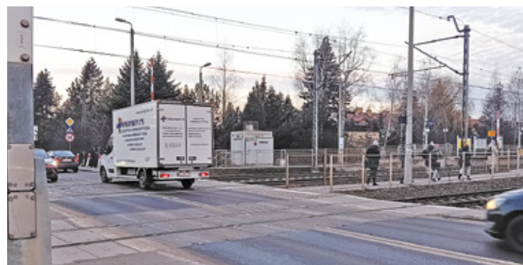
Blisko 1,5 tys. mieszkańców domaga się podjęcia działań w sprawie utrudnień na przejeździe w Nowej Iwicznej