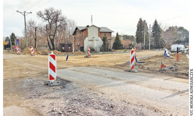
Radni zwrócili uwagę na to, że przedstawione propozycje były, według nich, nieprecyzyjne

– Rada Miejska Gminy Konstancin-Jeziorna wyraża negatywne stanowi-