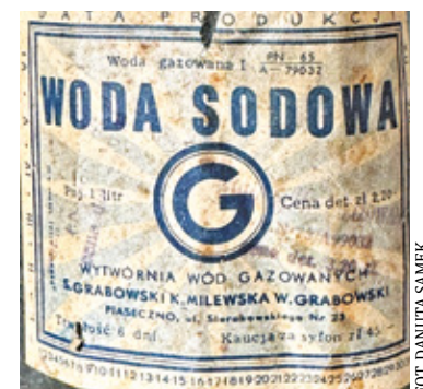
Etykieta syfonu do wody sodowej z kolekcji Danuty Samek

zwłaszcza przed świętami kolejka stała na zewnątrz. O tej rodzinie wiem