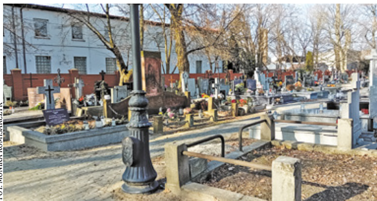
Pomnik ma upamiętniać strażaków zmarłych w wyniku akcji ratunkowych oraz tych, którzy zginęli podczas II wojny światowej

Nowy pomnik posiadać będzie tablicę z nazwiskami strażaków i dykacją.