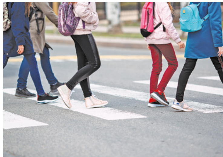
Policja potwierdza, że zgłoszenie o zaczepiających dzieci dorosłych odnotowano na Krajowej Mapie Zagrożeń

Informacja o obcej osobie mogącej zaczepiać dzieci nie została potwier-