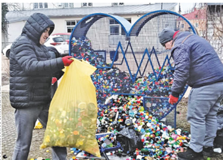
Na zdjęciach widać śmieci, które mieszkańcy postanowili wcisnąć przez niewielki otwór do pojemnika

– Podczas kolejnego opróżnienia przez WTZ Góra Kalwaria okazało się, że wrzucono tutaj m.in. opakowania po lekach, baterie, żarówki oraz... od-