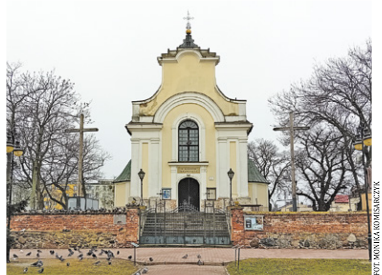
Prace są realizowane w ramach Rządowego Programu Odbudowy Zabytków