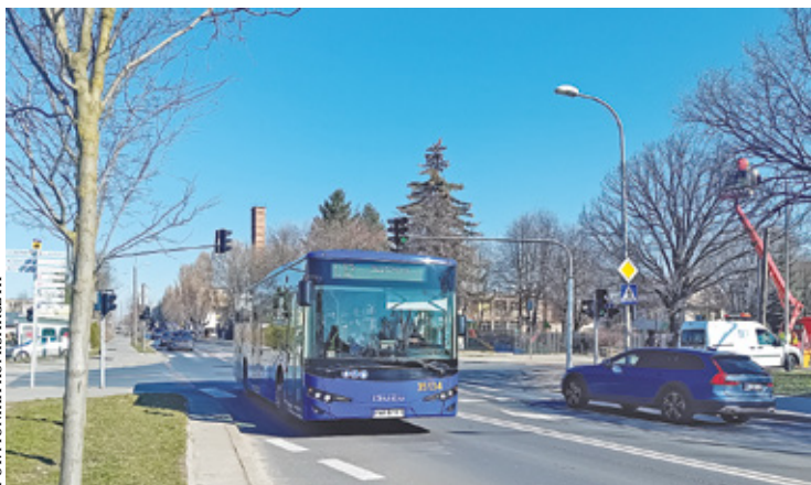
Mieszkańcy proszą o powrót autobusu na Lipową. W ten sposób mogliby oni skorzystać z dojazdu do biblioteki, przychodni, poczty czy przedszkola

– Trasa zmieniana jest bez naszego udziału i uwzględnienia naszych potrzeb. Wydłużenie trasy spowoduje