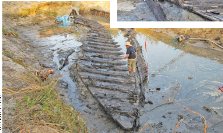
Statek odkryty w 2009 roku. Pod ziemią przeleżał ponad 500 lat

W tej chwili statek jest całkowicie rozczłonkowany. Zdaniem dyrektora Brzezińskiego już za 2-3 lata powinien być składany. A to już ma być wykonane w miejscu wystawy. – Dlatego zdaniem doktora Rytko już teraz trzeba myśleć, jak ma obiekt wyglądać. Czas ma znaczenie. Państwowe Muzeum Architek-