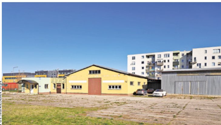
Gmina od 2017 roku podejmuje starania o wykupienie nieruchomości