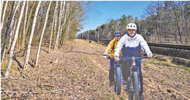
Do starostwa petycja wpłynęła 14 października. Inwestycja znalazła się w tegorocznym budżecie powiatu

Niestety, trasa jest obecnie bardzo wyboista, okresowo zupełnie nieprzejezdna z uwagi na kałuże i zalegające błoto, a sam teren stwarza potencjalne niebezpieczeństwo, szczególnie dla dzieci, ze względu na brak zabudowań na tym odcinku oraz duże zalesienie i zakrzewienie, przez co wszelkie bez-