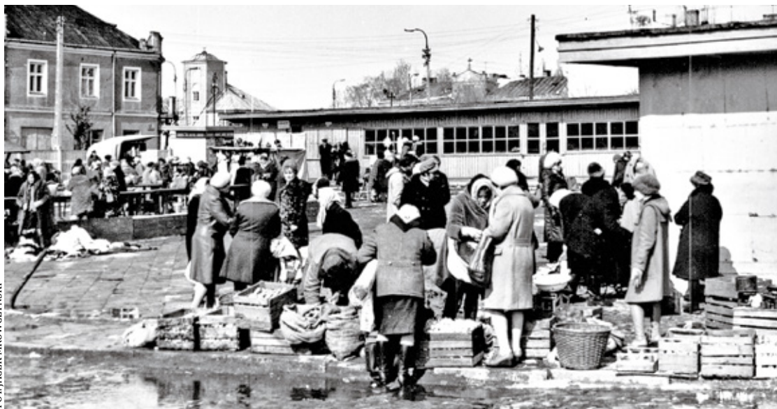
Gospodynie sprzedające owoce i warzywa

ogródkach. Układały w miseczkach z wodą małe bukietki z pachnących konwalii, tulipanów i narcyzów, jesienią duże bukietki z niebiesko-fioletowych marcinów. Najpiękniejsze były peonie, cudownie pachniała ostróżka. Pamiętam kwiaciarke, która co wtorek i piątek pakowała swoje kwiaty na dziecięcy, spacerowy wózek i szła z ulicy Chopina na targowisko. Tak się z nią zaprzyjaźniłam, że przychodziłam po kwiaty do niej do ogrodu już od wczesnej wiosny, gdy pojawiały się pierwsze tulipany. Wiosną można było kupić u pana miotlarza miotły, które trzeba było opukać, aby długo służyły, bo zrobione były z