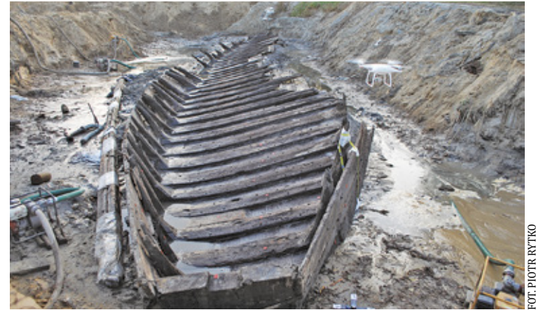
Miłośnicy zabytków cieszą się, że archeolodzy chcą, by szkuta wróciła na miejsce, w którym została odkryta

pem nieruchomości zostaną przeprowadzone badania geotechniczne, które mają potwierdzić, że ten grunt nadaje się do posadowienia obiektu Muzeum Szkuty Czerskiej – dodaje. Badania zleci Państwowe Muzeum Archeologiczne, a zapłaci za nie samorząd województwa. W listopadzie 2024 r. radni zdecydowali o przeznaczeniu 1 mln 900 tys. zł na zakup działki przez wojewódzki samorząd.