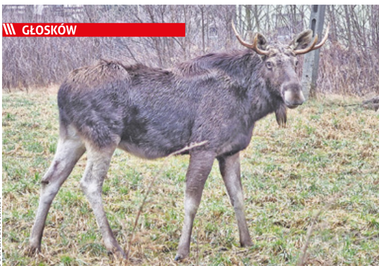
Ulubionymi miejscami spacerów dla łosia okazały się okolice ulic Granicznej, Parkowej i Lipowej

||| Józefosław - Legalna ściana do graffiti s. 8