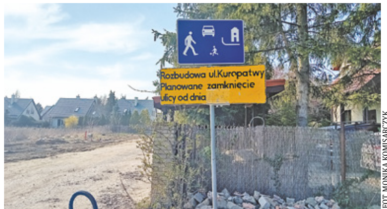
Problematiczne okazało się przejęcie wskazanych w decyzji ZRID fragmentów prywatnych nieruchomości

Investycja od początku budziła emocje i niepokoje wśród mieszkańców, jednak gmina Piaseczno podkreślała, że modernizacja tej drogi jest niezbędna ze względu na natężenie ruchu oraz niewystarczającą szerokość jezdni.